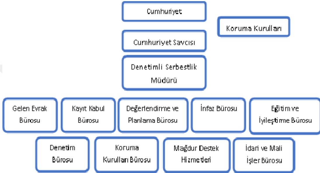
Şekil 2.2: Denetimli Serbestlik Taşra Teşkilatı