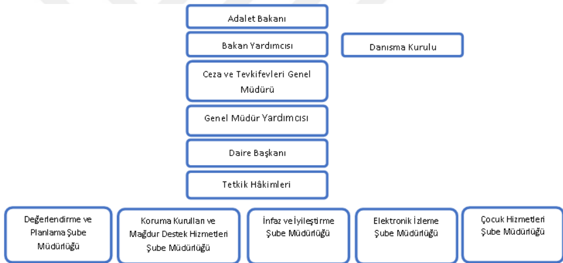
Şekil 2.1: Denetimli Serbestlik Merkez Teşkilatı