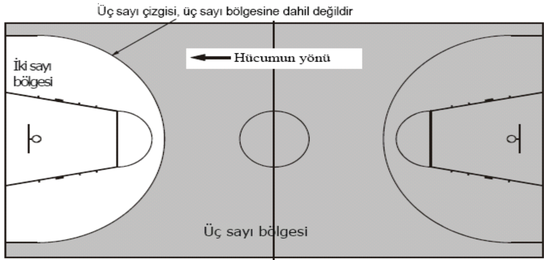
Şekil 2.3. Basketbol sahası sayı bölgeleri görseli.

Basketbol takımlarındaki her oyuncunun maç boyunca 4 faul yapma hakkı vardır.5. faulünü yapan oyuncu oyun dışı kalır.