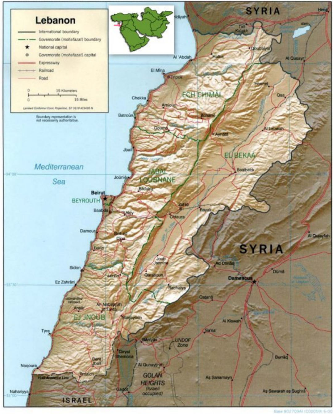
Lübnan Haritası - II