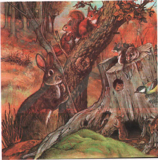
RESİM 2: “KÜÇÜK TAVŞAN”