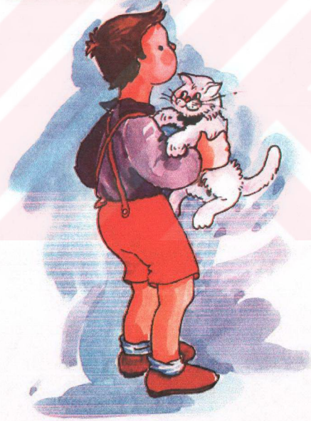
Resim 1: "AKILLI ÇOCUKLA YARAMAZ KEDİ"