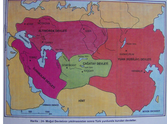
Harita 2: Moğol Dünyası ve Altın Orda Devleti

Altın Orda Devleti'nin sınırlarını gösteren yukarıdaki harita 1 ve 2 aynı dönemi ele almaktadır. Ancak harita 1 (MEB 1993: 118) renksiz olması ve yazıların özensiz olması nedeniyle tam olarak amacına hizmet edememektedir. Harita 2 (Kara 1998: 180) ise renkli olması ve yazıların net okunabilmesi nedeniyle daha iyidir. Renkli haritalar öğrencilerin algılamalarını arttırması için önemlidir.