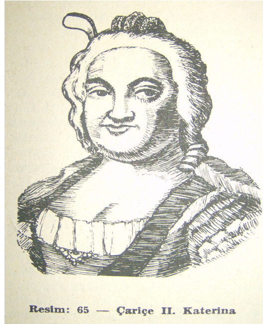
Resim: 65 — Çariçe II. Katerina