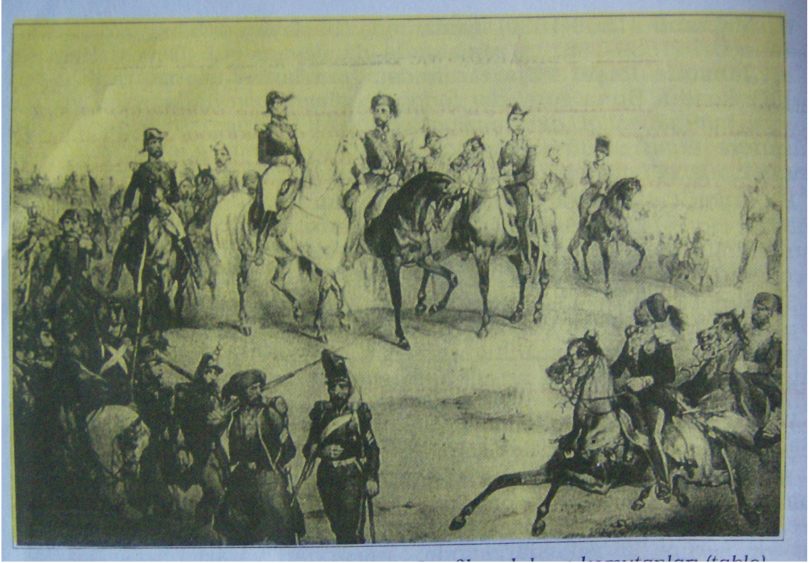
Resim 4: Kırım Savaşı'na Katılan Müttefik Orduların Komutanları

Sonuç olarak resimlerin sıkça kullanıldığı görülmektedir. Ancak resimlerde kimi zaman görüntüler net değildir. Çoğunluk olarak tarih ders kitaplarında resimler uygun yerlerde ve gerekli oranda kullanılmıştır denilebilir.