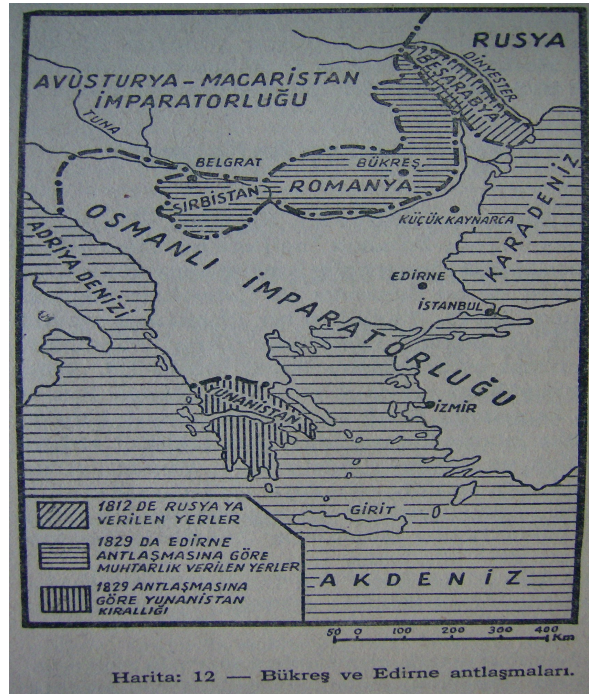
Harita 9: Bükreş ve Edirne Antlaşmaları

Aşağıdaki harita 9 ve 10 Osmanlı Devleti için önemli sonuçlar doğuran konuları ilgilendirmektedir. Harita 9 (Oktay 1975: 232) Bükreş (1812) ve Edirne (1829) Antlaşmaları’nı göstermektedir. Ancak tek bir haritada iki olay birden gösterilmek istenmiştir. Bu da haritanın karmaşık olmasına neden olmuştur. İki antlaşmanın ayrı olarak ele alınması daha uygun olacaktır. Harita 10 (Kara 1995: 143) ise Küçük Kaynarca Antlaşması’nı göstermektedir. Bu harita görüntü açısından, lejantı ve bir ölçek doğrultusunda yapılmış olması bakımından amacına uygun bir haritadır.