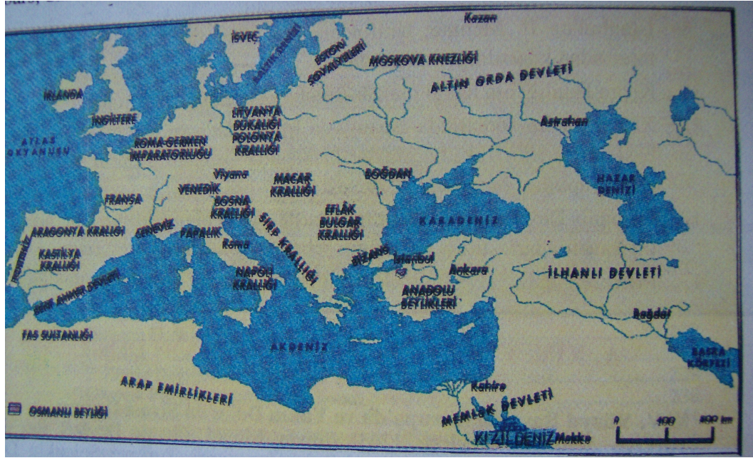
Harita 3: Altın Orda Devleti

Yukarıdaki haritada (Ergezer 1995: 10) devletlerin sınırları gösterilmemiştir. Bu haritada yazılar kaymıştır ve okunmaları güçleşmiştir. Bu tür haritalar birçok ders kitabında vardır. Bunları daha düzenli olarak vermek gerekmektedir.