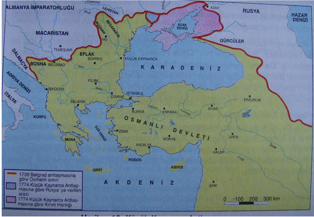
Harita 10: Küçük Kaynarca Antlaşması

Sonuç olarak haritaların ders kitaplarında sıklıkla kullanıldığı görülmektedir. Ancak haritaların belirli noktalarda eksiklikleri bulunmaktadır. Haritaların çoğu zaman görüntüleri net değildir. Ayrıca kimi zaman kullanıldığı yerler uygun değildir. Anlatılan konu ile bütünlük göstermemektedir. Bunun yanında renksiz olmaları, kimi zaman lejantlarının olmaması, belirli bir ölçeğe göre çizilmemeleri, yazıların okunmaması ve sınırların belirgin olmaması haritaların genel eksiklikleri arasında gösterilebilir. Son dönemlerde ise kullanılan haritalar öncesine göre epey yol almıştır. Özellikle 1980 sonrası ders kitaplarındaki haritalar amacına daha çok hizmet eder durumdadır.