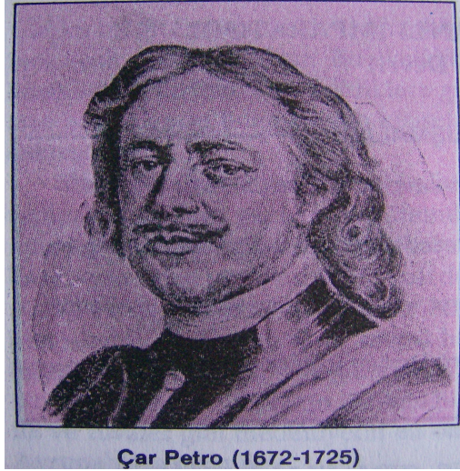
Çar Petro (1672-1725)