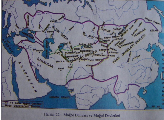
Harita 1: Moğol Dünyası ve Altın Orda Devleti Devleti

Bu bağlamda şunlar söylenebilir; Tarih ders kitaplarında tek başına Altın Orda Devleti'nin sınırlarını gösteren haritalar yoktur. Ancak Moğol Devleti'ni ve Moğol Devleti'nin yıkılmasından sonra kurulan Türk devletlerini gösteren haritalar vardır. Bu haritalar yeterli değildir. Çünkü ya konunun başlarında ya da sonlarındadırlar. Çoğunluğu konulduğu yer olarak uygun değildir.