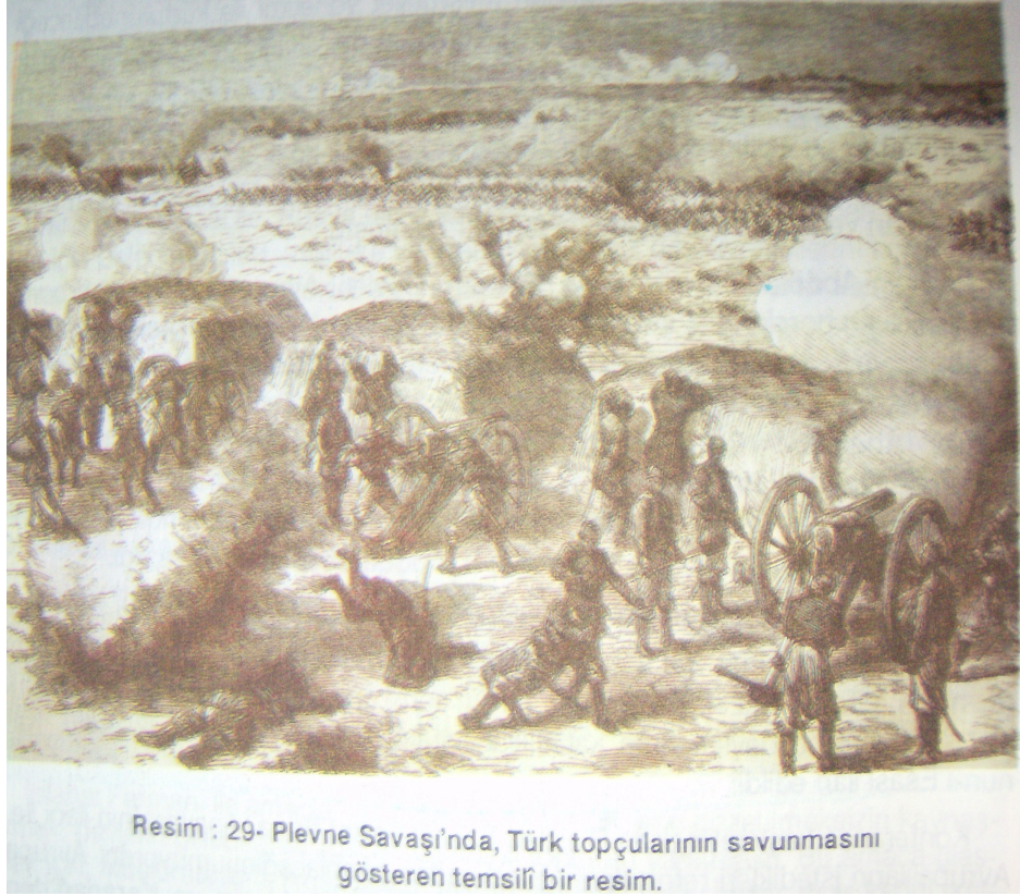
Resim 3: Plevne Savaşı'nda Türk Topçuları

Resim 3'e bakıldığında görüntü kalitesinin çok kötü olduğu görülmektedir. Plevne Savaşı gösterilmek istenmiştir; ancak çok dikkatli bakıldığında bile görüntü net seçilememektedir. Tarih ders kitaplarında bu türden haritalar sıklıkla kullanılmıştır. Bir örnek olması için yukarıdaki resim araştırma kapsamına alınmıştır. Bu tür resimler net olmadığı için kullanım amacına hizmet edebilecek durumda değildir.