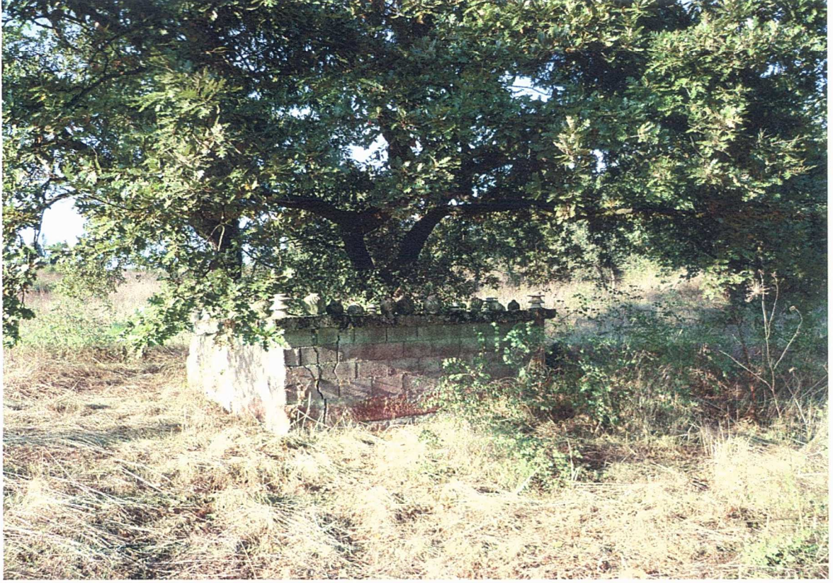
Durali Köyü (Sinan Baba) Yatırı'ndan bir kare