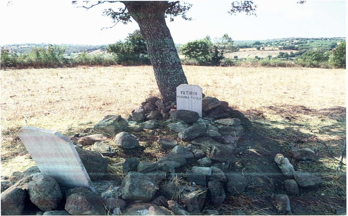
Şerbetli Köyü Yatırı'ndan bir kare