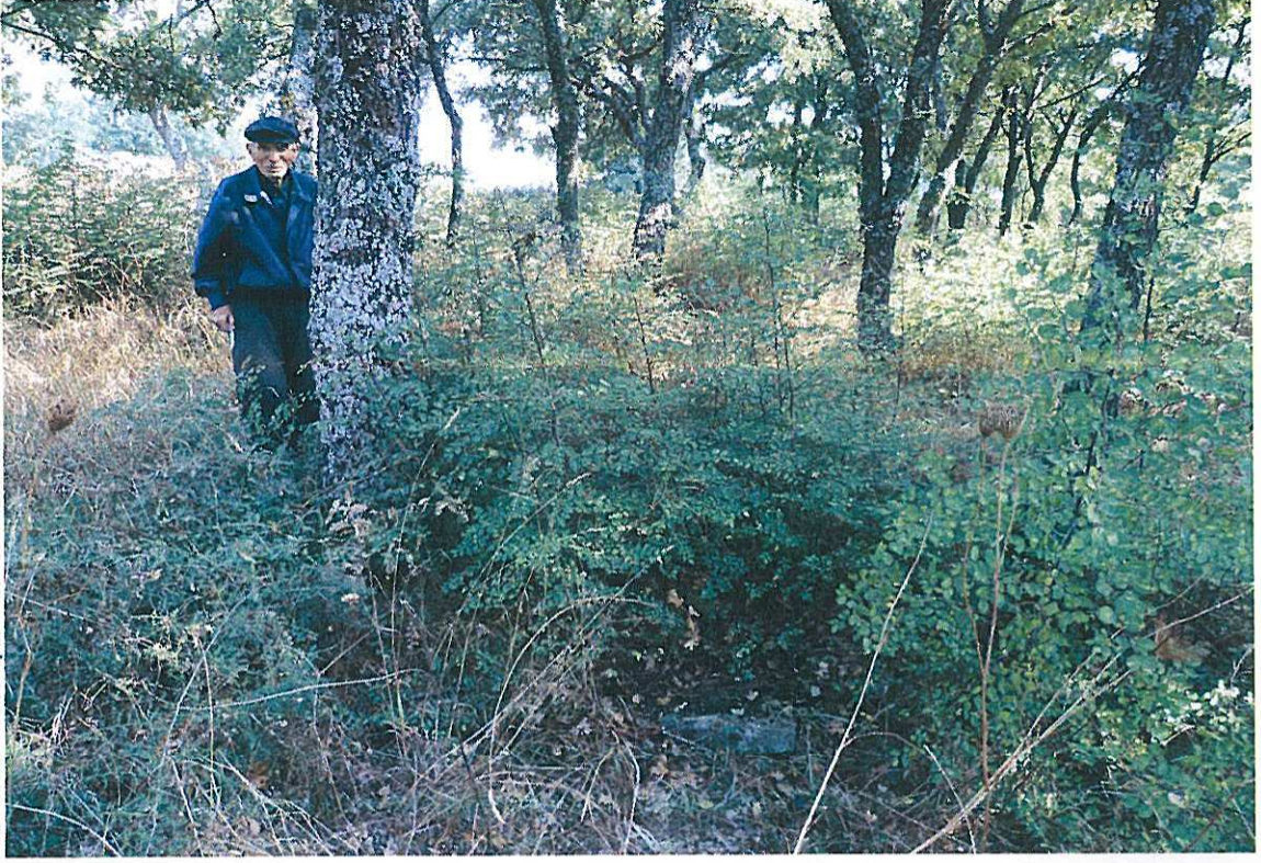
Paa Dede Yatırı'ndan bir kare