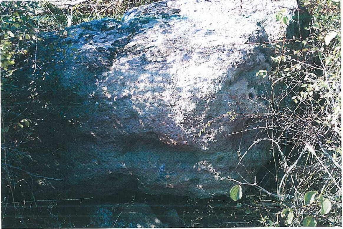
Hz. Ali Taşı'ndan bir kare