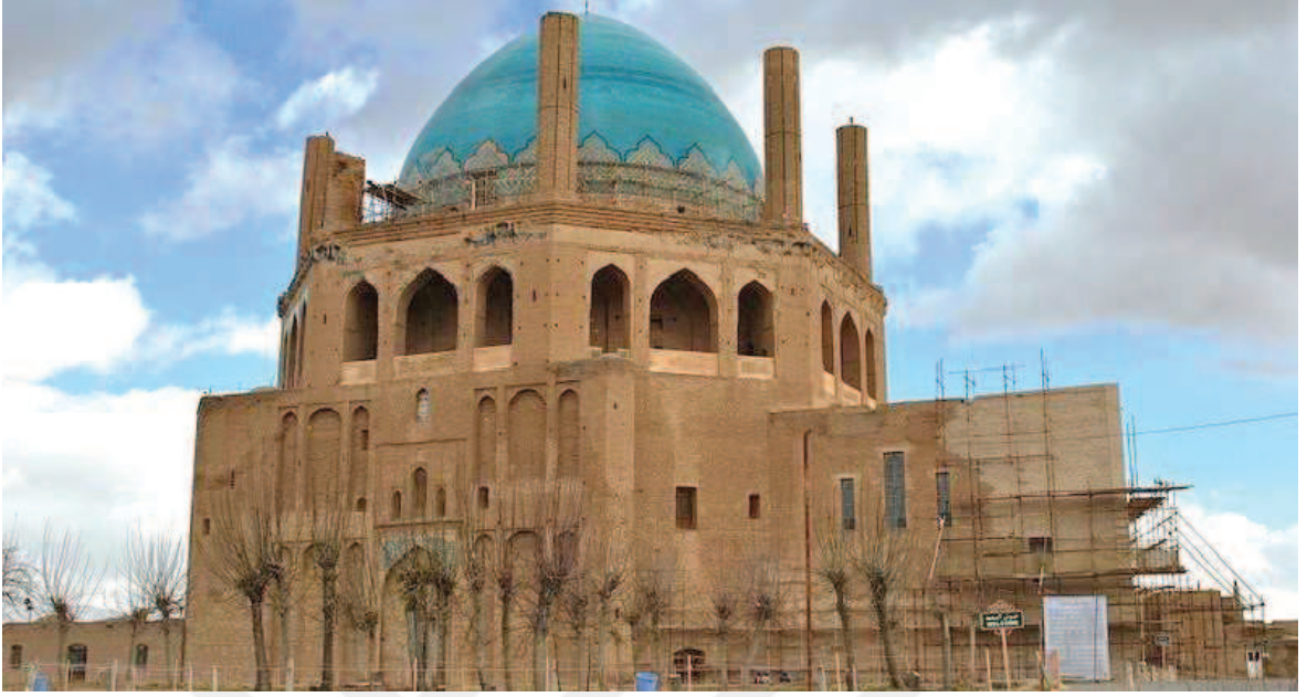
Ek 3: Ölceytü Han'ın Sultaniye şehrinde bulunan türbesi.