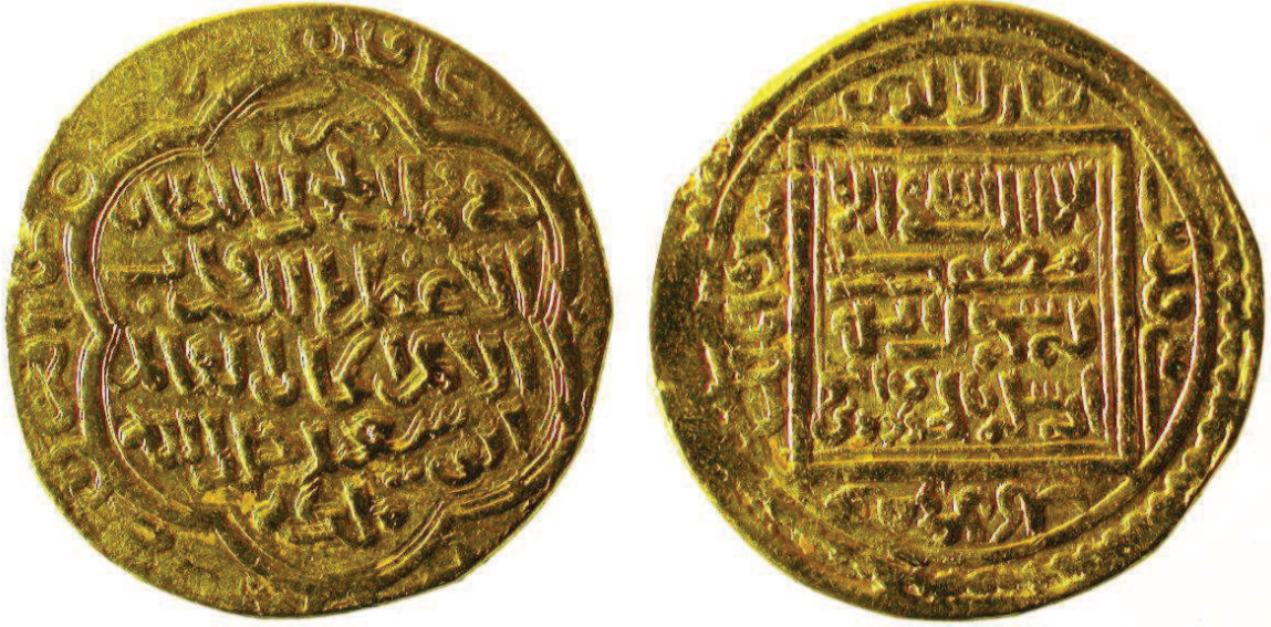
Ek 2: Ebû Saîd Bahadır Han dönemine ait bir sikke

Kaynak: http://tokakte.dk/uploads/1112887582_LPicture_1a2191.jpg (Ulaşım Tarihi 20-02-18).