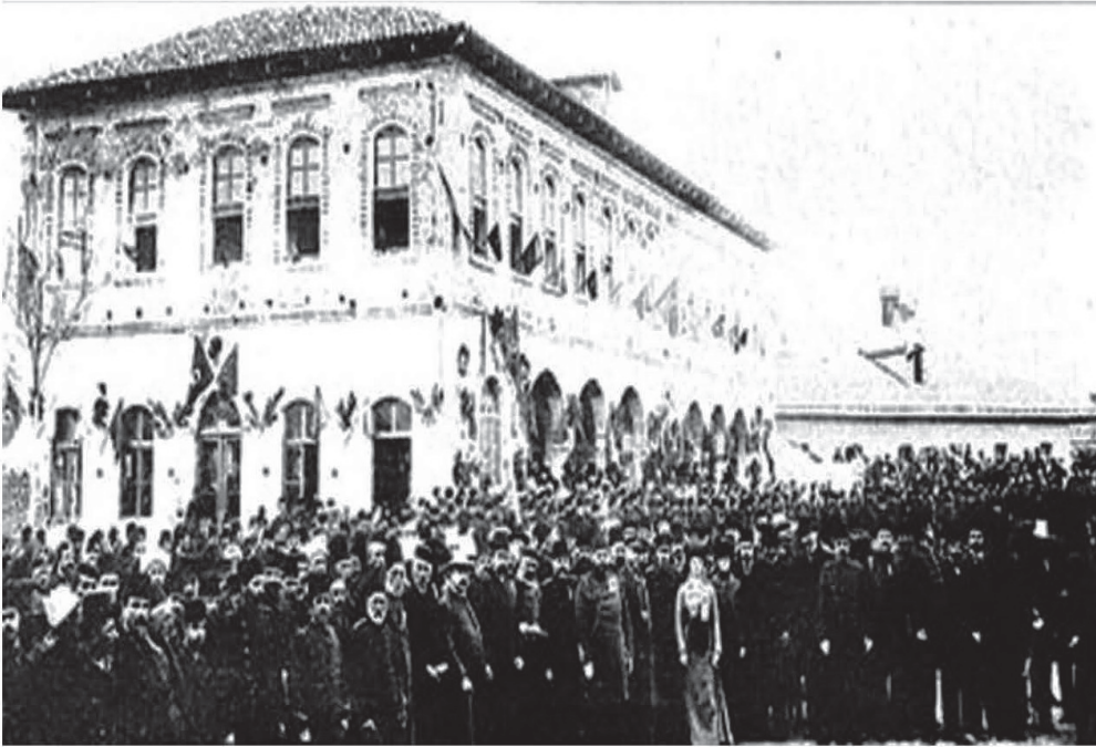
Şkodra'da İnşa Olunan Mekâtib-i Rüşdiye-i Askeriye'nin Açılış Merasimi (Hasan Duman, Sultan İkinci Abdülhamid Han Devri Osmanlı Mektepleri <Fotoğrafl ve Planlar> , s. 269)