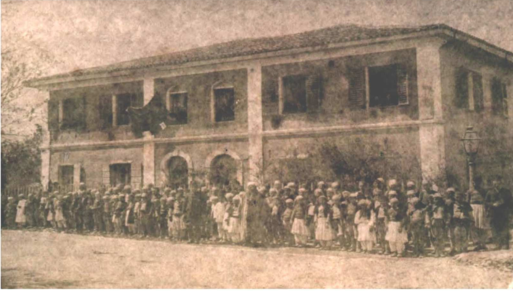
İŐkodra Rüşdiye Mektebi ( İstanbul Üniversitesi Nadir Eserler Kütüphanesi, No: 90444/15 )