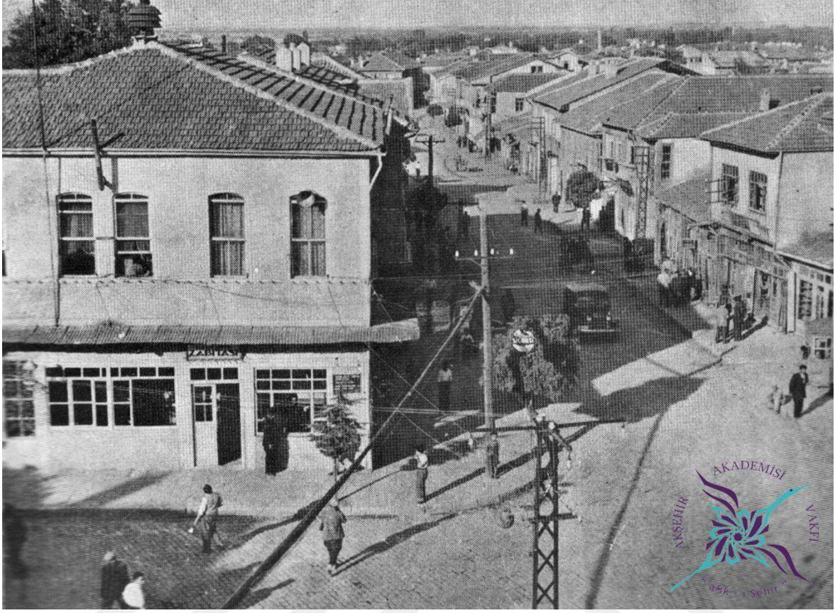
EK-16: Hükümet Binası