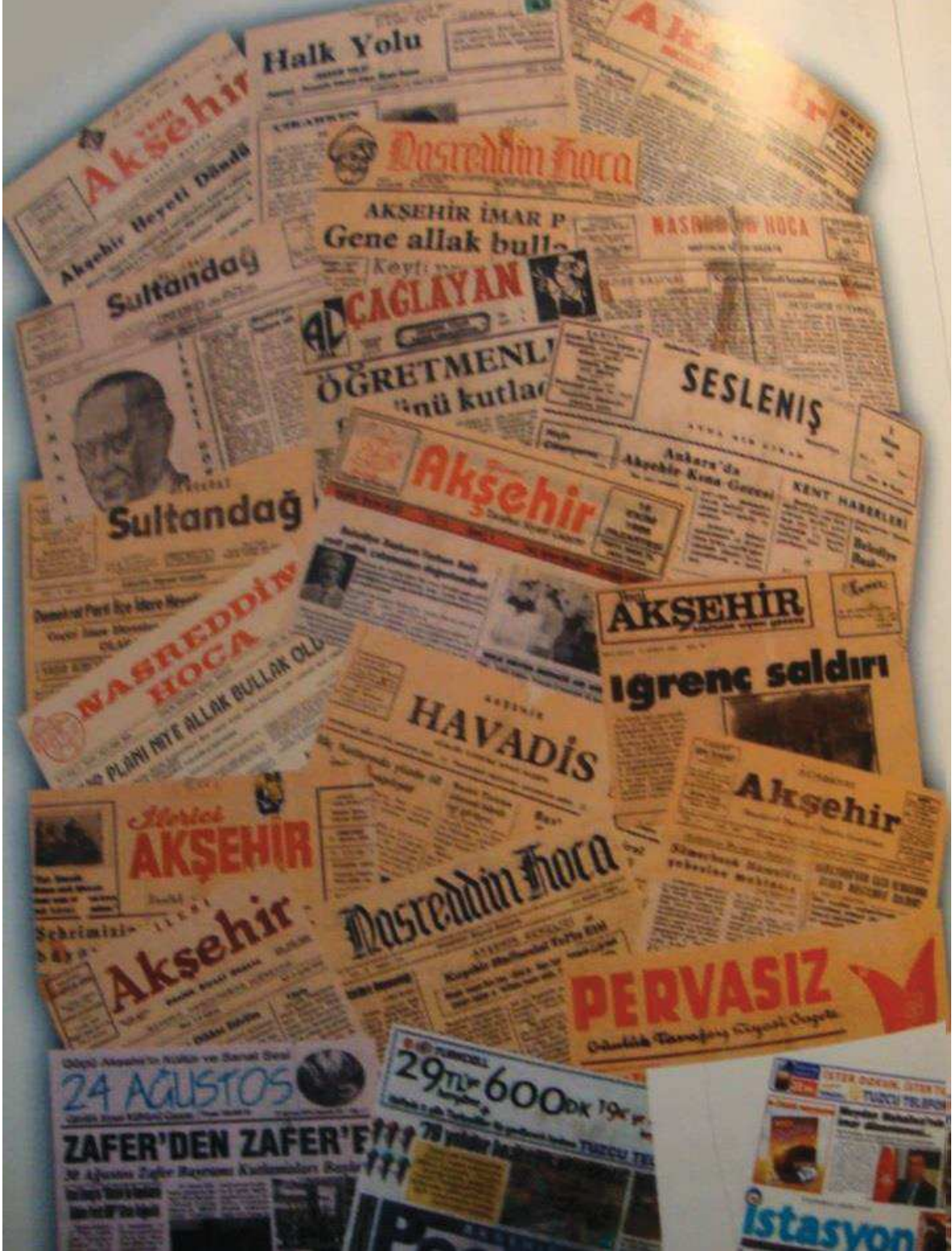
EK-1: Akşehir'de Yayınlanmış Gazeteler