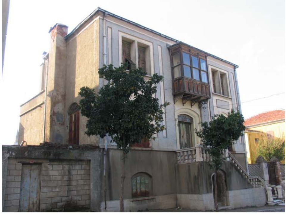
Tarihi Tire Evlerinden Gülcüoğlu Konağı