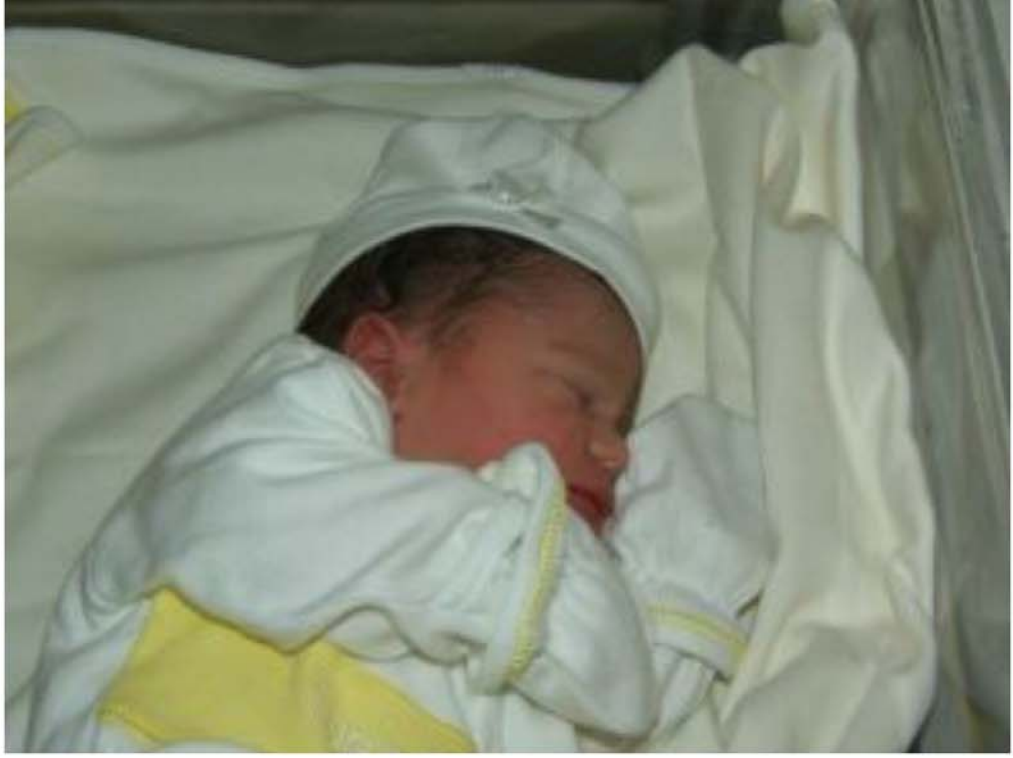
Bebęi sarılıktan korumak için sarı kıyafetler giydirilmesi