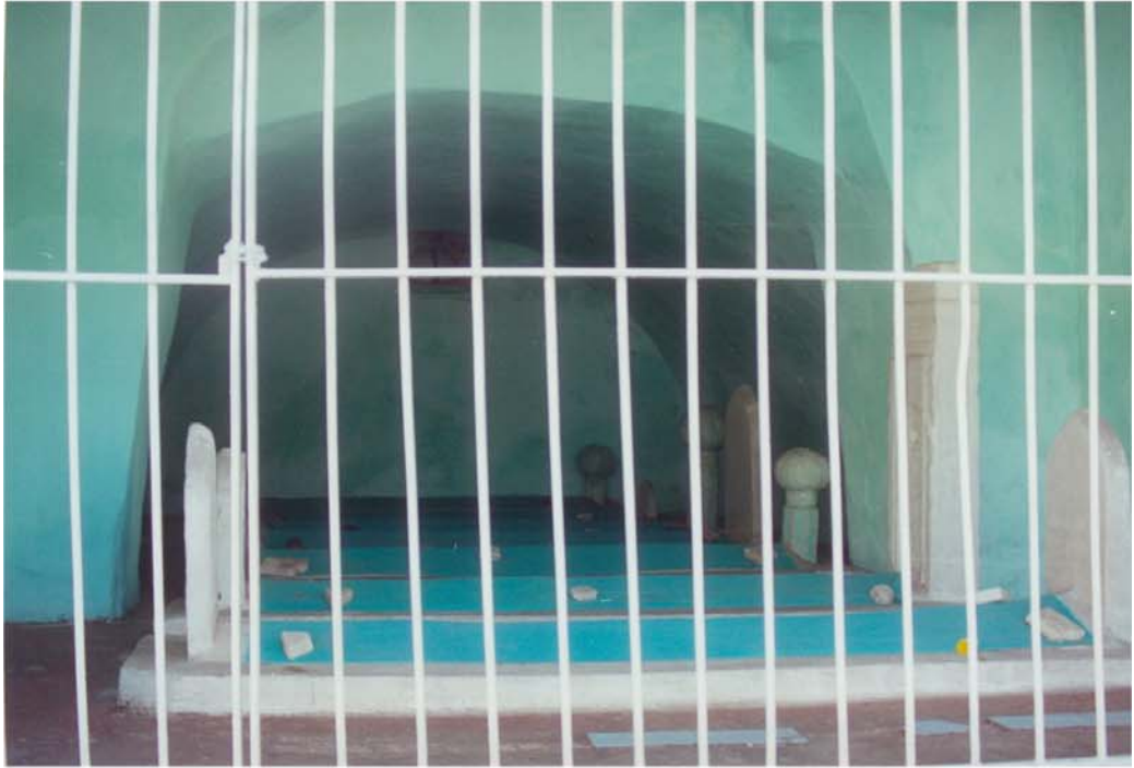
Sır Hatunlar Türbesi