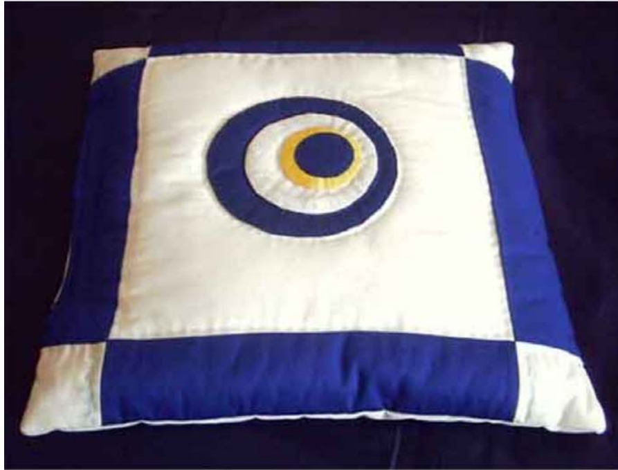
Nazar Boncuğunun ev eşyası olarak kullanılması