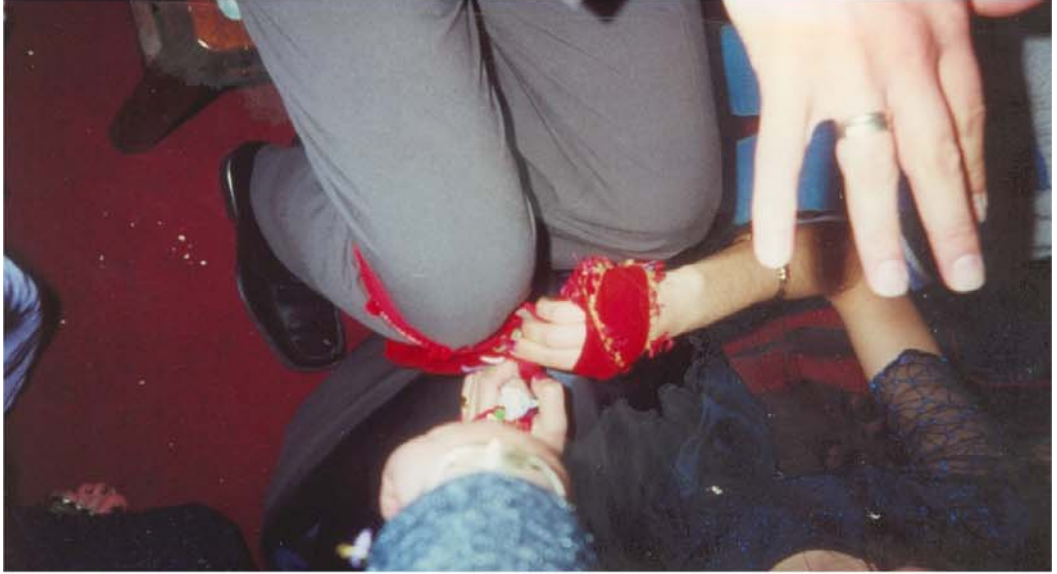
Kına gecesinde damadın yuvasına bağlı olması için ayaklarının bağlanması