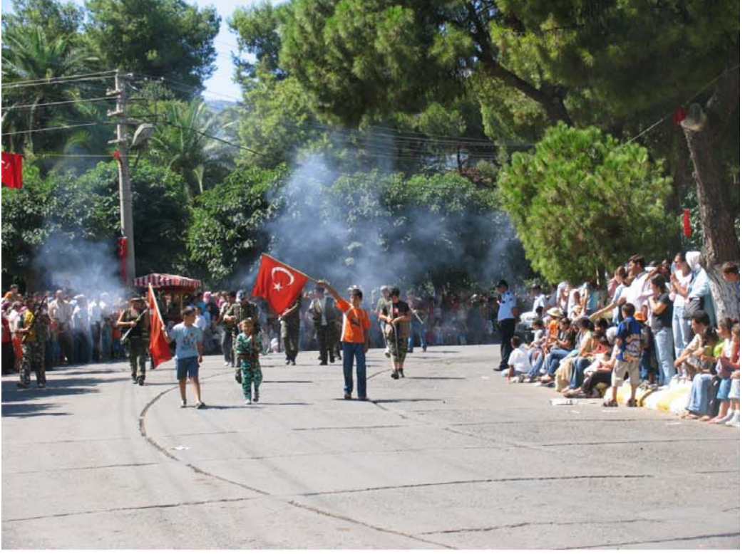
Tır'da 4 Eylül Kurtuluş Günü kutlamaları