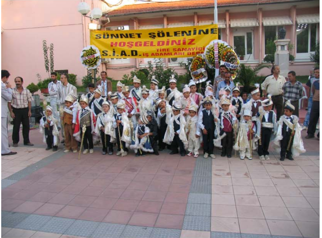
Tire Sanayici ve İşadamları Derneği'nin düzenlediği toplu sünnet düğünü