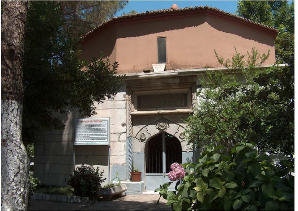
Süleyman Şah Türbesi