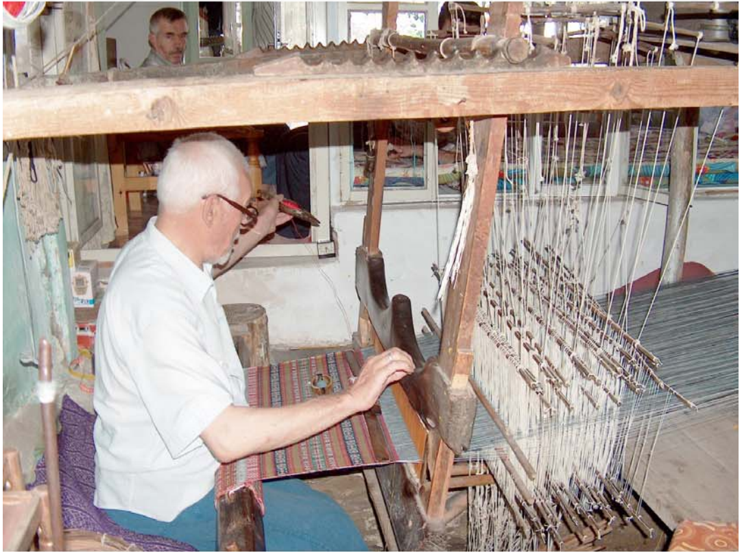
Tire'nin en eski el sanatlarından Beledi Dokuma