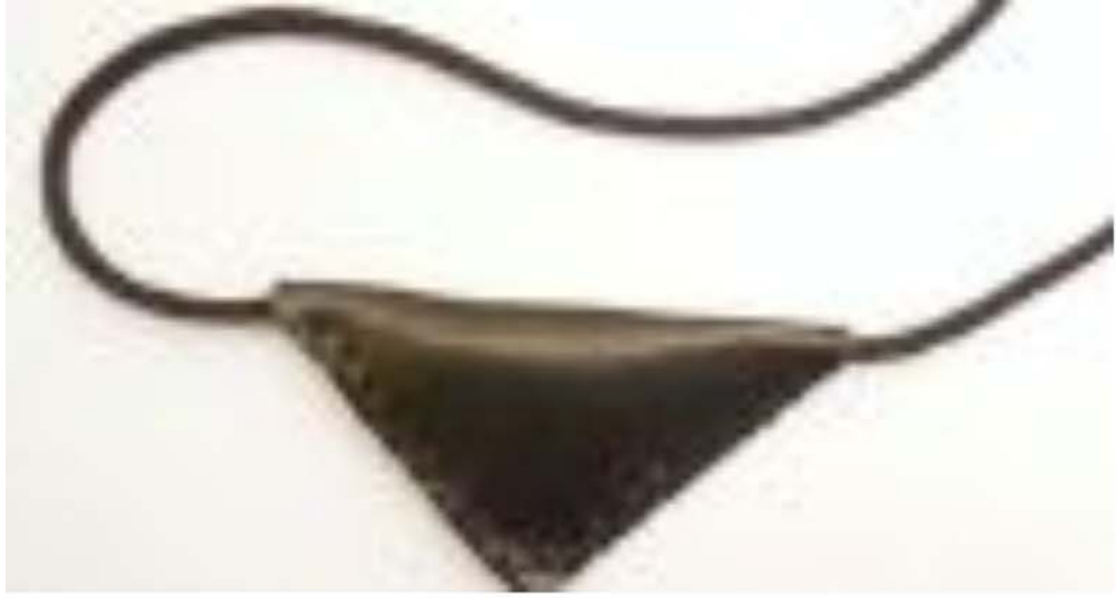
Taşıyana uğur getirdiđi inanılan Muska