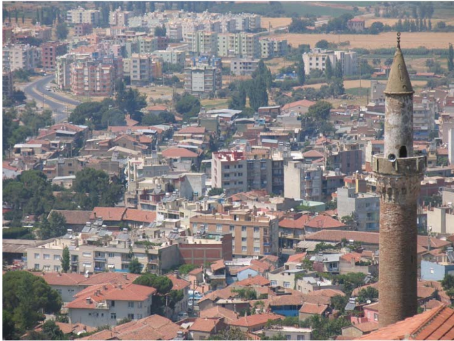
Tire'den bir görünüş