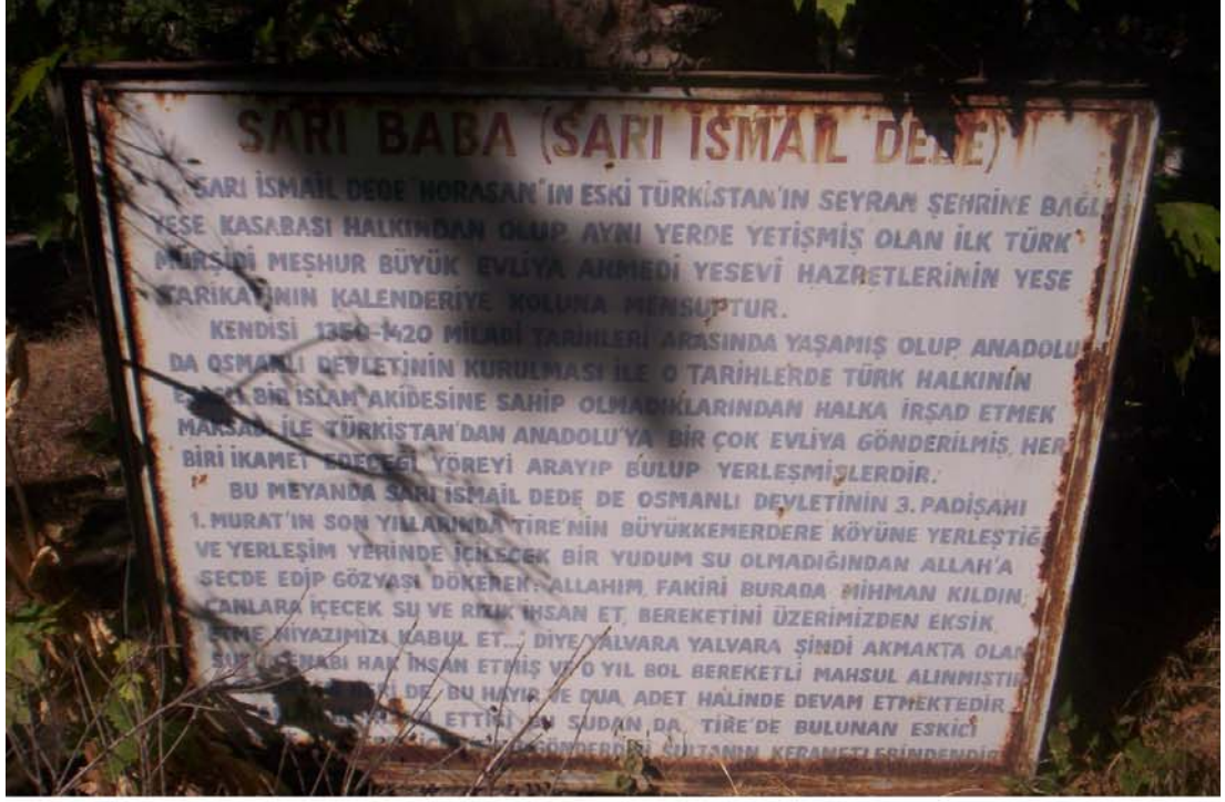
Yağmur Duası sırasında gidilen Sarı İsmail Dede Yatırı