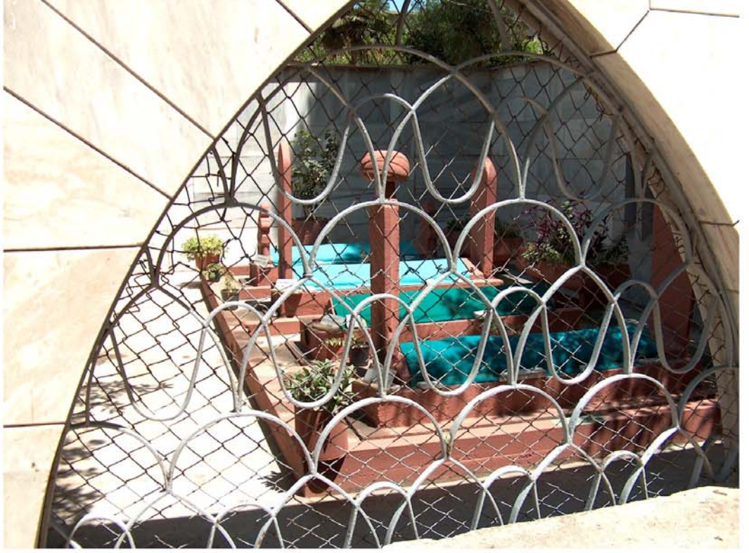
İbn-i Melek Türbesi