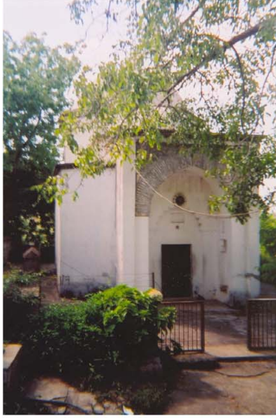
Ali Baba Türbesi