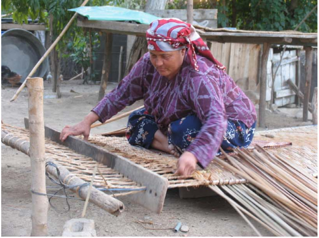
Tire'de hasır işçiliği