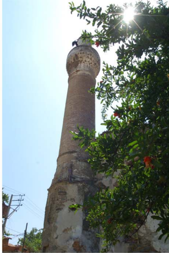
Camileriyle ünlü Tire'deki Gücür Camii