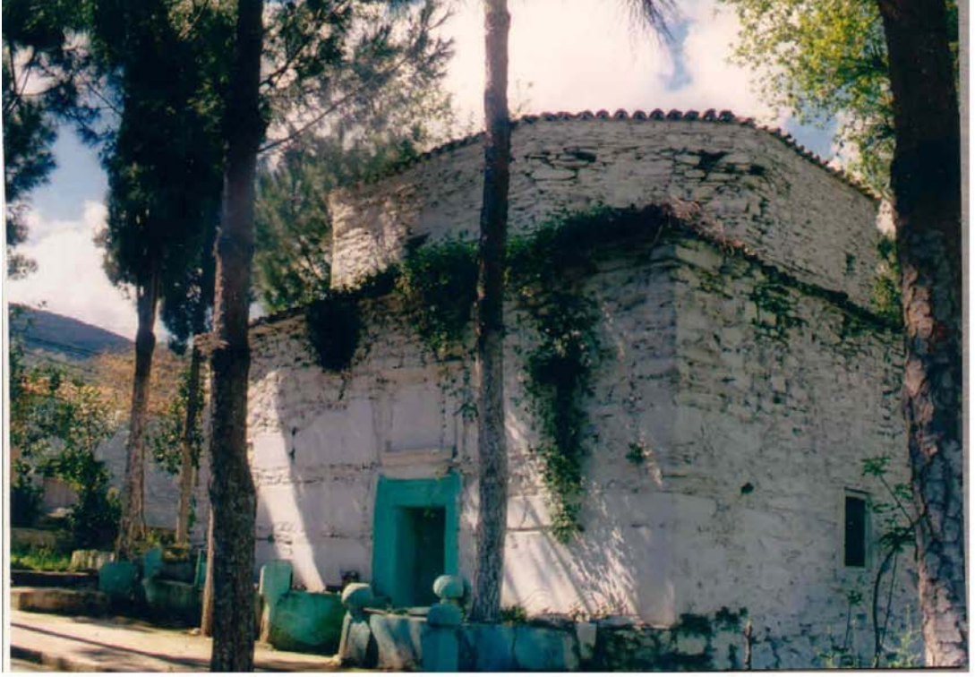
Alamadan Dede Türbesi