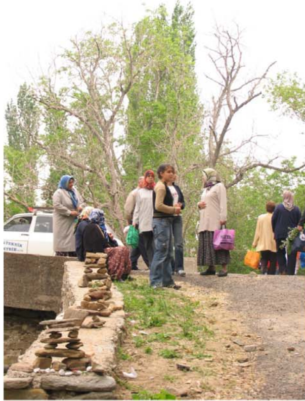
Hıdrellez Kutlamalarında dileklerinin kabulü için taşlardan şekiller yapılması