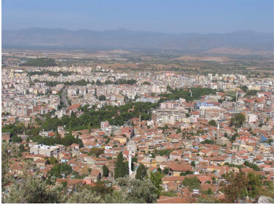
Tire'den bir manzara