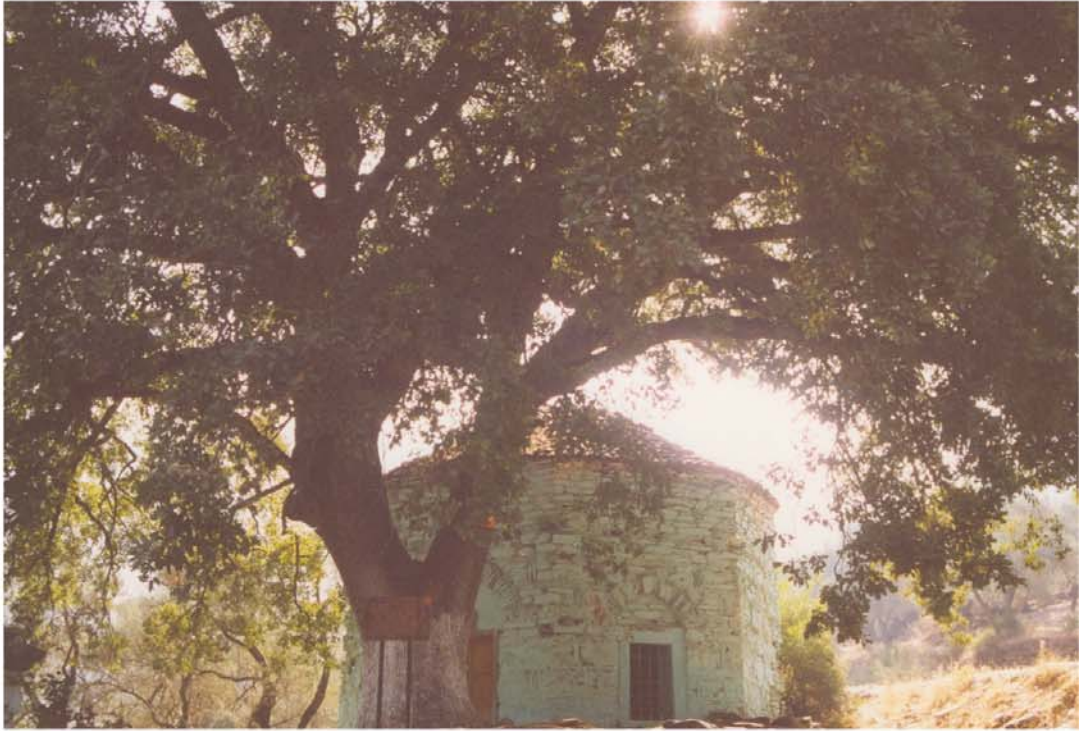
Balım Sultan Türbesi