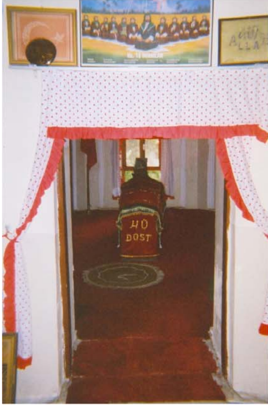
Ali Baba Türbesi (iç)