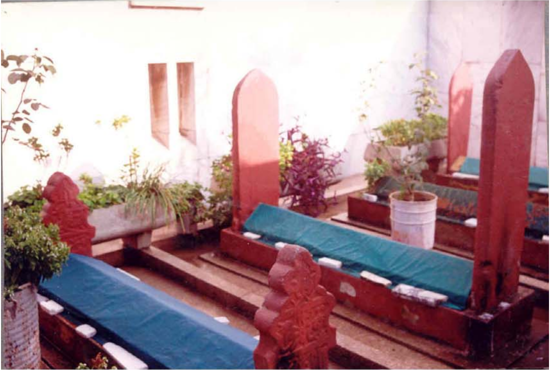
İbn-i Melek Türbesi