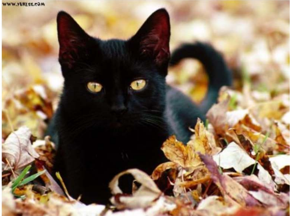
Uğursuzluđuna inanılan Kara Kedi