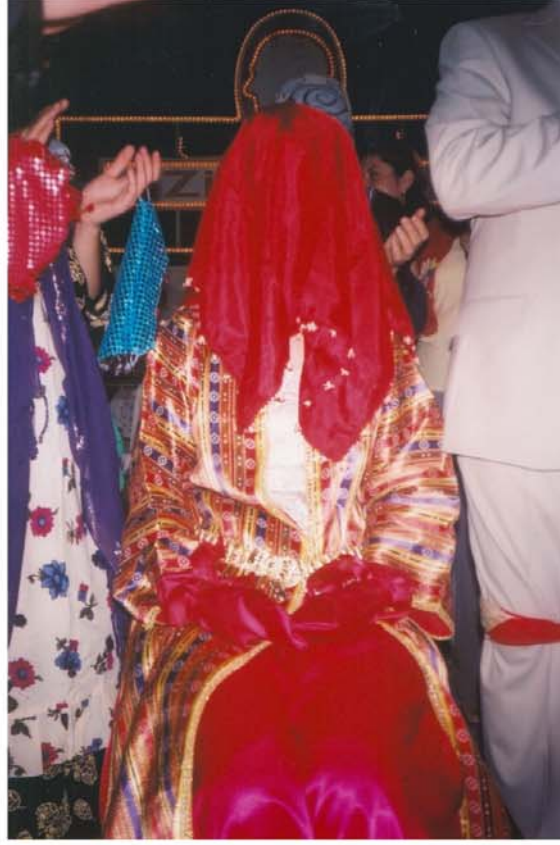
Kına gecesinde gelin kıza uğur getirmesi için başına al yazma örtülmesi