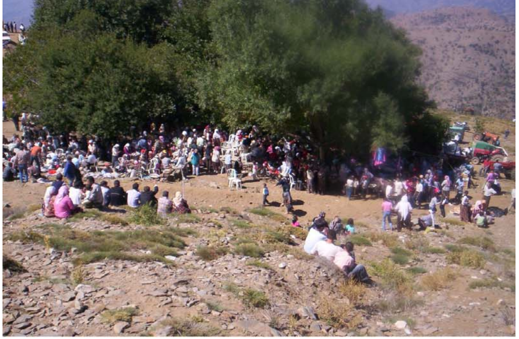
Tire'de Sultan Nevruz Kutlamaları