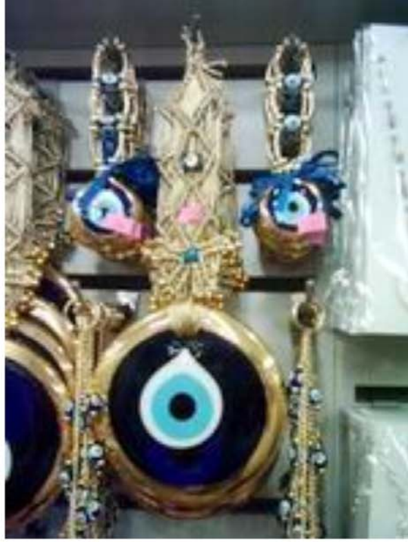
Nazarı önlediğine inanılan Nazar Boncukları