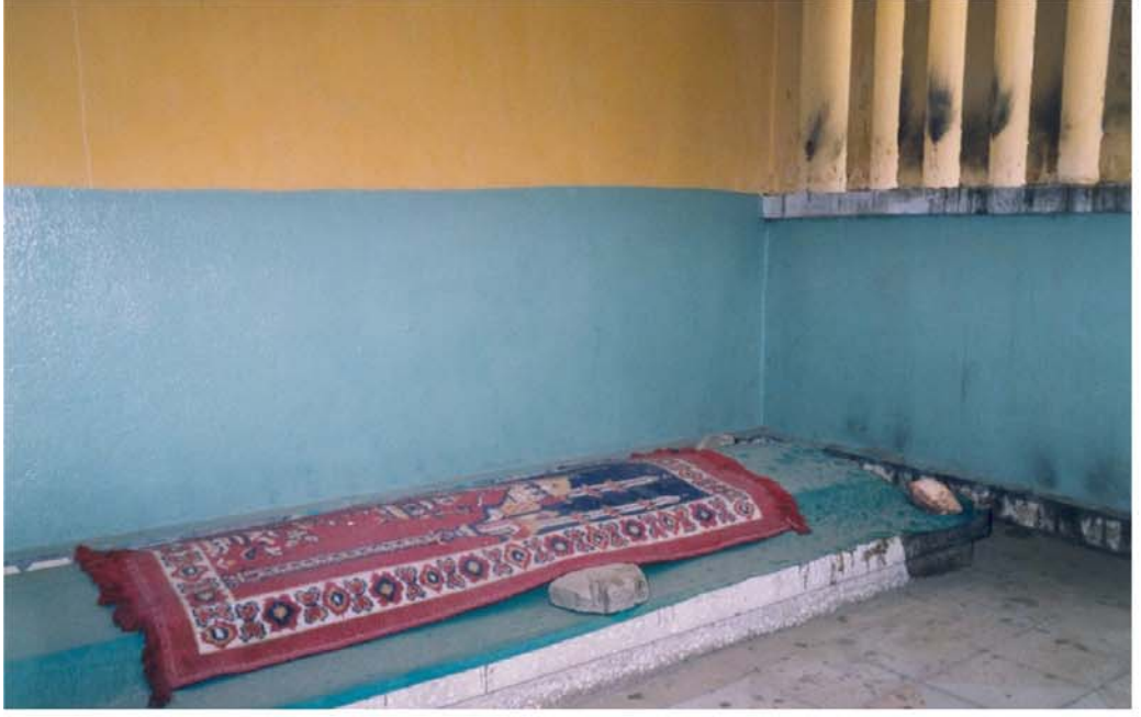
Soğan Dede Türbesi