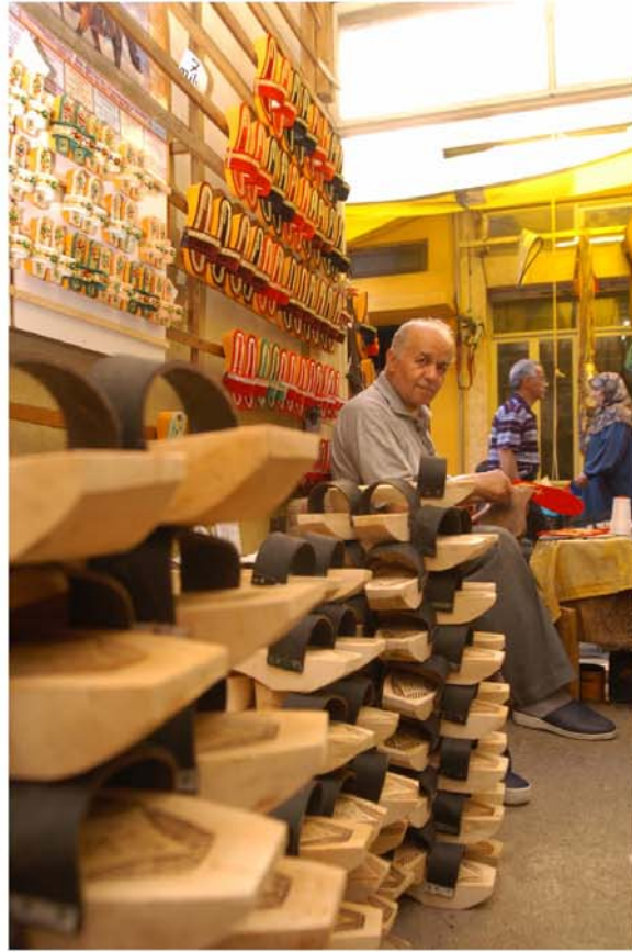
Tire'nin önemli el sanatlarından Nalıncılık