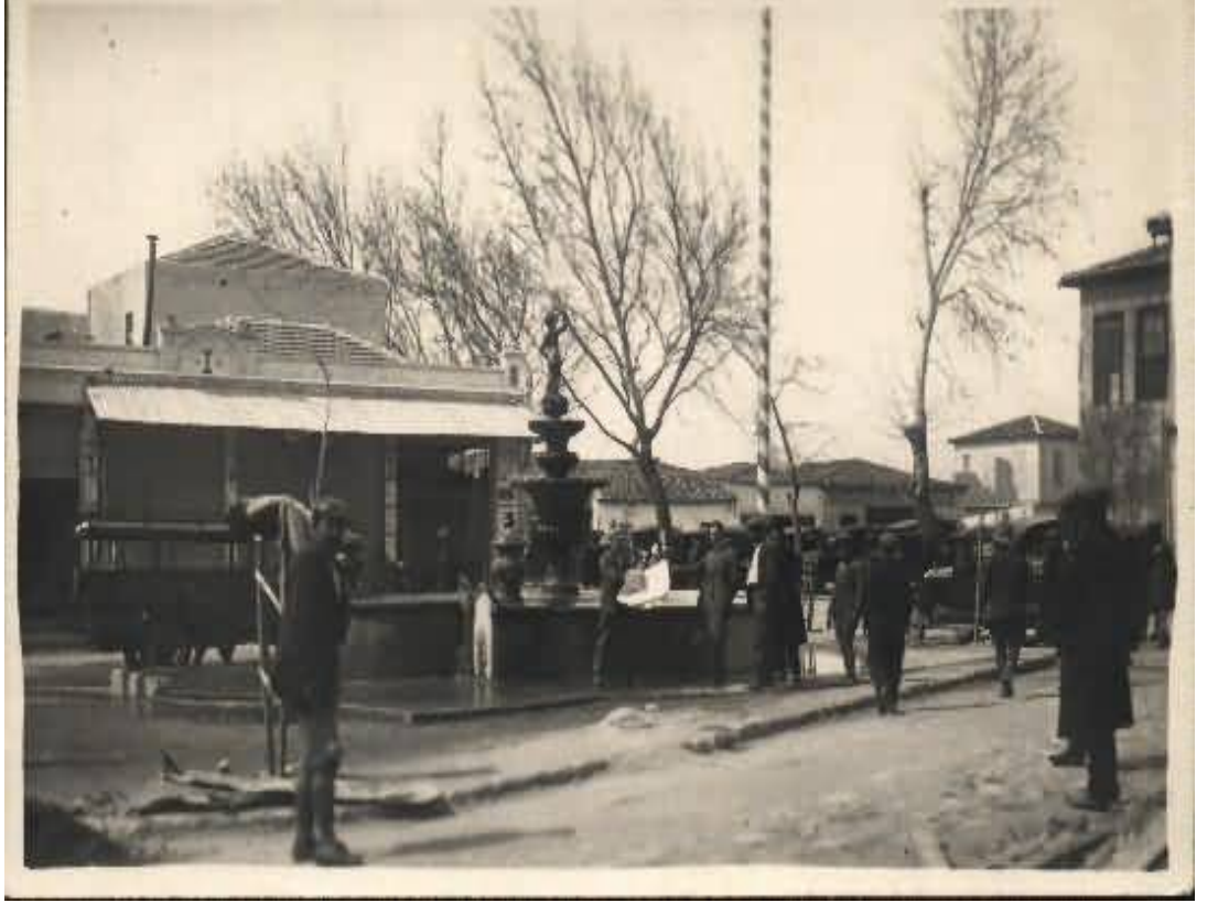
Belediye Binasının Önüne Yaptırılan Şadırvan