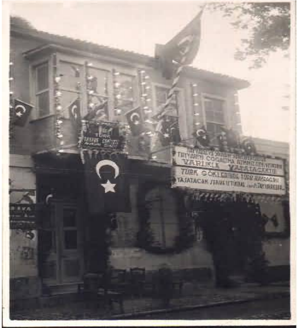
Akhisar Tayyare Cemiyeti