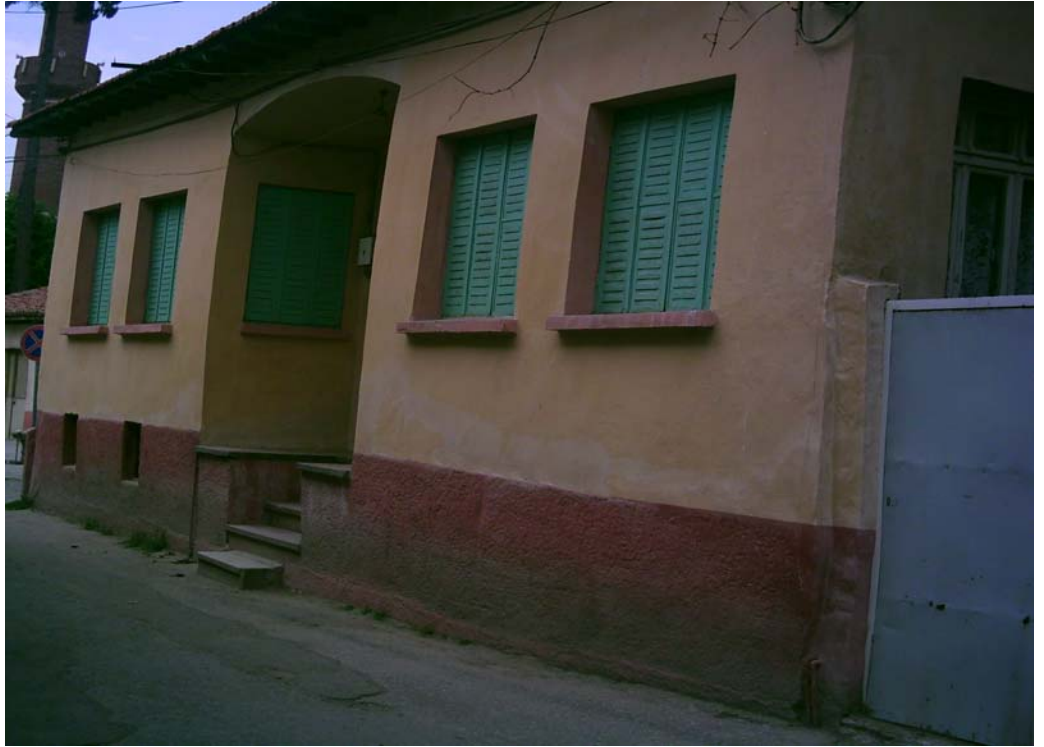
Akhisar Belediye Hastanesi Olarak Kullanılan Bina