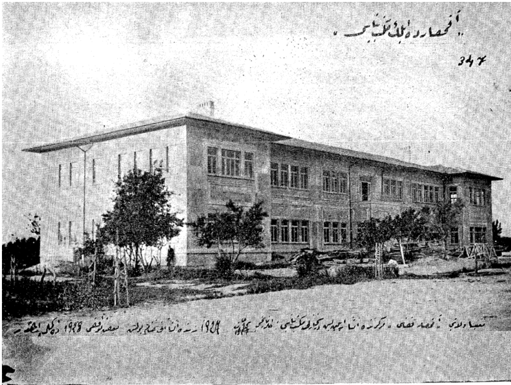
Akhisar Gazi İlkokulu