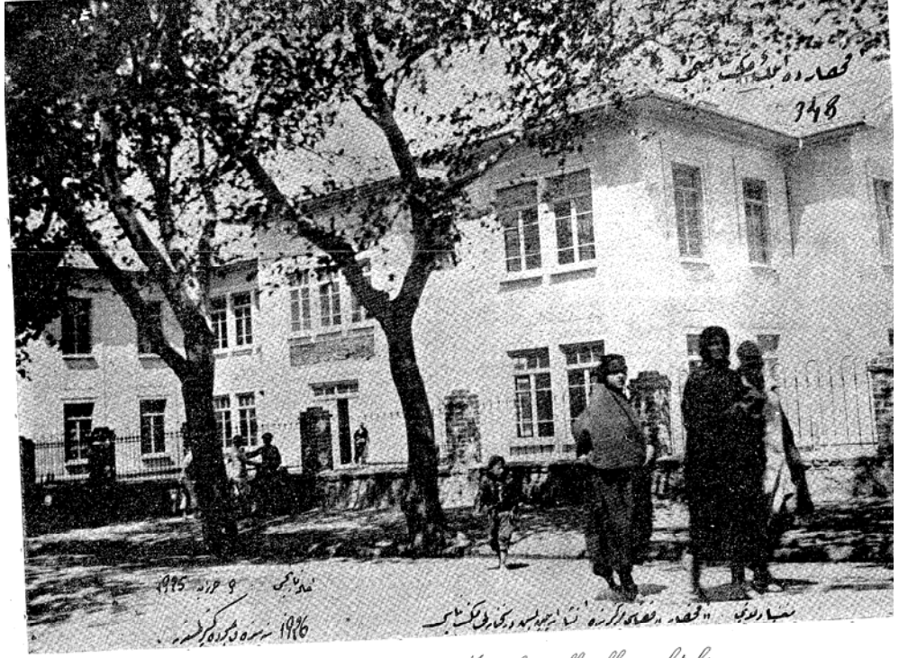
Manisa Akhisarda Misaki milli ilk mektebi