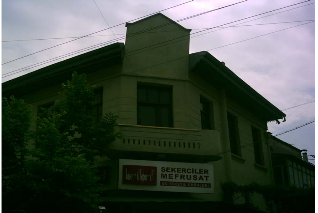
Akhisar Ziraat Bankası Binası