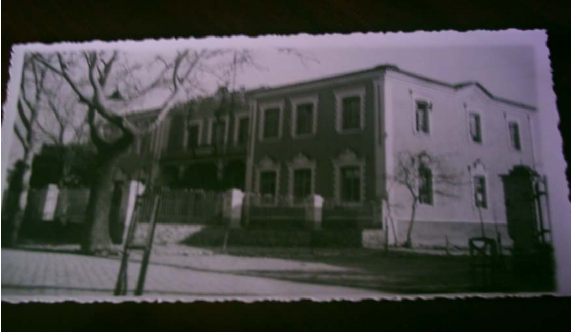
Akhisar Hükümet Binası