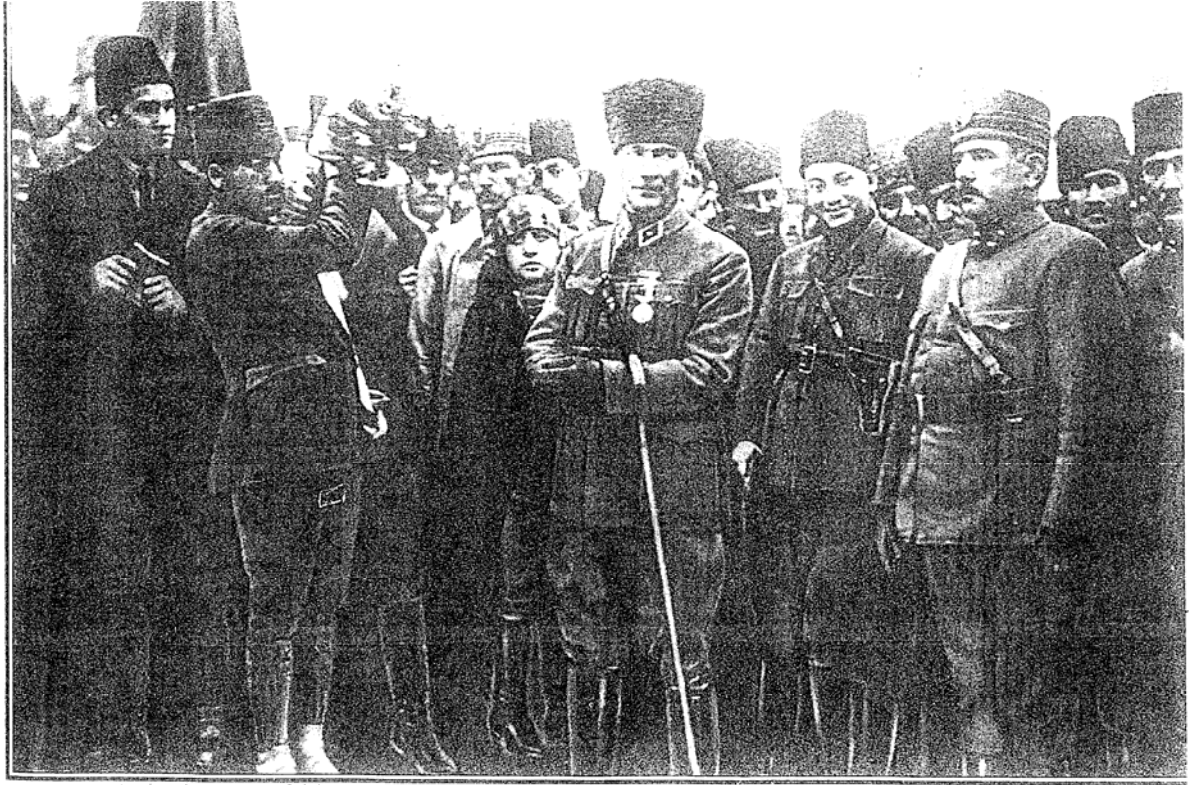
5 Şubat 1923 Mustafa Kemal Paşa'nın Akhisar'da Karşılması