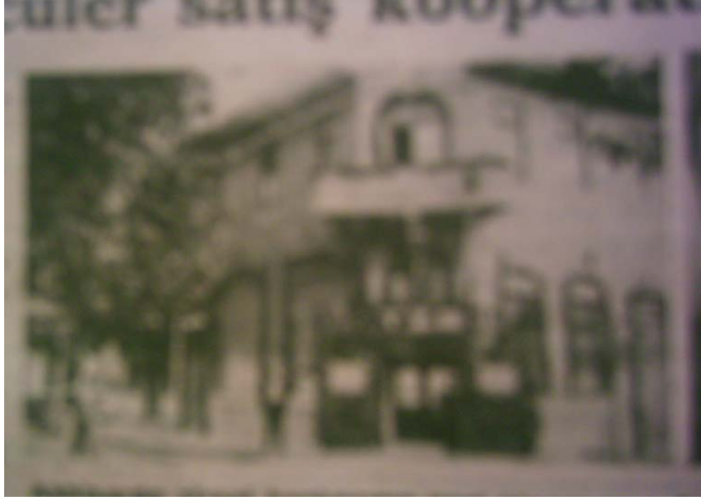
Akhisar Ziraat Bankası