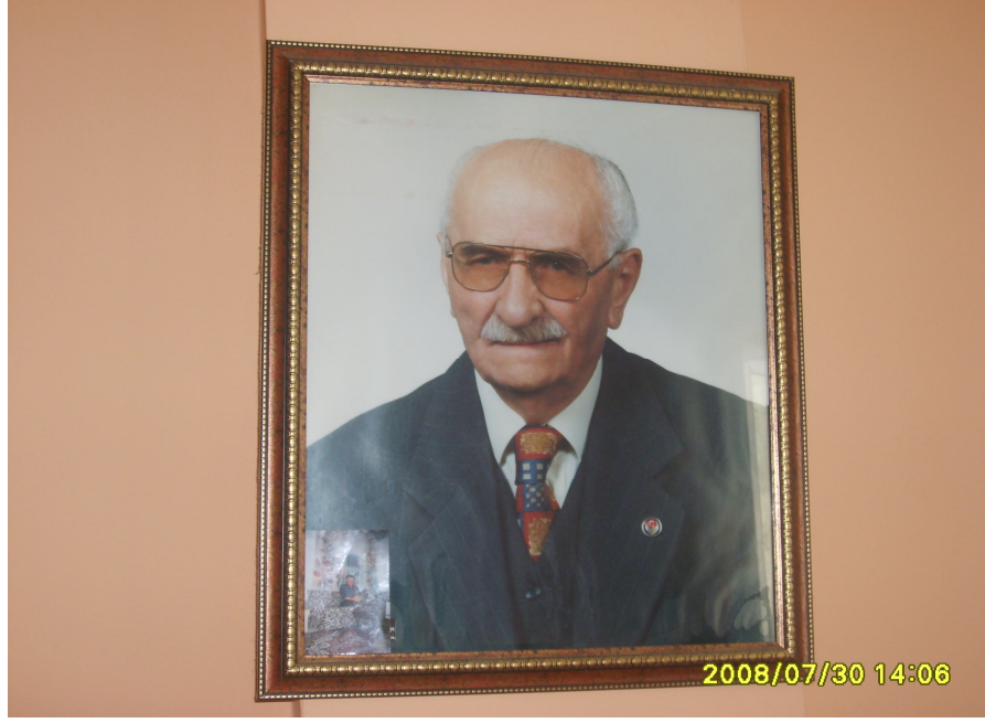
(Âşık Yener'in odasında asılı olan bir fotoğrafı)