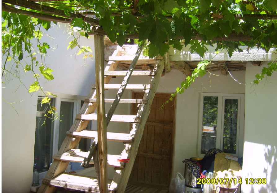
(Âşık Yener'in Tanır kasabasındaki evinden bir görünüş)