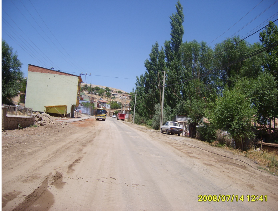
(Tanır Kasabası'ndan Genel Bir Görünüş)