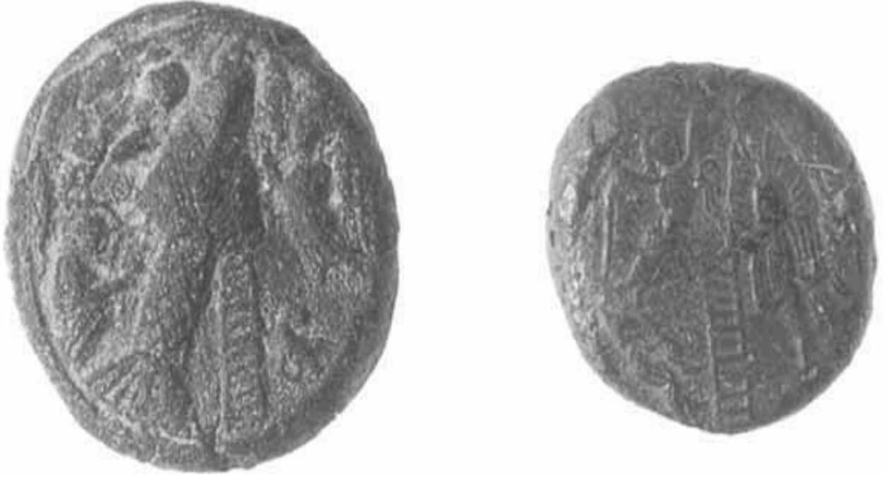
Ek 8 Büyük ya da Genç Simeon (Bir yılan, merdiven ve gagasında bir taç olan kuş kulübeye yaklaşıyor. Kuş, İsa'nın vaftizi esnasında Kutsal Ruhun güvercin şeklinde onun üzerine inmesini (Luka, 3, 21-22) temsil ediyor. Lauvre Müzesi) 486