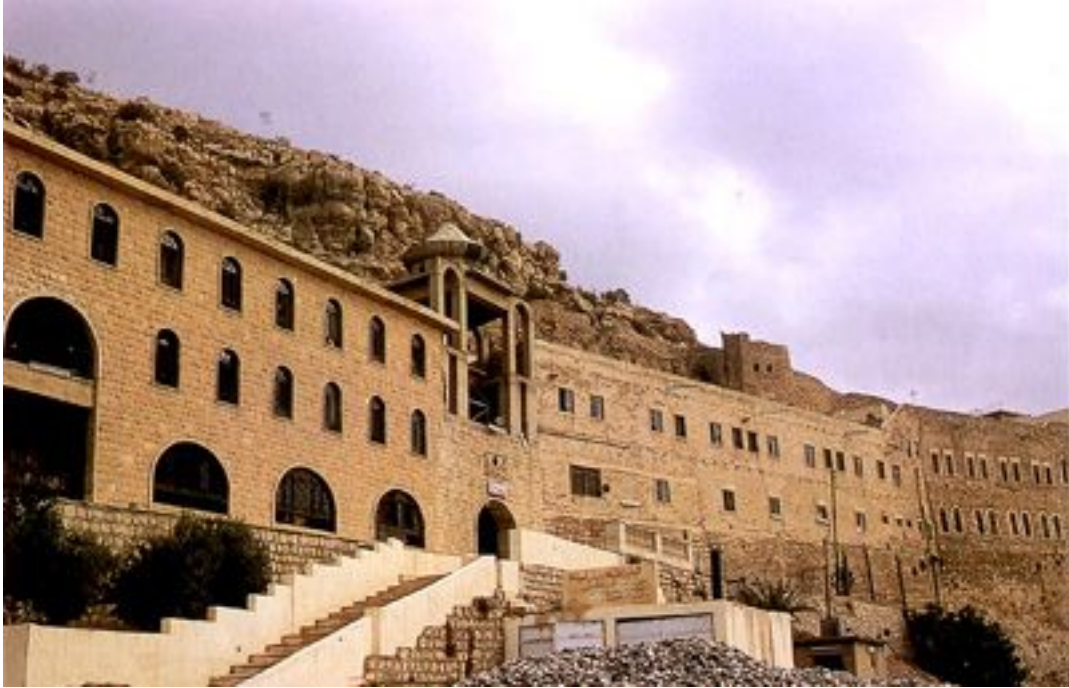
Ek 6 Büyük Simeon'un Bazilikası (Antakya) 484