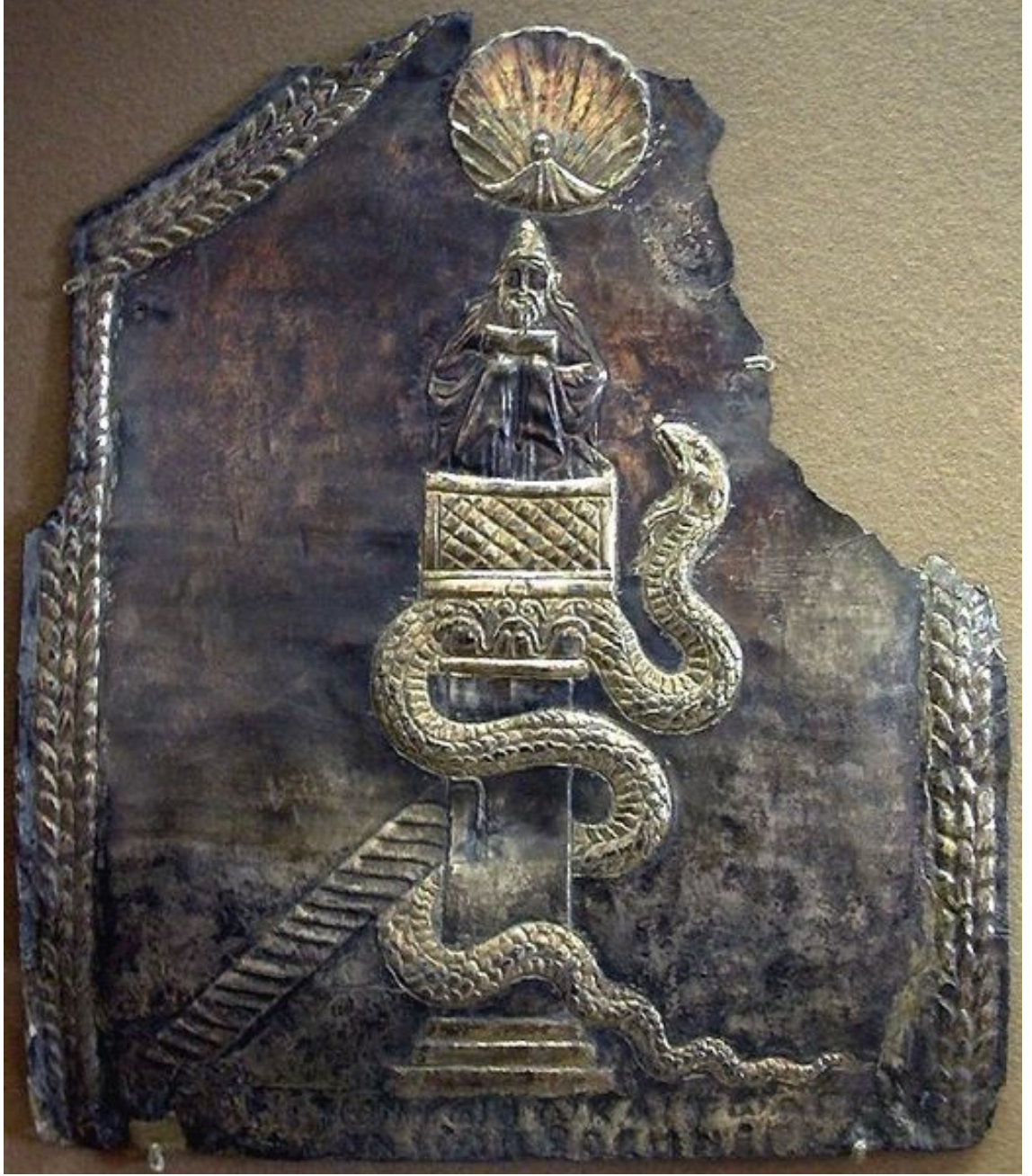
Ek 3 Bir 6. yüzyıl Suriye kutsal kalıntı mahfazasının altın kaplaması. (Simeon sütununun üzerinde, yılan kılığındaki şeytan ve bir merdiven-Louvre Müzesi) 481