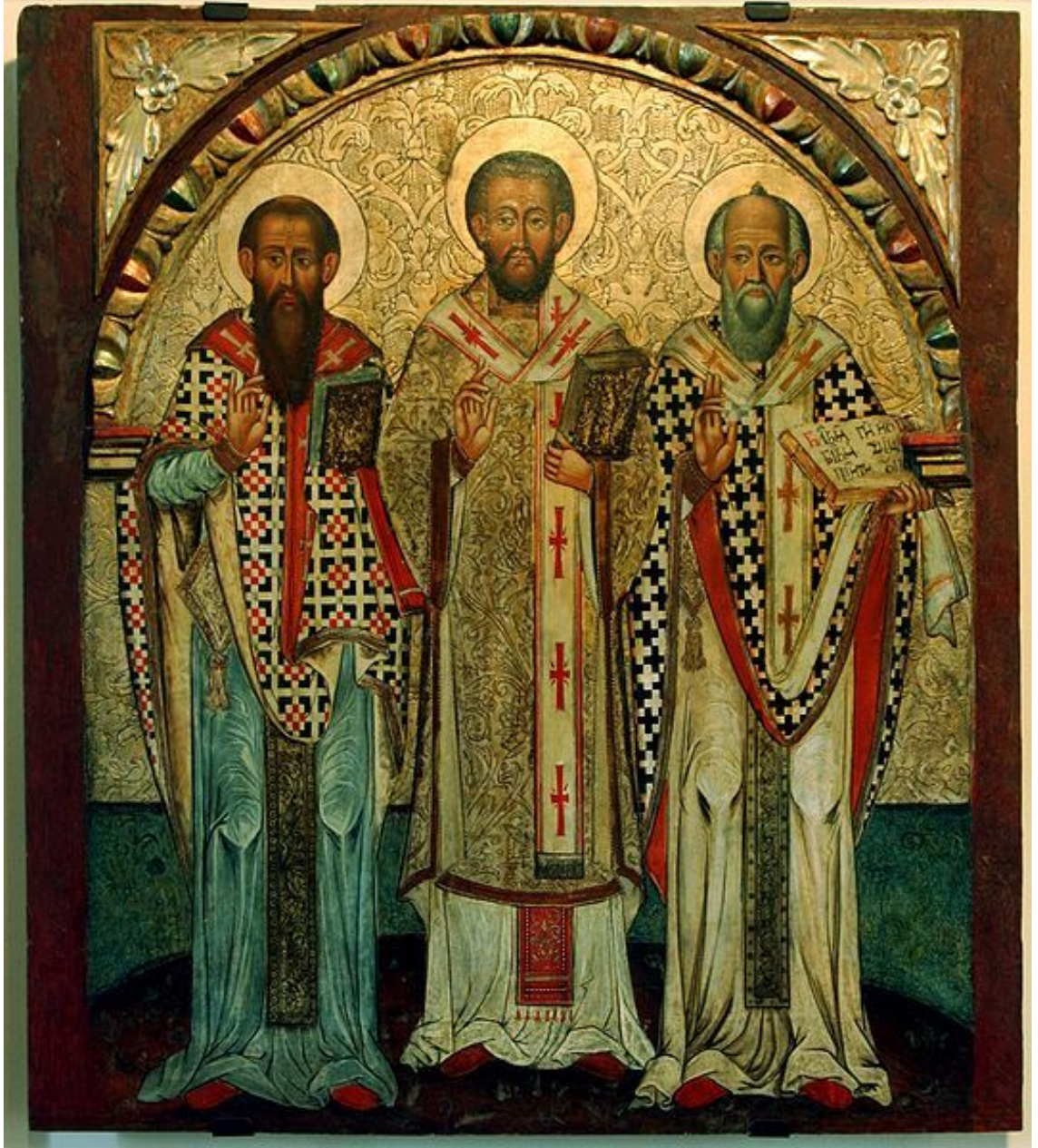
Ek 2 Basil, John Chrysostom ve Teolog Gregory (Polonya Sanok Tarih Müzesi) 480