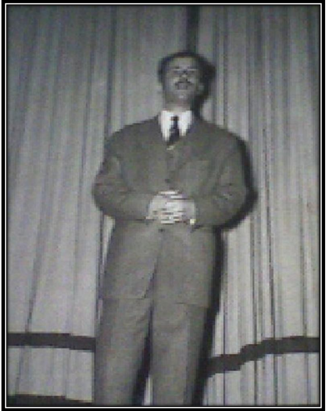
Düzenlenen Bir Edebiyat Gecesinde Açılış Konuşması Yaparken