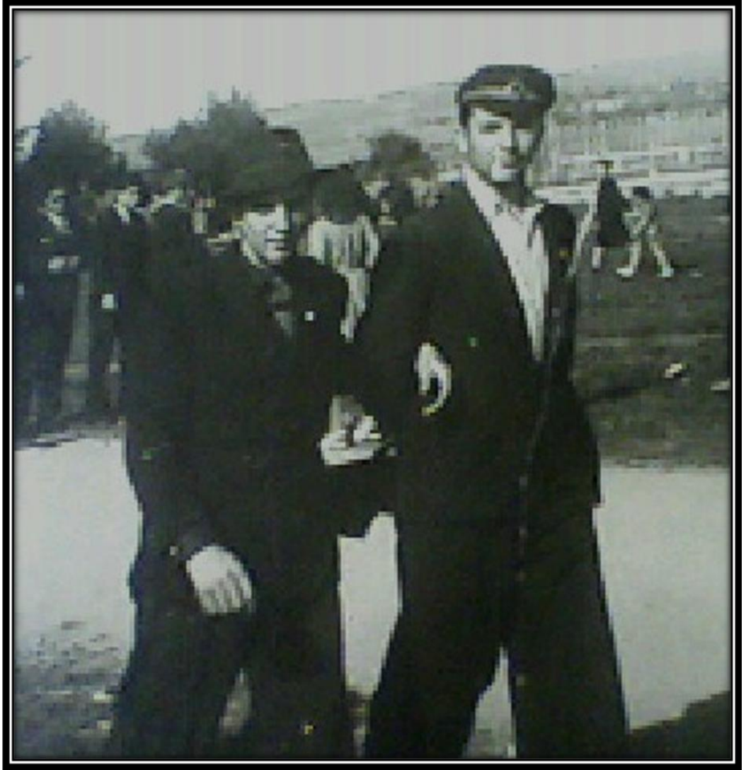
Manisa Lisesi'nde Son Sınıf Öğrencisiyken (Sağda)