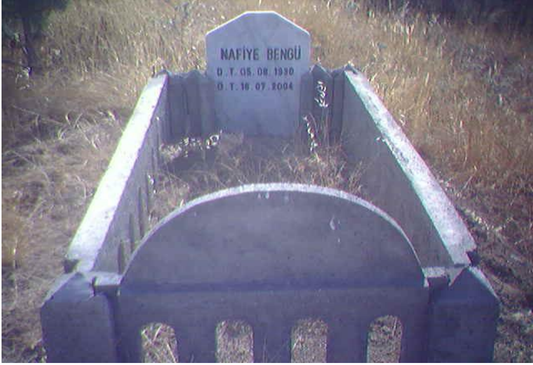
Yol konak (Hicre)köyü mezarlığı

Mezarlıklara baktığımız zaman birbirinden farklı olduklarını görüyoruz. Ancak Avrupa'da yaşayan Yezidiler Türkiye'ye geldikleri zamanlarda mezarlıkların yenilenmesi konusunda titiz davranarak mezarlıklarını yenilemektedirler. Mermerden yapılmış taşlar kullanılmaktadır.