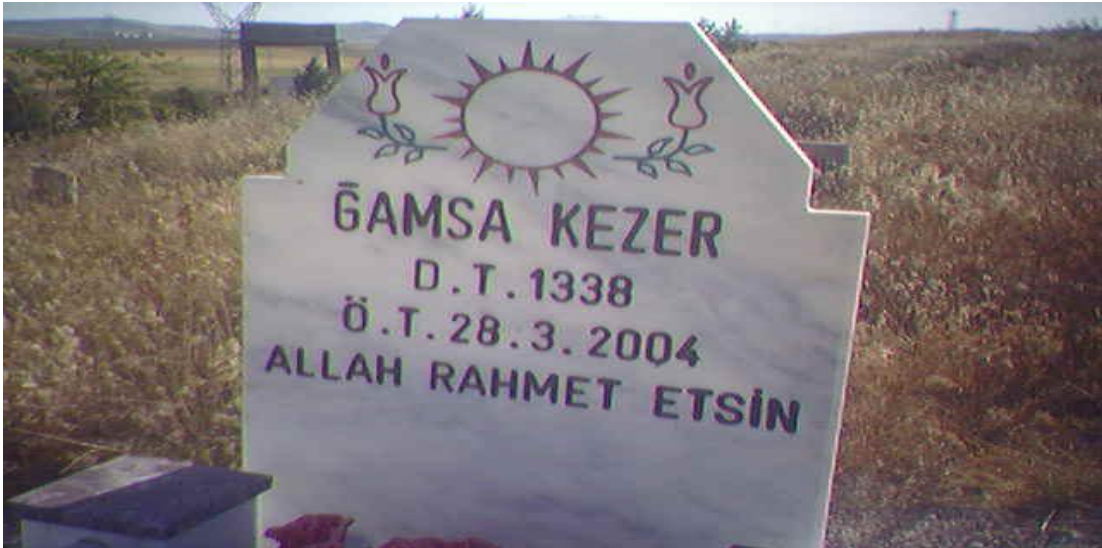
Yol konak (Hicre) köyü mezarlığı

Yas, mezarlıkta bulunan ve “Qubbe” 351 denilen yerde başlar. Ölen kişinin ardından 3., 7., ve 40. günlerde dini ayinler yapılır. Öte yandan “Bêhn lê tê” ya da “Bêhn Hilda”, dedikleri ölü kokusunun ruhuyla yaşadığını veya kaybolmadığını sembolize eden, yeni bir dini tören de yapmaktadırlar. Bu törende çeşitli yemekler ve “sewık” dedikleri yağlı ekmek yapılarak, fakirlere dağıtılır. 352