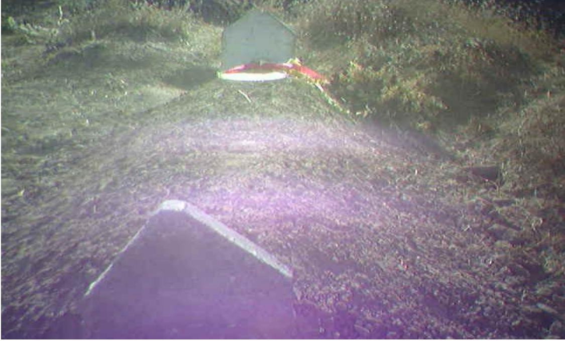
Yol konak (Hicre)küyü mezarlığı