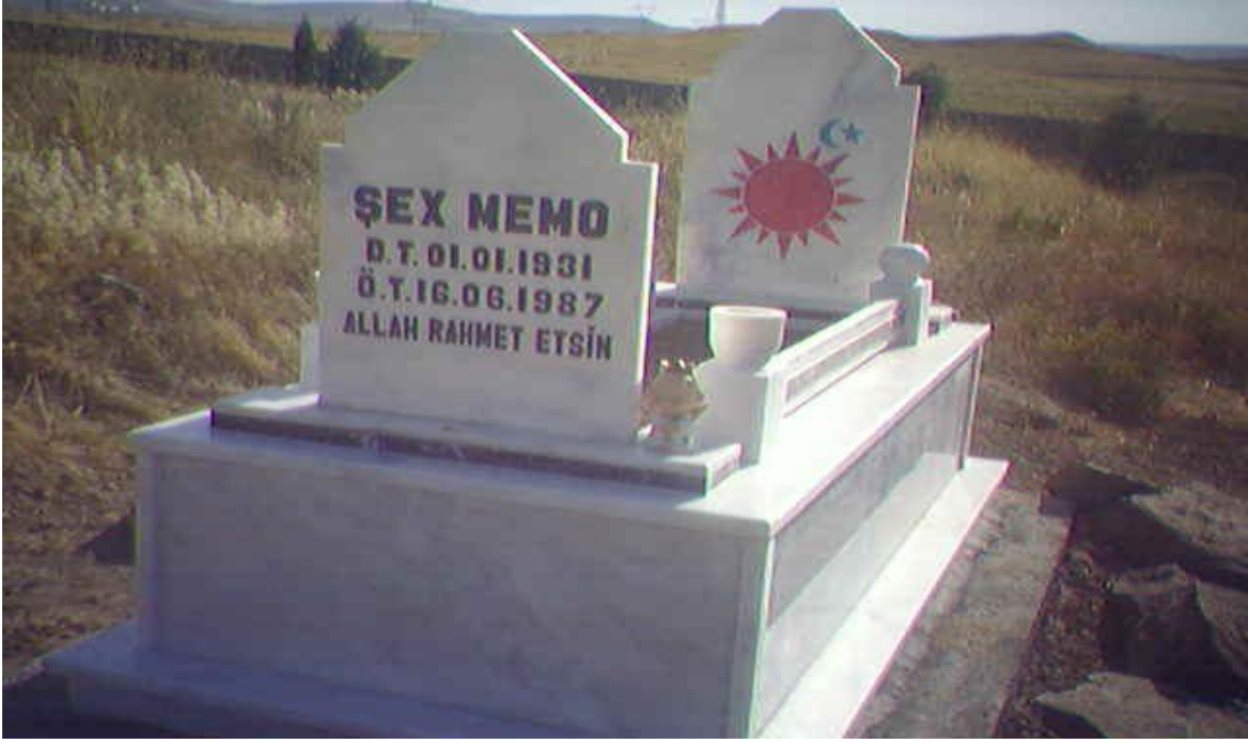
Yol konak (Hicre) köyü mezarlığı 353

Yezidilerde, büyük din adamlarının mezarlarında sol ayakucuna, ölen kişi için güneşe dönük bir şekilde konulan bu heykelcik, meleği temsil etmektedir. Bu melek ölen kişi için güneşe doğru dua etmektedir. Yolkonak köyündeki mezarlıkta bulunan bu mezarlık, Şeyh Memo'ya aittir, aynı zamanda da Şeyh Memo, bir din görevlisidir.