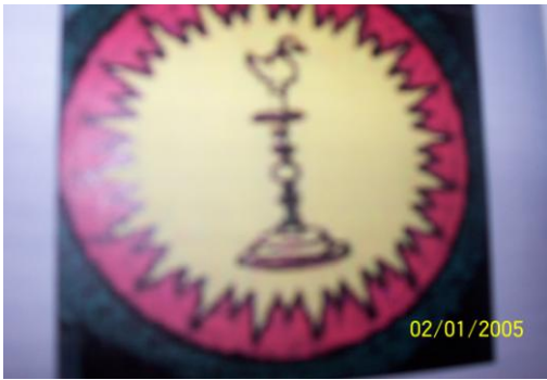
Resim: Horoza benzeyen Sancak