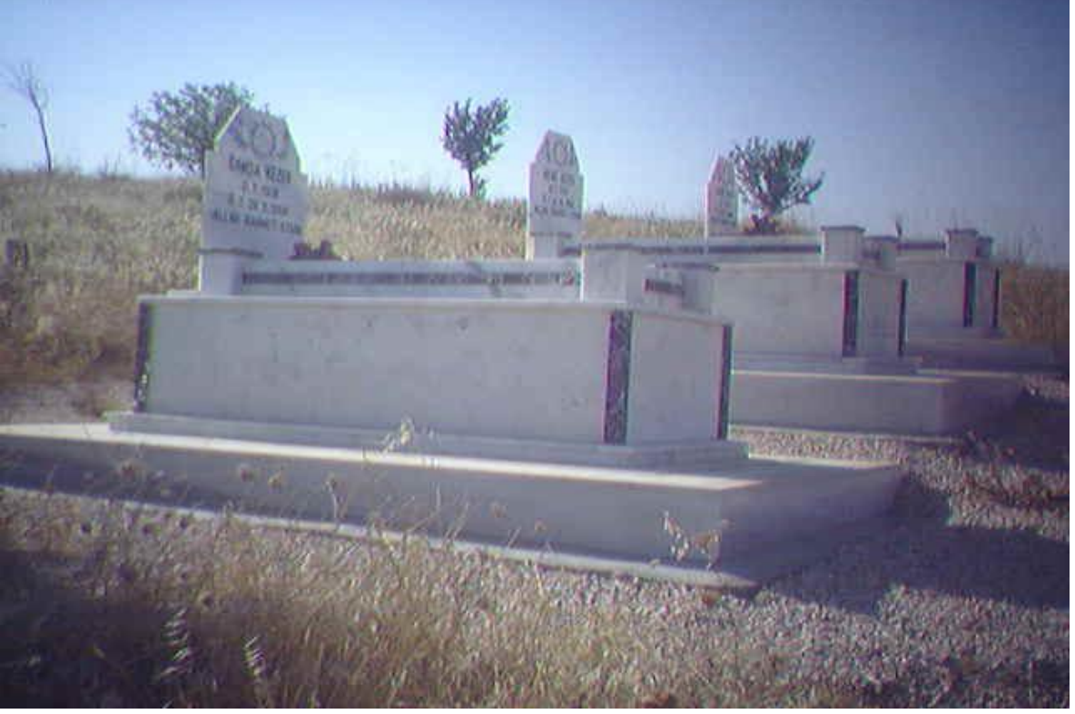
Yol konak (Hıcre) köyü mezarlığı

Mezarlıkların güzel olmasına özen gösterilir. Aile mezarlıkları vardır, yani ailenin fertleri yan yana gömülür. Ve görüldüğü gibi hepsinin gözü İslamiyet'tekinin aksine güneşin doğuşuna bakmaktadır. Her yerleşim yerinin kendine ait mezarlığı yoktur. Genelde, iki-üç köy mezarlığı birleştirilir.