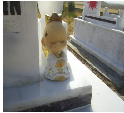
Mezarlığın sağ yanındaki heykelcik