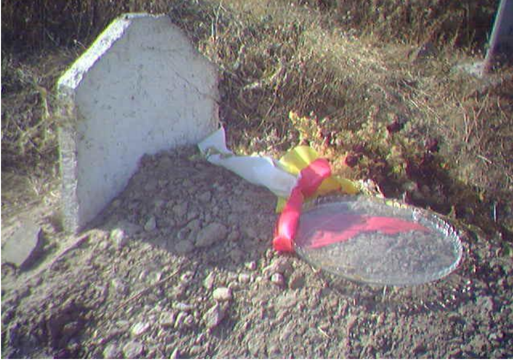
Yol konak (Hıcre) köyü mezarlığı

Yezidilikte bir diğer adet ise resimde görüldüğü gibi, yeni ölmüş olan bir yezidinin mezarı üzerine bir tabak içerisine su konulmaktadır, ölen kişi Pazar günü ölürse, cenaze evden çıkarılırken tabuta bir tane ekmek asılır ve mezarlığa da bu şekilde su bırakılır. Amaç geri dönünce mezarlıktan kötü ruhlara eve gelmesin diye böyle gelenek yerleşmiştir.