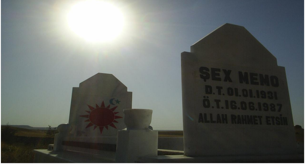
Yol konak (Hicre)köyü mezarlığında güneşin batışı