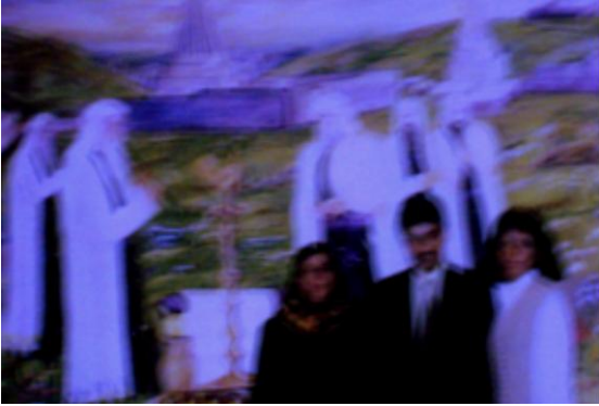
Resim: Kaval'ların ilahilere eşlik etmesi