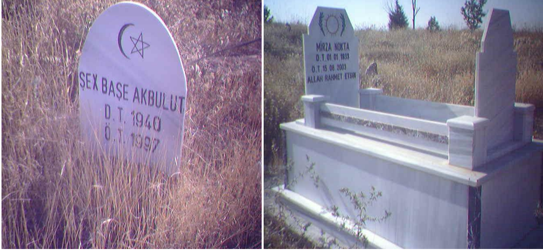
Yol konak (Hicre) köyü mezarlığı