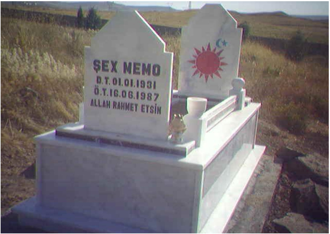
Yol konak (Hicre) köyü mezarlığı

Ölen kişi aynı gün gömülür, ancak uzak yerlerden gelen olursa bir günlük yol varsa bazen gelmeleri beklenir. Yezidilerde cenaze namazı kılınmaz. Yezidilerde ölen kişinin mezarını hazırlamak veya gömme işleminden sonra mezara toprak atmak, hayırlı bir iştir. 350 Ölen kişi mezara indirileceği zaman ahiret kardeşi gelir ve kefenin başucundaki bağlamı açar, daha sonra defin işlemi gerçekleştirilir ve İslam inancından farklı olarak ölen kişinin yüzü kibleye değil de, doğuya yani güneşe dönük olarak gömülür.