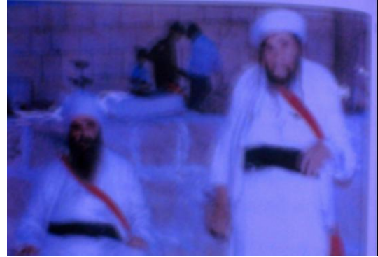
Resim: Laleş'te görevli din adamları

kavalların müziği ile sessizlik bozularak ilahiler okunur. Bu konuda araştırma yapan batılı araştırmacılardan Layard, bu törenlerden yaptığı gözlemler sonucunda şunları aktarmaktadır, “Bu Kürtlerin Şeyh Adî'nin mezarı başında söyledikleri şarkılar görkemli ve hüznü idi. Ben hiç bu kadar dokunaklı, hem de bu kadar hoş bir şarkı duymadım. Flüt sesleri, zaman zaman zil ve davul vuruşlarıyla kesilen, erkek ve kadın