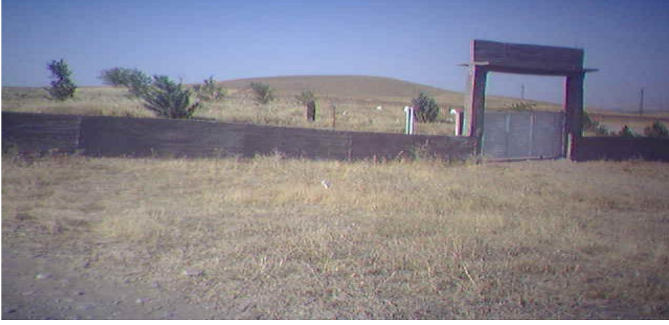
Yol konak (Hicre)köyü mezarlığı girişi