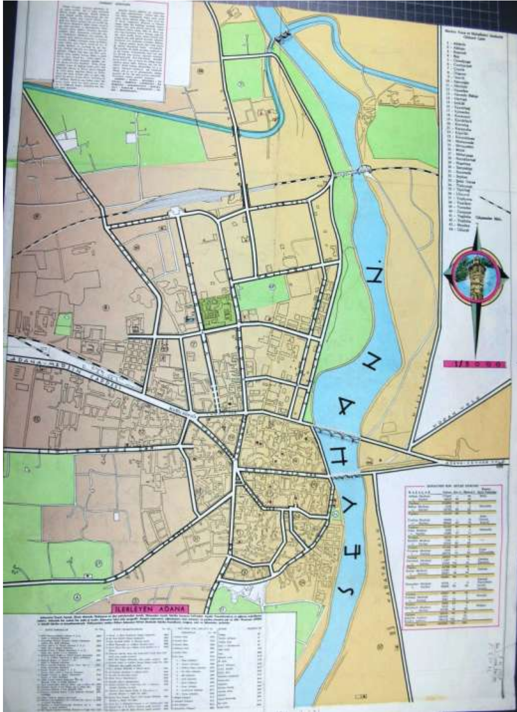
EK 8: 1958 Yılı Adana Şehir Merkezi