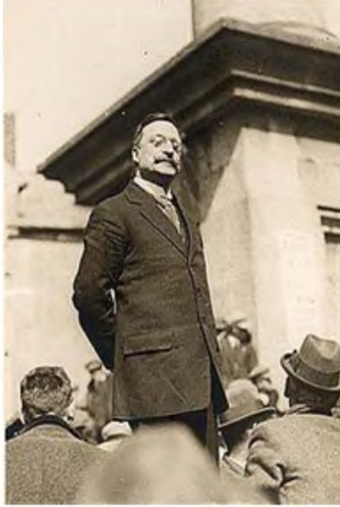
Resim 3: Arthur Griffith

31 Mart 1872 yılında Dublin’de doğdu. Ölüm tarihi olan 12 Ağustos 1922’e kadar İrlanda’nın bağımsızlığı için savaştı. Bu amaçla 1905’de Sinn Fein partisini kurdu. 21 Ocak 1919- 10 Ocak 1922 tarihleri arasında Cumhurbaşkanlığı Yardımcılığı yaptı. Gençlik yıllarında Dublin’de dizgici olarak çalıştıktan sonra Güney Afrika’ya gitti. Güney Afrika’da bulunduğu 1896-98 arasında madencilik ve gazetecilik yaptı. Ülkesine döndükten sonra, The United Irishman , Sinn Féin , Eire ve Nationality adlı siyasal gazeteleri yayımlamaya başladı. 112