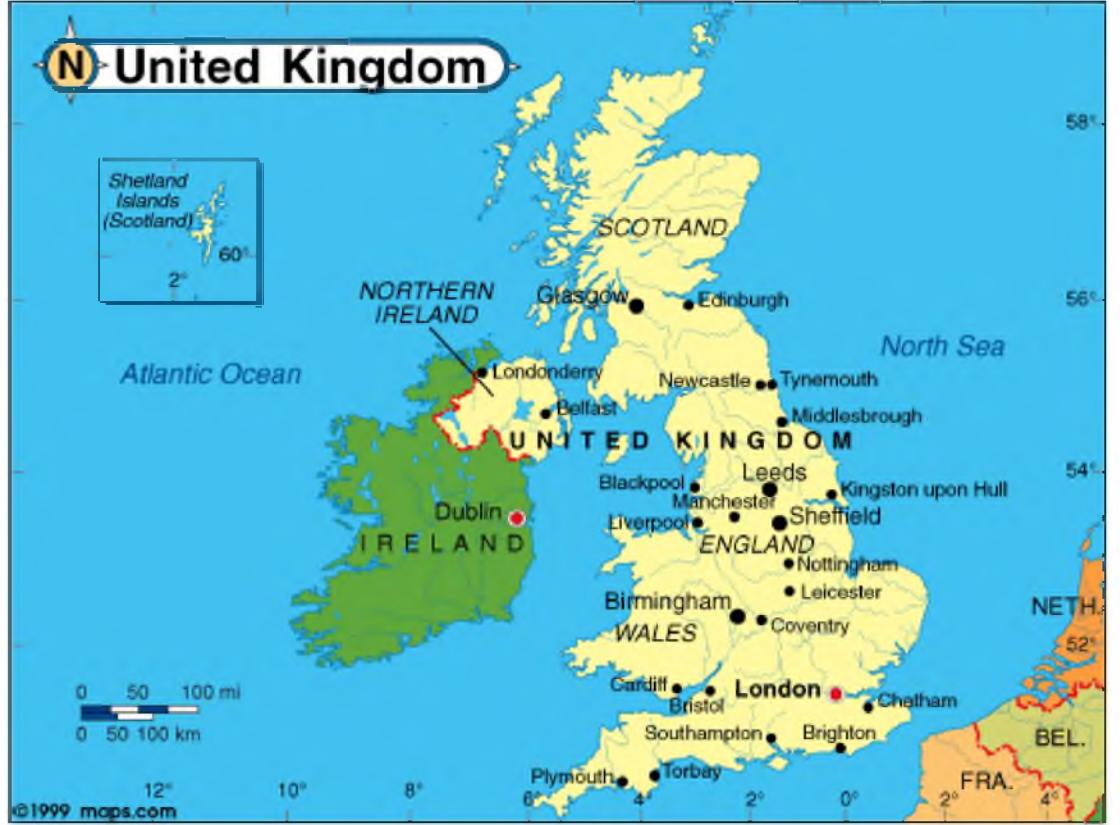
Resim 5: İngiltere-İrlanda Anlaşması'ndan Sonraki Birleşik Krallık Haritası.