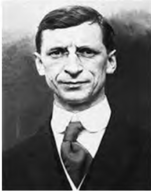
Resim 1: Eamon de Valera

Paskalya Ayaklanmasına katılan geleceğin İrlanda'sının en önemli liderinden birisi de Eamon De Valera idi. 14 Ekim 1882 de ABD'nin New York eyaletinde doğdu. Babası İspanyol asıllı annesi ise İrlanda asıllıdır. Babası ölünce İrlanda'ya (Limerick) annesinin yanına geldi, İrlanda Ulusal Üniversitesi'nde matematik okudu. Daha sonra Galceyi öğrendi ve gönüllülere katıldı. Eamon de Valera ile çağdaşı Atatürk arasında yüzeysel benzerlikler vardır. İkisinin de gençliklerinde matematiğe ilgisi askeri kahramanlıklarla oluşmuş milli bir ün, uluslararası barışı savunan açık sözlülük olmakla beraber Türk lideri gayretli bir şekilde tüm enerjisini ülkesine ve insanlarına kültürel geçmişten uzaklaştırmaya adanmışken Eamon de Valera İrlandalılara bunun tersini yaptı. 107