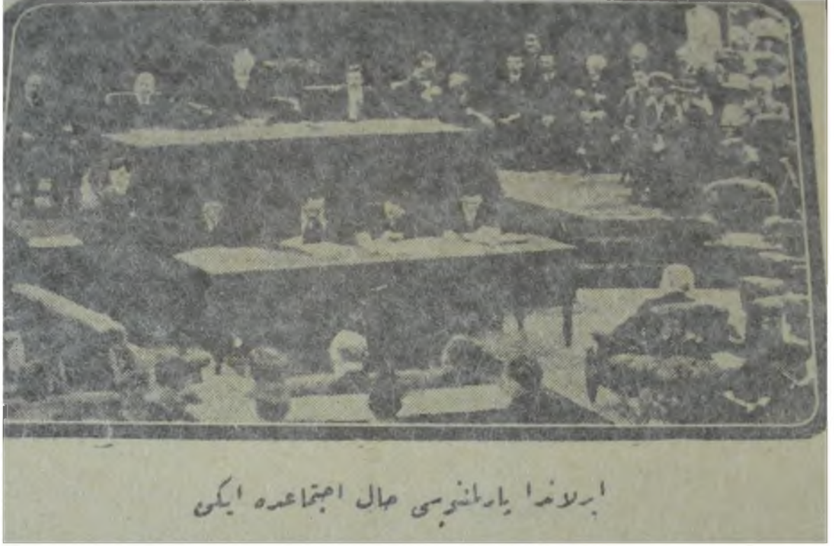
Resim 6: İrlanda Parlamentosu'nda Görüşmeler Devam Ederken

şeklinde konuştu. 283 Kamu kurumlarının görüşü de anlaşmanın imzalanması yönündeydi. 4 eyaletten gelen 12 kamu kuruluşu, milletin isteğinin anlaşmanın onaylanması olduğunu yüksek sesle belirtti. 284