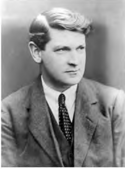
Resim 2: Michael Collins

Kaynak: https://www.google.com.tr/search?q=michael+collins&es