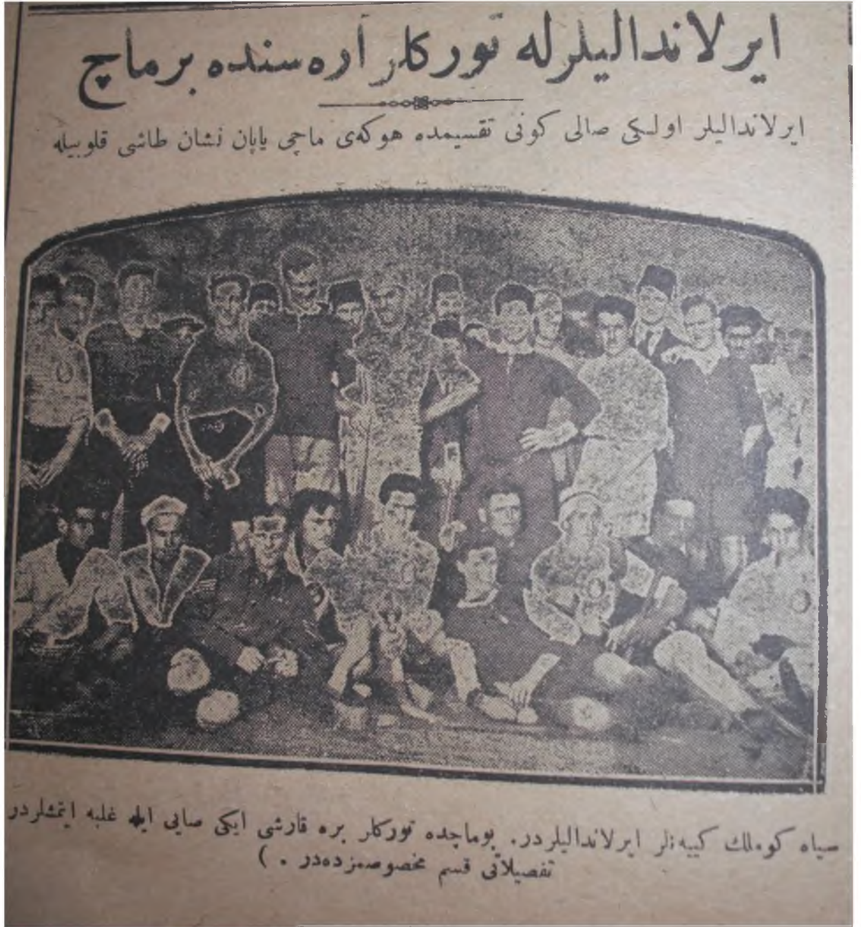
Resim 4: İrlandalılar ile Türkler Arasında Yapılan Maçtan Bir Fotoğraf