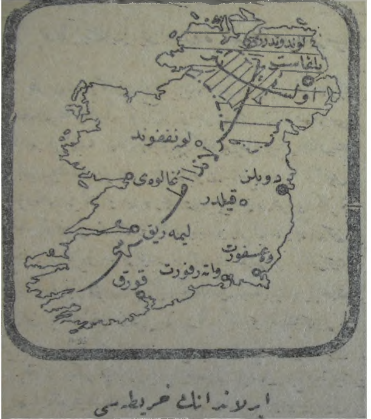
Resim 8: Anlaşmadan Sonra İrlanda Haritası

meseleye yeni bir öneri getirildi. 288 Şartların İki ülkenin delegeleri tarafından onaylanmasından sonra bu süreç sonlandı.