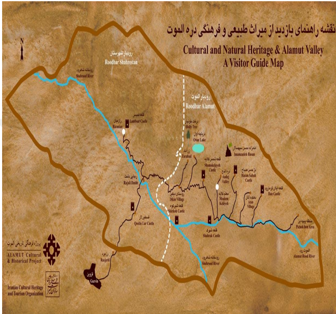
Ek 1: Alamut Vadisi - www.hamrahetarikh.ir .