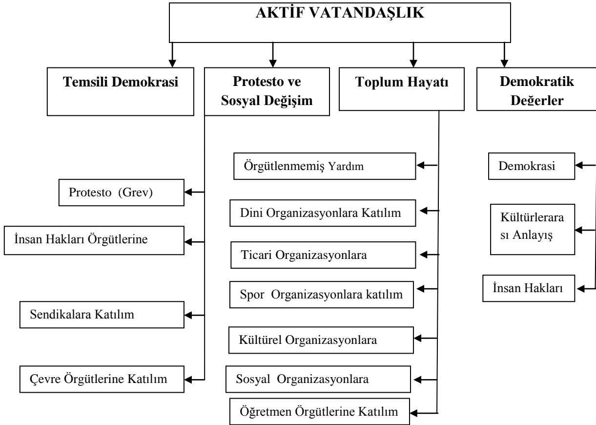
Şekil 1: Aktif Vatandaşlığın Bileşik Göstergesi (ACCI) (Hoskins&Mascherini, 2009; Akt. Kıncal, 2012).

Günümüz anlamında coğrafya, yeryüzünün şekillenmesini, şekillenmede etkili olan amilleri ve yeryüzünde canlı hayatı oluşturan insan, insan, bitki, hayvan, toplulukları ile doğal ortam arasındaki ilişkileri ve bunların dağılımlarını inceleyen bilim haline gelmiştir. Diğer bir deyişle coğrafya, doğal ortam, doğal ortam ile insan arasındaki ilişkilerin incelenmesi coğrafyanın ana konusunu oluşturur. Ayrıca beşeri ve ekonomik olaylarla, insan faaliyetleri ile çevrenin incelenmesidir (Atalay, 1998).