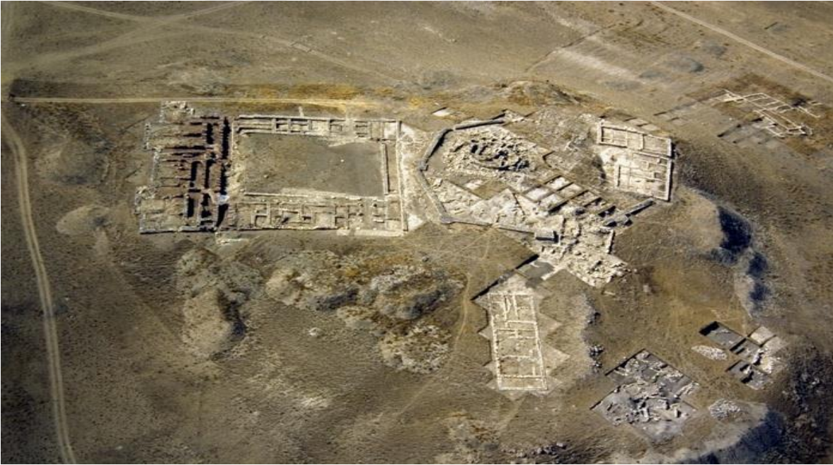
Resim 2-3-4: Sarissa (Kuşaklı)

Sivas'ın 50 km. güney batısında Hitit kenti kalıntıları bulunmaktadır. Günümüzde kalıntılara ulaşılan, şehrin etrafını çevreleyen surlar nedeniyle Kuşaklı ismini almaktadır. M.Ö. 2000'li yıllarda hayli yüksek ve dağlarla çevrili bu bölge yukarı ülke olarak adlandırılmaktadır. 1992 yılında günümüz Altınyayla ilçesine bağlı Başören Köyü'nün 4 km. doğusundaki Sarissa'da (Kuşaklı) kazı çalışmalarına başlanmıştır. Bu alandan birçok arkeolojik eser bulunmuştur. Yapılan değerlendirmelere göre