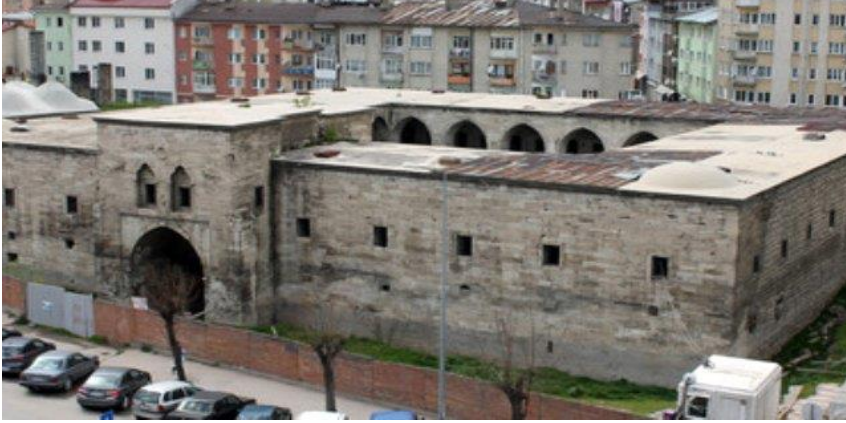
Resim 21: Behram Paşa Hanı

Behram Paşa Hanı Sivas Valisi Sağır Behram Paşa tarafından 1576 yılında yaptırılmıştır. Han, kesme taşlardan açık avlulu ve iki katlı olarak yapılmıştır. 2018 yılı itibari ile restorasyonu bitirilerek, turizme kazandırılması hedeflenmektedir.