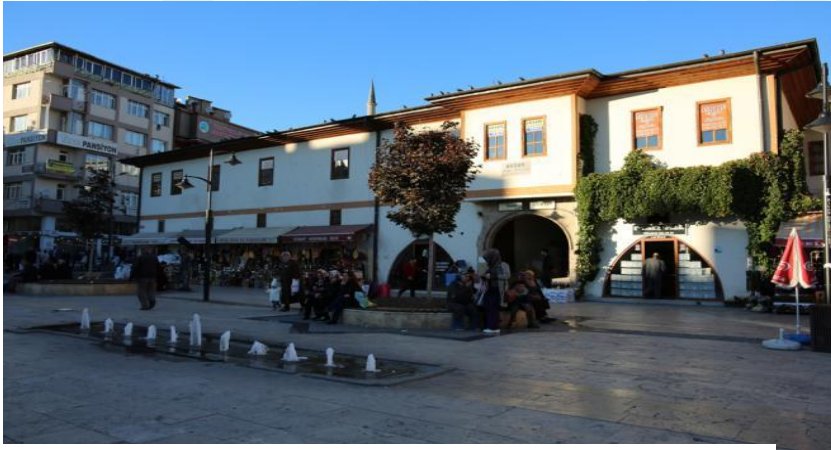
Resim 22: Subaşı Hanı

Subaşı Hanı Sivas Valisi Lala Sinan Paşa tarafından 16. Yüzyılda yaptırılmıştır. Çarşı içerisinde Dört yol mevkiinde bulunmaktadır. Subaşı hanı aslına uygun olarak 1986 yılında yeniden yapılmıştır.