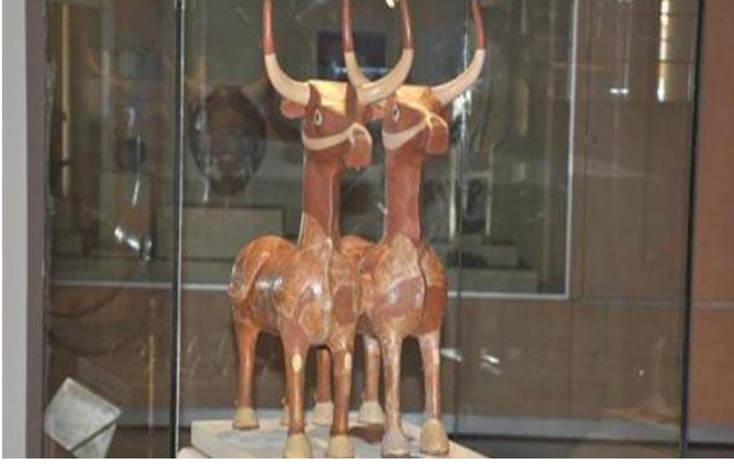
Resim 5: Hitit Baş Tanrı heykeli-İkiz Boğalar

Kuşaklı'nın orta büyüklükte bir Hitit şehri olduğu, M.Ö. 16. Yüzyılda kurulduğu, M.Ö. 1200'lerde yangın felaketine uğrayarak Hitit İmparatorluğunun çöktüğü sıralarda şehrin yıkıldığı düşünülmektedir. Hititlerin Baş Tanrı olarak adlandırdığı Teşup'un kutsal ikiz boğa heykeli bu bölgede bulunmuştur.