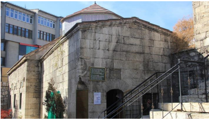
Resim 20: Şemseddin Sivasi Türbesi

Türbe Meydan Camii avlusunda bulunmaktadır. Türk-İslam tarihinde bulunan üç şemsten biridir. Kara Şems olarak anılmaktadır. Türbe 1600 yılında kesme taştan yaptırılmıştır. Türbede kendi soyundan gelen bazı kişilerinde mezarları bulunmaktadır.