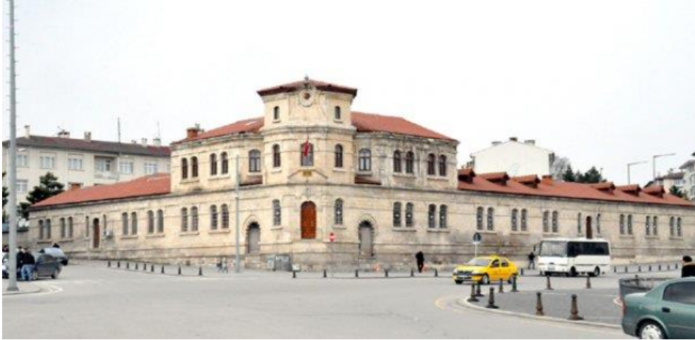
Resim 27: Jandarma Alay Komutanlığı Binası

Jandarma Alay Komutanlığı Binası, 19. Yüzyılda Hükümet Konağı'nın yanı başına yapılmıştır. Tek katlı binanın batı köşesi kule şeklinde üç katlı olarak yükselmektedir. Günümüzde Jandarma binası olarak işlevini sürdürmektedir.