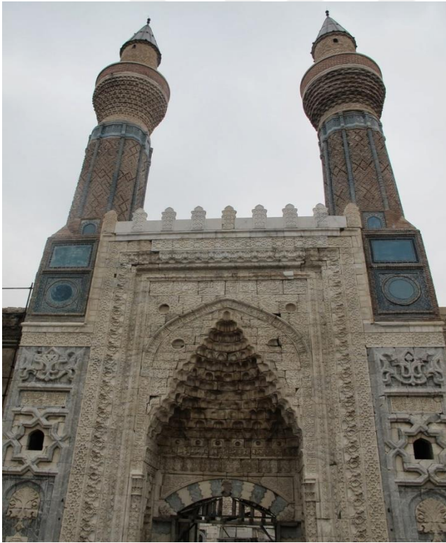
Resim 11: Gök Medrese

Buruciye Medresesi Selçuklu Sultanı Gıyaseddin Keyhüsrev zamanında Miladi 1271 yılında yaptırılmıştır. Buruciye Anadolu'nun en simetrik planlı medresesi olma özelliğine sahiptir. Medrese içerisinde medreseyi yaptıran Muzaffer Burucerci'nin türbesi bulunmaktadır. Türbe mavi çinilerle süslüdür.