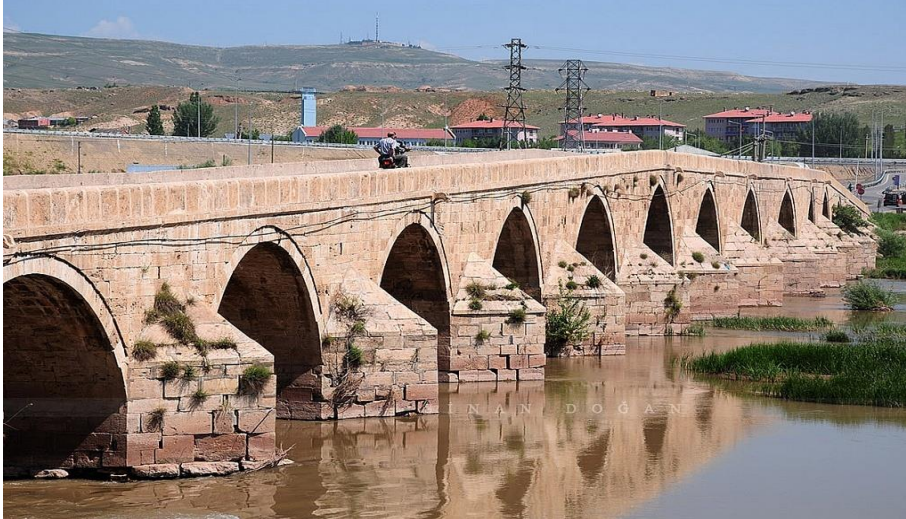
Resim 25: Kesik Kopru

1875 ve 1906 yıllarında tamir edilmiřtir.