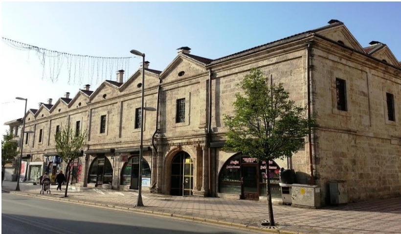
Resim 23: Taşhan

Taşhan 19. Yüzyılın ortalarında azınlık tüccarlar tarafından yaptırılmıştır. Dört yol mevkiinde bulunan han kesme taşlardan dörtgen planlı olarak yapılmıştır. Ortasında üzeri açık bir havuz bulunmaktadır.