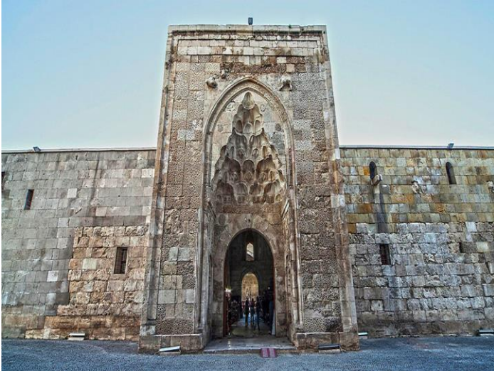
Resim 8: Şifaiye Medresesi

Şifaiye Medresesi, Selçuklu Sultanı I. İzzettin Keykavus tarafından Miladi 1217-1218 yılında yaptırılmıştır. Şifaiye yapıldığı dönemde Anadolu'nun en modern hastanesi ve medresesi olarak hizmet vermiştir. Hastanede göz, cilt, dâhiliye ve ruh hastalıkları bölümleri bulunmaktadır. 13 ve 14. Yüzyıllarda teşhis ve tedavi yönünden tüm Anadolu ve Avrupa hastanelerinden daha ileri konumda olduğu bilinmektedir. Şifaiye'nin iç kısmında medreseyi yaptıran Sultan İzzettin Keykavus'un kabri bulunmaktadır.