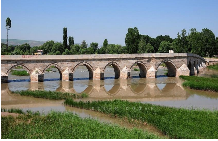
Resim 24: Eđri Kopru

Eđri Kopru Sivas'ın 3 km. gneyinde Kızılırmak zerinde bulunmaktadır. Eski Sivas-Malatya yolu bu kopru zerinden gemektedir. Eđri Kopru, Seluklular dneminde 12. yzyılda yapılmıřtır. Eđri Kopru 1585'de III. Murat dneminde ve 19. Yzyılda onarımdan gemiřtir.