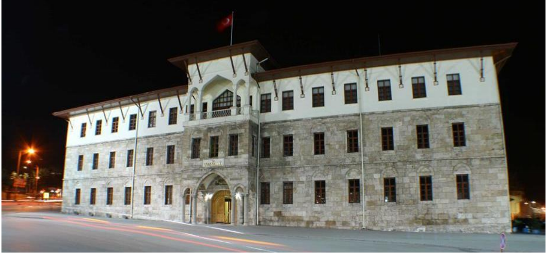
Resim 26: Hükümet Konağı

Hükümet Konağı, 1883 yılında Vali Halil Rıfat Paşa tarafından yaptırılmıştır. İlk yapıla bina iki katlı iken, Vali Muammer Bey 1915 yılında üçüncü bir kat ilave ettirmiştir. 1978 yılında yanan bina, aslına uygun olarak onarılmıştır. Günümüzde yapılaş amacına uygun olarak Hükümet Konağı işlevini sürdürmektedir.