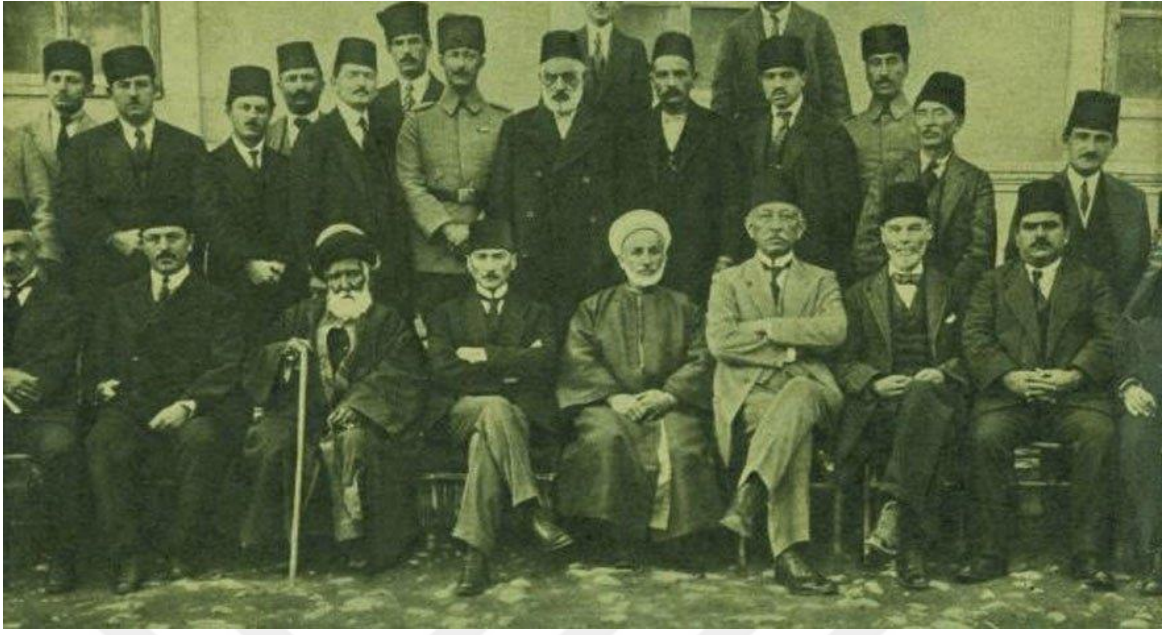
Resim 1: Sivas Kongresi'ne katılan delegeler.