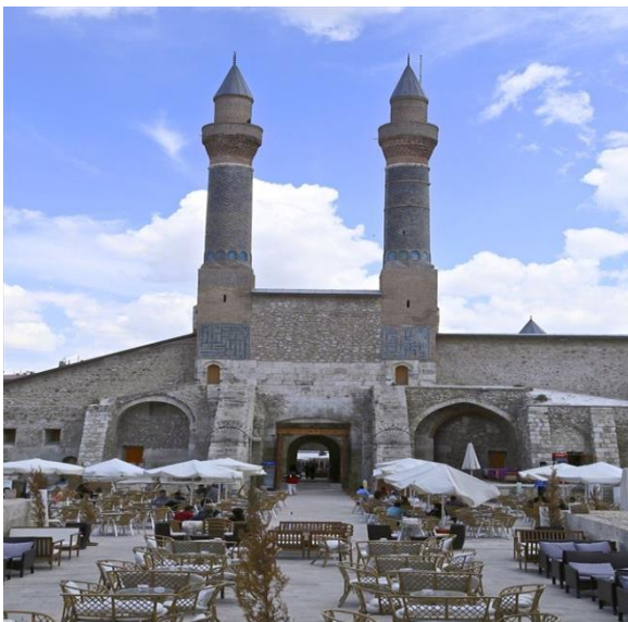
Resim 9: Çifte Minareli Medrese

Şifaiye Medresesi, Selçuklu Sultanı I. İzzettin Keykavus tarafından Miladi 1217-1218 yılında yaptırılmıştır. Şifaiye yapıldığı dönemde Anadolu'nun en modern hastanesi ve medresesi olarak hizmet vermiştir. Hastanede göz, cilt, dâhiliye ve ruh hastalıkları bölümleri bulunmaktadır. 13 ve 14. Yüzyıllarda teşhis ve tedavi yönünden tüm Anadolu ve Avrupa hastanelerinden daha ileri konumda olduğu bilinmektedir. Şifaiye'nin iç kısmında medreseyi yaptıran Sultan İzzettin Keykavus'un kabri bulunmaktadır.