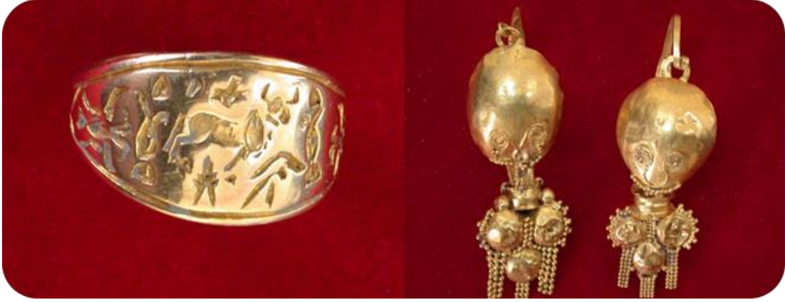
Resim 7. Kayalıpınar'da bulunan altın yüzük ve küpeler.