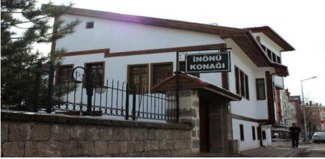
Resim 32: İnönü Konağı

Türkiye Cumhuriyeti'nin 2. Cumhurbaşkanı ve Mustafa Kemal Atatürk'ün silah arkadaşı İsmet İnönü'nün çocukluğunun geçtiği, ilköğrenimini tamamladığı, Ali Baba mahallesindeki bu ev restore edilerek müzeye dönüştürülmüştür.