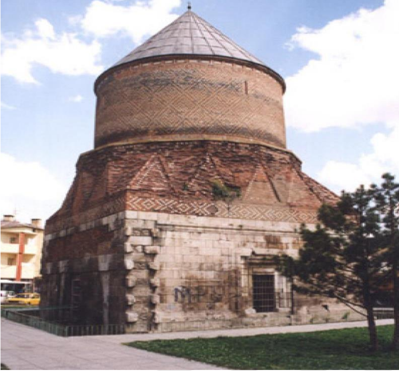
Resim 19: Şeyh Hasan bey Türbesi

Güdük Minare olarak da bilinen Şeyh Hasan Bey Türbesi, Güdük Minare mahallesinde bulunmaktadır. Türbede mezarı olan Uygur Türkü, Alaaddin Eretna'nın oğlu Hasan Bey'dir. Hasan Bey düğününden birkaç gün önce vefat edince türbeyi babası Alaaddin Eretna Bey, 1347 yılında dönemin en iyi ustalarına yaptırmıştır.