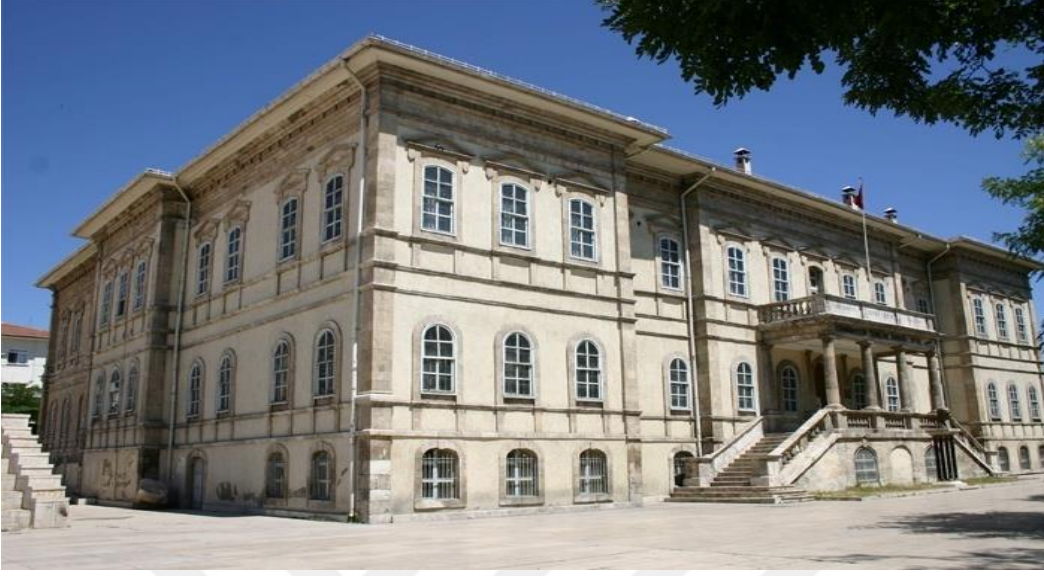
Resim 28: Kongre Müzesi Binası

Sivas Valisi Sırrı Paşa tarafından yapımına başlanan bina, Vali Memduh Bey zamanında 1894 yılında tamamlanmıştır. Bina Osmanlı döneminde Önce idadi, sonra sultani, Cumhuriyet döneminde ise lise olarak hizmet vermiştir. Bina 1985 yılında müzeye çevrilmiştir. Mustafa Kemal Atatürk'ün Sivas Kongresi'ni topladığı binadır. Günümüzde Kongre Müzesi olarak işlev görmektedir.