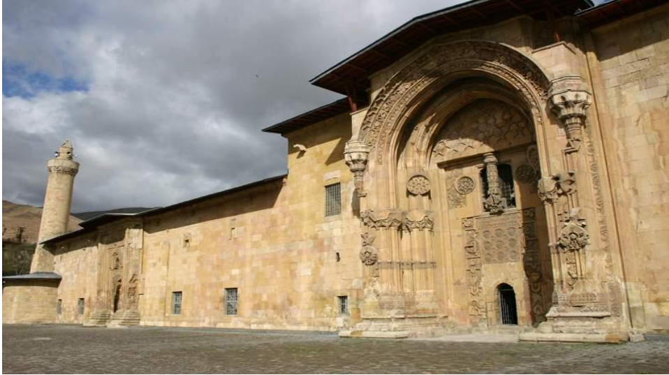
Resim 33: Divriği Ulu Camii