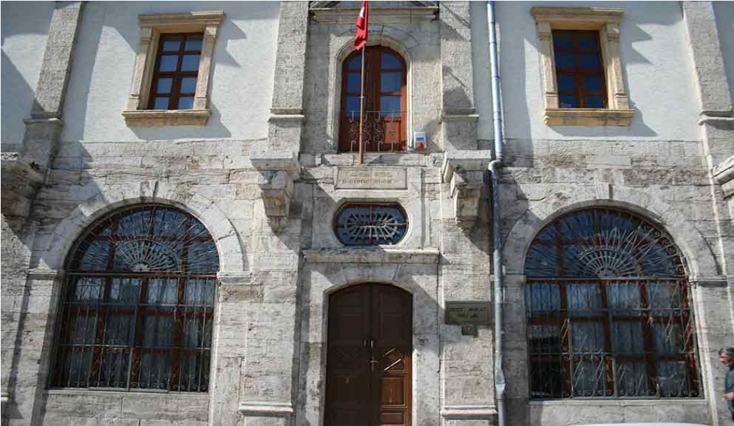
Resim 29: Ziya Bey Kütüphanesi