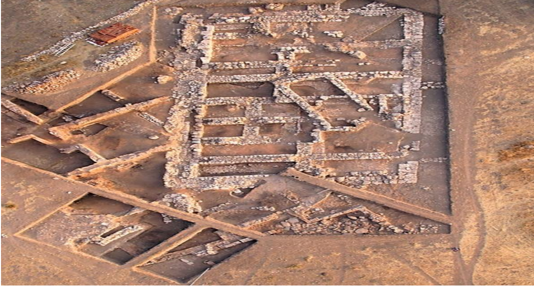
Resim 6: Kayalıpınar Harabeleri

Hititlerin "Maraşantiya" olarak adlandırdıkları, Kızılırmak kıyısında yer alan Kayalıpınar Harabesi'nde 2005 yılında kazı çalışmaları başlanmıştır. Kuşaklı'dan (Sarissa) daha eskiye dayanan tarihi olan kent birçok uygarlığa ev sahipliği yapmıştır. Yapılan kazılarda ele geçen en eski buluntu M.Ö. 4000 yılına ait olan damga mühürdür. Kayalıpınar döneminin en önemli ticaret merkezlerinden biri olarak göze çarpmaktadır.