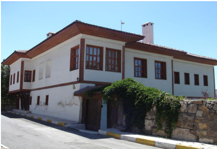
Resim 31: Abdi Ağa Konağı

Başara ailesinden Abdi Ağa'ya ait olan konak, Kaleardı mahallesinde bulunur. 1827 yılında yaptırılmıştır. Konak varislerin rızası ile Sivas Belediyesi'ne devredilmiştir. 2000 yılında aslına uygun şekilde restore ettirilmiştir.