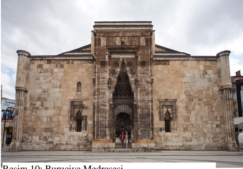
Resim 10: Buruciye Medresesi

Buruciye Medresesi Selçuklu Sultanı Gıyaseddin Keyhüsrev zamanında Miladi 1271 yılında yaptırılmıştır. Buruciye Anadolu'nun en simetrik planlı medresesi olma özelliğine sahiptir. Medrese içerisinde medreseyi yaptıran Muzaffer Burucerci'nin türbesi bulunmaktadır. Türbe mavi çinilerle süslüdür.