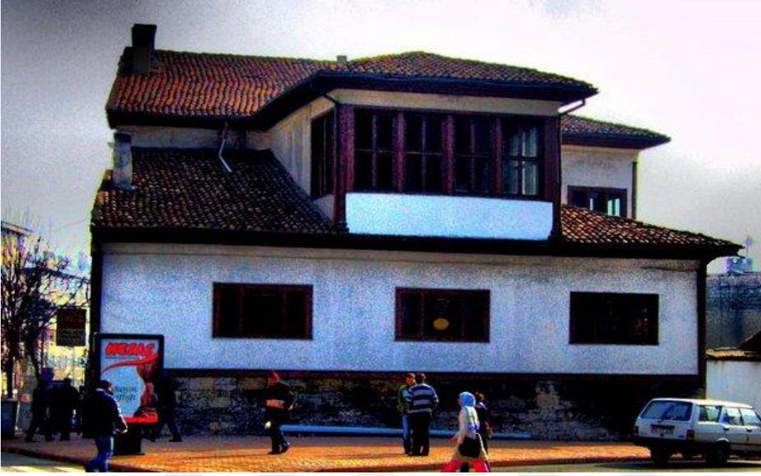
Resim 30: Kangal Ağası Konağı

Konak, Dikilitaş mevkiindedir. Kangal Ağası lakaplı Abdurrahman Paşa tarafından 1877 yılında yaptırılmıştır.