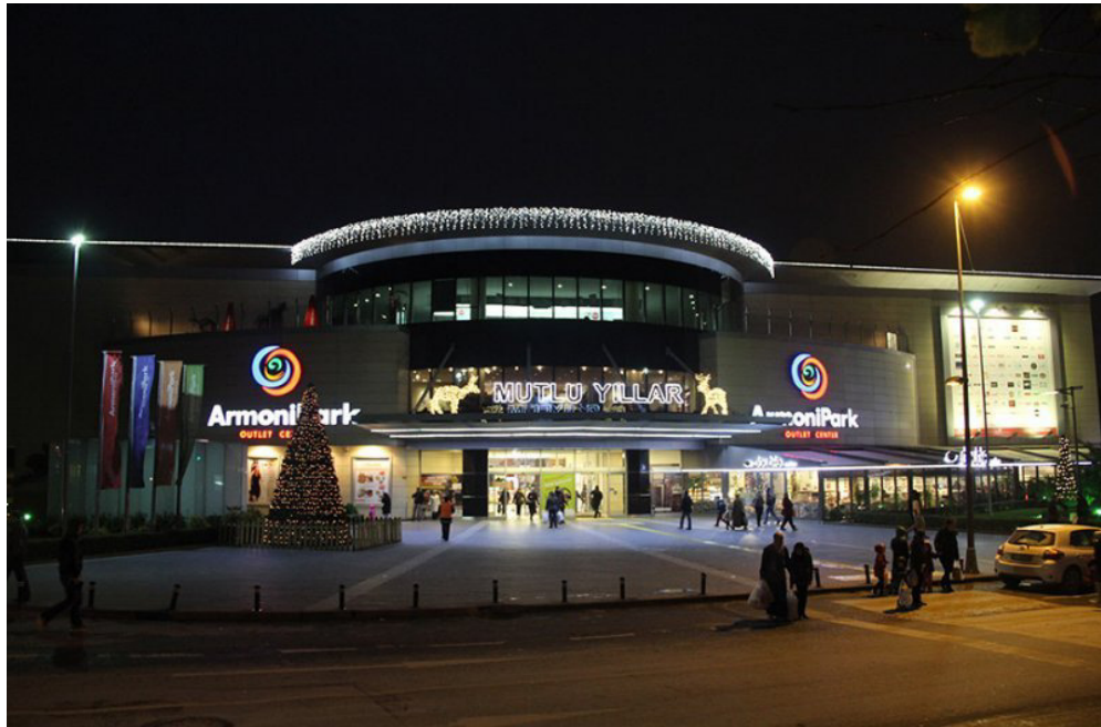
Resim 2.9: ArmoniPark'ın Dışarıdan Gece Görünümü