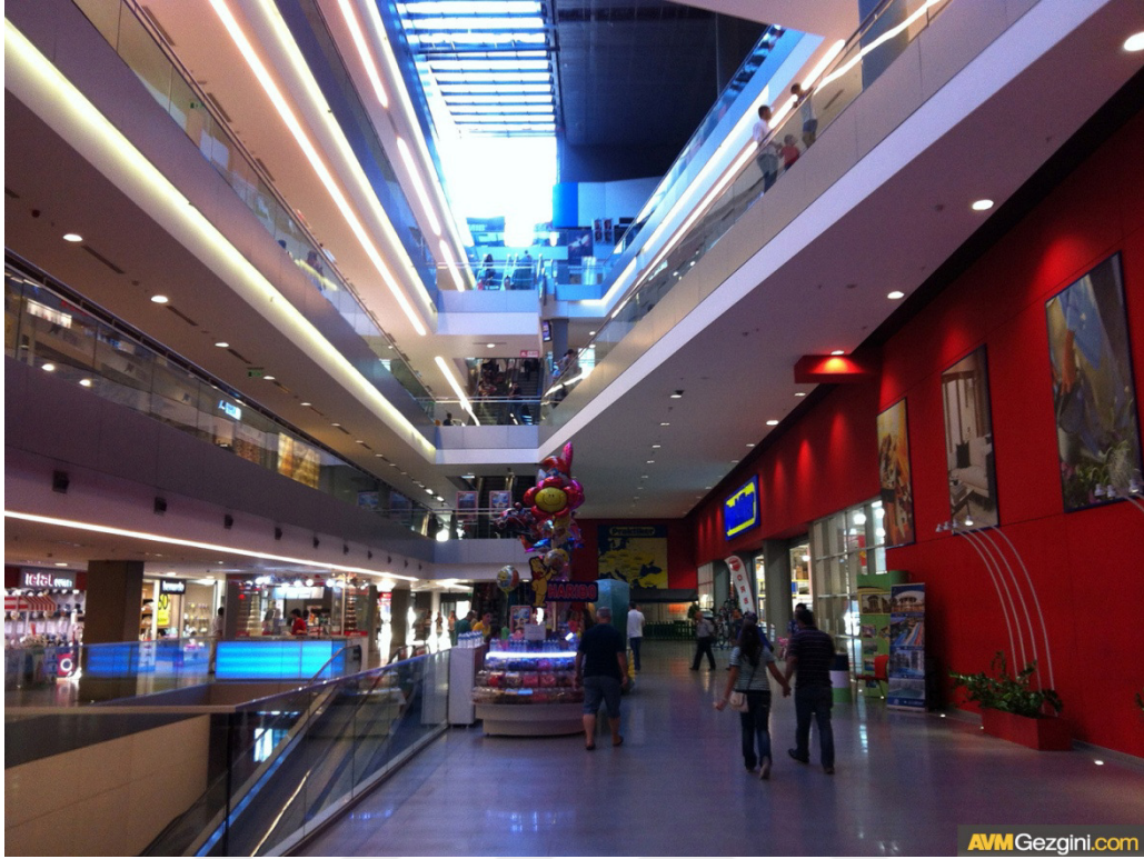
Resim 2.15: 212 İstanbul Power Outlet'in İçeriden Görünümü 2 ( http://www.avmgezgini.com/avmler/istanbul/212-avm-24.html , 17 Ocak 2016'da erişildi)

Türkiye'nin en büyük AVM'lerinden biri olan Mall of İstanbul, Mayıs 2014'te açılmıştır. İçerisinde Avrupa'nın en büyük çocuk eğlence merkezi Moi Park, 16 salonlu, 3050 koltuklu sinema, 700 kişilik gösteri sanatları merkezi yer almaktadır ( http://www.avmgezgini.com/avmler/istanbul/mall-of-istanbul-avm-223.html , 17 Ocak 2016'da erişildi). Türkiye'nin en büyük yerli AVM yatırımcısı Torunlar GYO tarafından 1.3 milyar TL'lik yatırımla hayata geçirilmiştir. Torunlar GYO tarafından hayata geçirilen Türkiye'nin ikinci en büyük alışveriş merkezi Mall of İstanbul, İstanbul'un gelişen bölgelerinden Başakşehir'de Atatürk Havalimanını TEM'e bağlayan Prestij Yolu (eski Basın Ekspres) üzerinde yer almaktadır. Mall of İstanbul, konsepti ve içinde barındırdığı farklı üniteleri ile Türkiye'nin en fonksiyonel alışveriş merkezi olarak ön plana çıkmaktadır. Mall of İstanbul 350 mağaza, binlerce marka, Avrupa'nın en büyük kapalı eğlence parkı Moi Park, gurme lezzetleriyle Gusto Moi, sanatın yeni sahnesi Moi Sahne gibi farklı fonksiyonları aynı çatı altında buluşturmaktadır ( http://www.milliyet.com.tr/mall-of-istanbul-acildi-konut-1886839/ , 15 Ocak 2016'da erişildi).