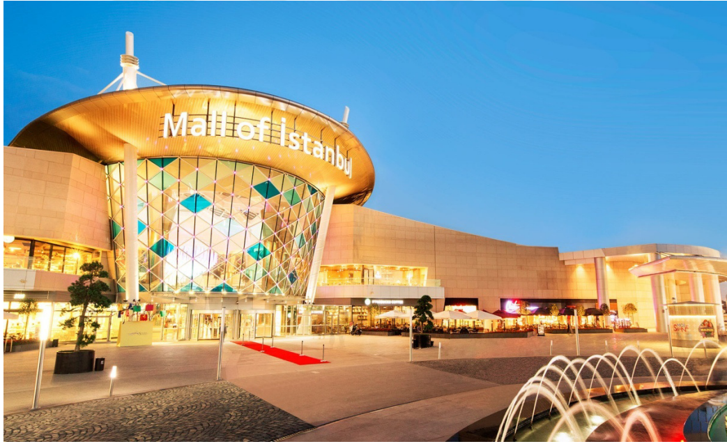
Resim 2.17: Mall Of İstanbul Dış Görünüm 1