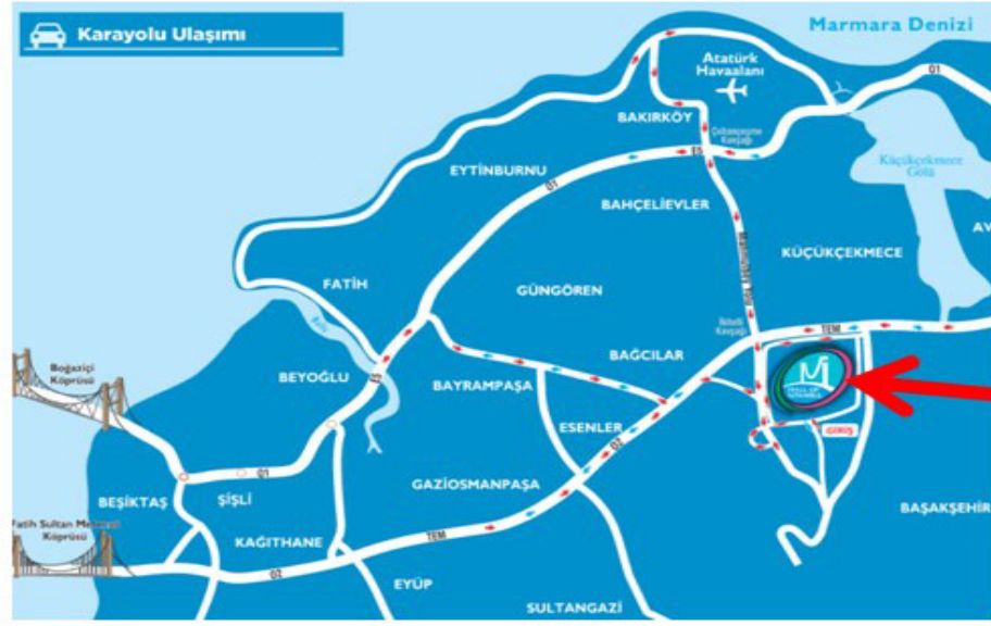
Resim 2.16: Mall Of İstanbul Harita

( http://www.sorgulamasitesi.net/haber/mall-istanbul-nerede 15 Ocak 2016'da erişildi)