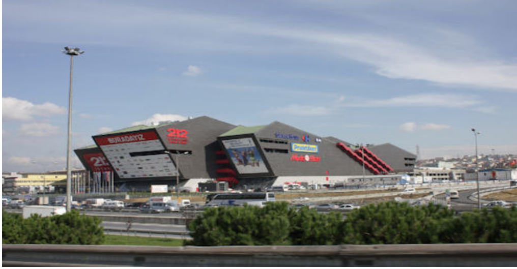
Resim 2.13: 212 İstanbul Power Outlet'in Dışarıdan Görünümü 2 ( http://v2.arkiv.com.tr/p7396-212-alisveris-merkezi.html , 17 Ocak 2016'da erişildi)