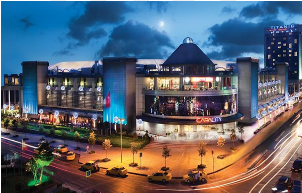
Resim 2.3: Capacity AVM'nin Dışarıdan Gece Görünümü ( http://mesgroup.com.tr/urunler.php?idsi=5 , 17 Ocak 2016'da erişildi).

Kapılarını 26 Ağustos 2011'de açan ArenaPark Alışveriş ve Yaşam Merkezi, Türk ve dünya markalarının yer aldığı 100 mağazası ve 10 salondan oluşan sinema alanıyla kısa sürede İstanbul'un Avrupa yakasının çekim merkezi olmayı başarmıştır. 100.000 metrekarelik alanda faaliyet gösteren ArenaPark'ın, 40.000 metrekarelik kiralanabilir kısmı bulunmaktadır. ArenaPark'ın iki katı alışveriş ve yaşam merkezi, bir