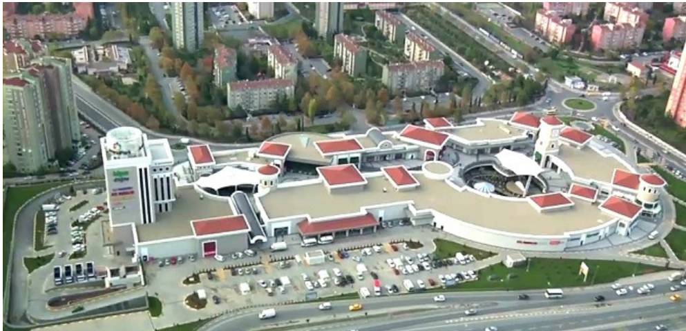
Resim 2.5: ArenaPark Dış Görünümü 2