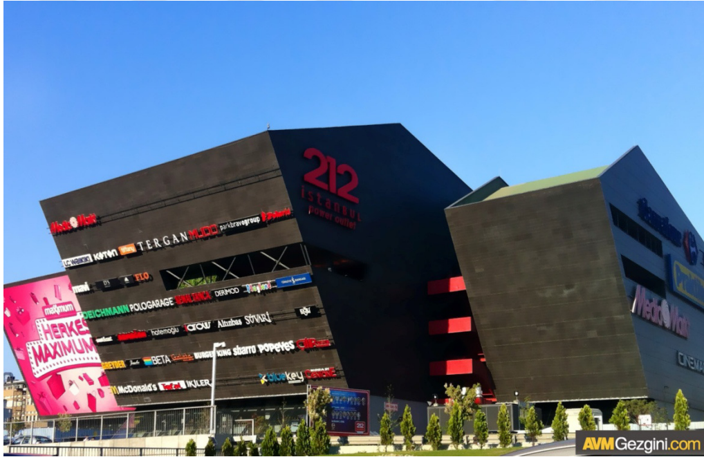
Resim 2.12: 212 İstanbul Power Outlet’in Dışarıdan Görünümü 1 ( http://www.avmgezgini.com/avmler/istanbul/212-avm-24.html , 17 Ocak 2016’da erişildi)

Yatırımı Edip Uluslararası Gayrimenkul tarafından yapılarak hayata geçirilen 212 İstanbul Power Outlet, Ağustos 2009’da açılmıştır. Toplam kapalı alanı 235 bin metrekare ve kiralanabilir alanı ise 70 bin metrekareden oluşmaktadır. Ayrıca 212 İstanbul’da 175 mağaza bulunmakta ve 2’si 3D olmak üzere toplam 9 sinema salonu vardır ( http://www.gazetemetro.com/alisverisin-212-hali/ , 17 Ocak 2016’da erişildi). Türkiye’de ilk “power outlet” olma özelliğini taşıyan 212 İstanbul, Atatürk Havalimanı’na yakın konumu ve 3500 araç kapasiteli ücretsiz kapalı ve açık otoparkı ile Bağcılar’da hizmet vermektedir ( http://www.212istanbul.com/icerik/hakkimizda.html , 17 Ocak 2016’da erişildi). 212 AVM outlet alışveriş merkezi, geniş mağaza portföyü ile outlet kategorisinde büyük alışveriş merkezleri arasındadır. Başakşehir girişi Basın Ekspres yolunun sağında, İkitelli’nin karşısında yer almaktadır. 212 AVM Power Outlet, metrekareye en fazla park alanı bulunan AVM olarak şehir merkezindeki AVM’lerde yaşanan trafik ve park sorununa yapıcı bir yaklaşım sunmaktadır ( http://www.avmgezgini.com/avmler/istanbul/212-avm-24.html , 17 Ocak 2016’da erişildi).