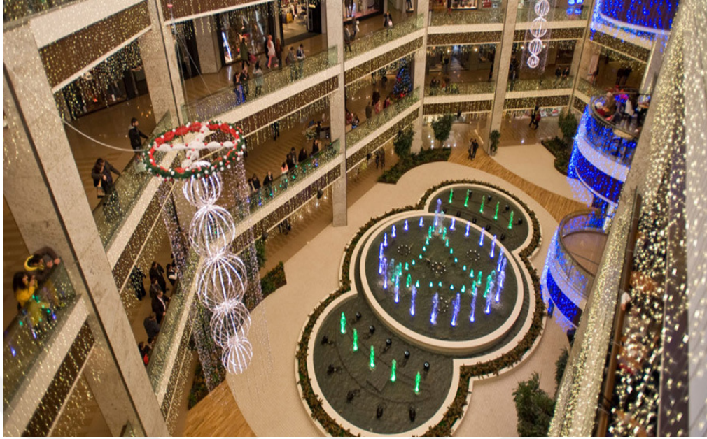
Resim 2.2: Capacity AVM'nin İçeriden Bir Görünümü ( http://mesgroup.com.tr/urunler.php?idsi=5 , 17 Ocak 2016'da erişildi).