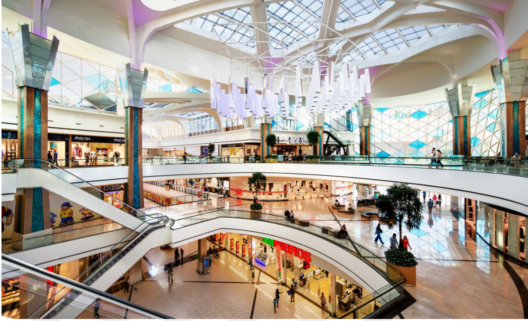
Resim 2.18: Mall Of İstanbul İç Görünümlerinden Biri ( http://www.mallofistanbul.com.tr/index.htm 15 ocak 2016'da erişildi)