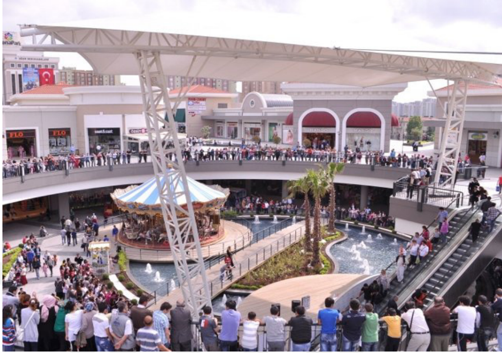
Resim 2.6: ArenaPark İÇeriden Görünümü 1