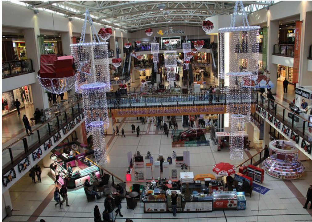
Resim 2.11: ArmoniPark'ın İçeriden Görünümü 2 ( http://www.armoniPark.com/ , 17 Ocak 2016'da erişildi)