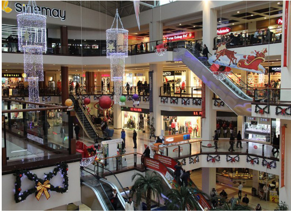
Resim 2.10: ArmoniPark'ın İçeriden Görünümü 1