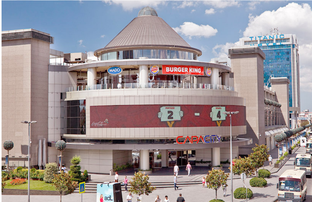
Resim 2.1: Capacity AVM'nin Dışarıdan Gündüz Görünümü ( http://www.beyaz-insaat.com/biten/capacity-avm/19 , 15 Ocak 2016'da erişildi).

2007 yılında Uzman İnşaat, Keleşoğlu İnşaat, Kameroğlu İnşaat, Gül İnşaat, Beyaz İnşaat ve Zirve İnşaat ortaklığında İstanbul'un 3. bölgesi olarak tanımlanan Bakırköy'de hayata geçirilen Capacity, 155.000 m 2 'lik bir alana alışveriş ve yaşam merkezi olarak kurulmuştur. Yılda 22 milyon ziyaretçiyi ağırlayan Bakırköy'ün en büyük alışveriş merkezi Capacity, bünyesinde dünyaca ünlü Hugo Boss, GAP, Sephora, Armani Jeans, MAC, Beymen, Vakko, W, Massimo Dutti, Zara, Mango gibi markalar başta olmak üzere her biri kendi alanında öncü ve tanınmış 200'ü aşkın markaya ev sahipliği yapmaktadır. 9 adet sinema salonu, 2500 araçlık otoparkı, eğlence noktaları, gece saat 02:00'a kadar hizmet veren Midpoint, Chocolate, Cookshop gibi popüler zincir restoran ve kafeleri ile bölgede önemli bir buluşma noktası konumundadır ( http://www.capacity.com.tr/kurumsal , 15 Ocak 2016'da erişildi).