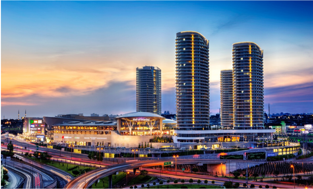
Resim 2.19: Mall Of İstanbul Dış Görünüm 2 ( http://www.mallofistanbul.com.tr/index.htm 15 ocak 2016'da erişildi)