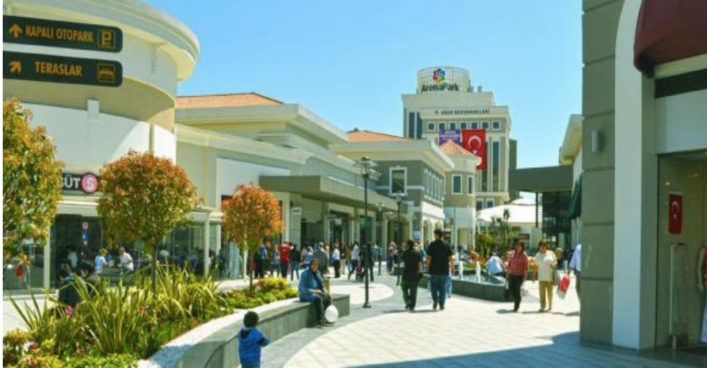
Resim 2.7: ArenaPark İÇeriden Görünümü 2