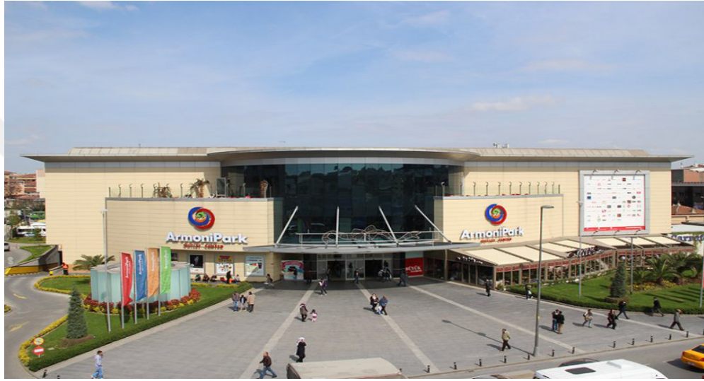
Resim 2.8: ArmoniPark'ın Dışarıdan Gündüz Görünümü ( http://www.armonipark.com/ , 17 Ocak 2016'da erişildi)

alanları ve eğlence alternatifleriyle sadece bir alışveriş değil, aynı zamanda yaşam merkezi de olan ArmoniPark, bulunduğu bölgenin yeni buluşma noktası haline gelmektedir. ArmoniPark'ta market devi Carrefoursa ve teknoloji devi Teknosa merkezin en gözde mağazaları olarak öne çıkmaktadır. Merkezin üst katında 7 salonlu sinema kompleksi bulunmaktadır ( http://www.armonipark.com/ , 17 Ocak 2016'da erişildi).