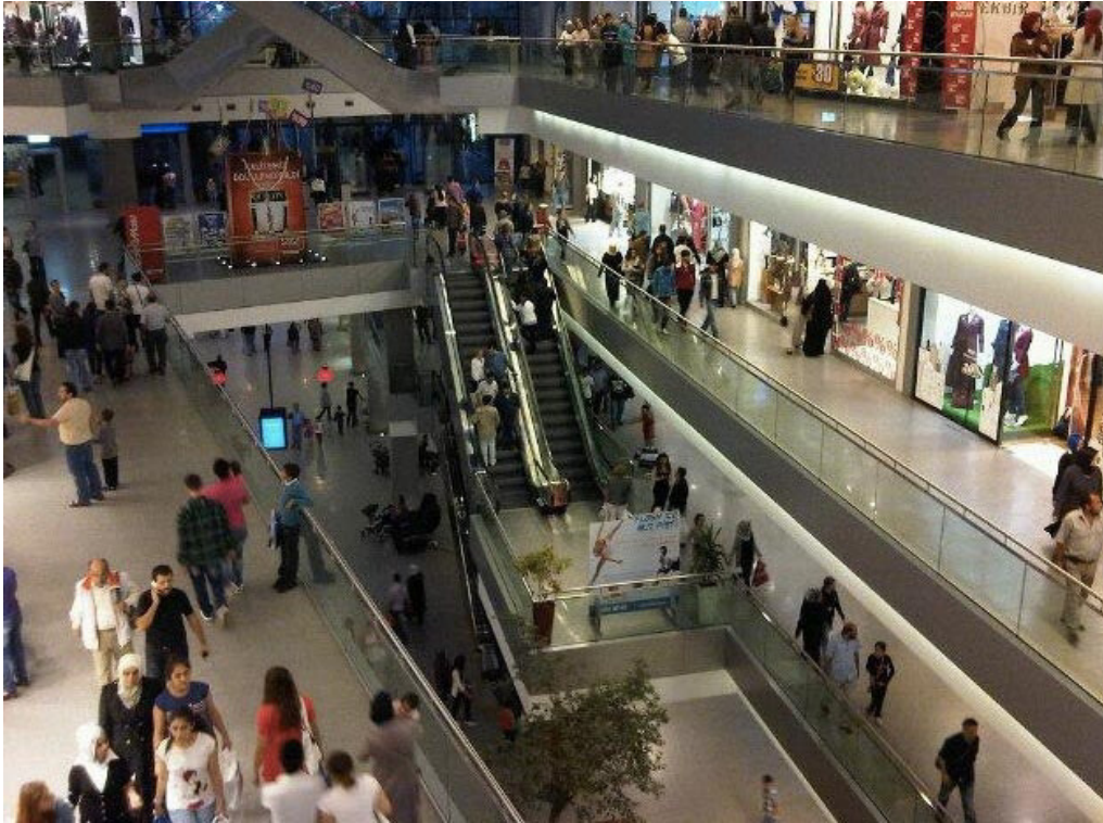
Resim 2.14: 212 İstanbul Power Outlet'in İçeriden Görünümü 1 ( http://www.avmgezgini.com/avmler/istanbul/212-avm-24.html 17 Ocak 2016'da erişildi)