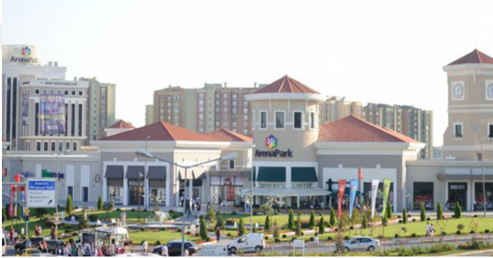
Resim 2.4: ArenaPark Dış Görünümü 1

katı ise otopark olarak düzenlenmiştir. 100 mağazanın bulunduğu merkezde Çarşı, Mavi, Colin's, LC Waikiki, Koton, Hotiç, Tesco Kipa, Starpark, D&R, FLO, Arow, Mudo, TeknoSA, Watsons, Siemens ve Burger King gibi ulusal ve uluslararası markalar bulunmaktadır. Alışveriş dışında, yaşam ve eğlence merkezi konseptiyle de öne çıkan ArenaPark'ta 2 bin 400 metrekarelik, 10 salondan oluşan sinema alanı yer almaktadır. ArenaPark'ın içinde bulunan çocuk eğlence merkezi Starpark ise 3 bin metrekarelik bir alanda hizmet vermektedir ( http://www.arenaparkavm.com/sayfa/hakkimizda , 17 Ocak 2016'da erişildi).