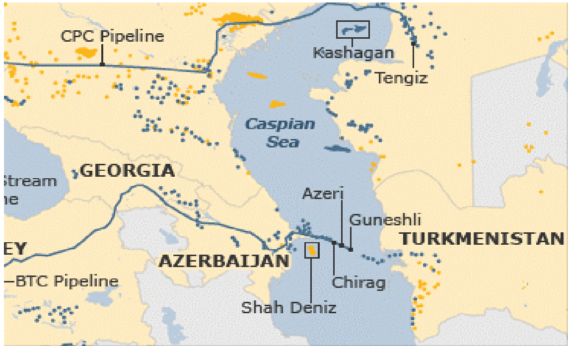
Harita 2.4: Azerbaycan'ın Asrın Anlaşması projesi kapsamında işlettiği enerji yatakları (Rasullu, 2014:37).

ve işgal altında bulunan topraklarını Ermenistan'dan kurtarma amaçları bunu yaparken de global güçlerin nüfuzundan yararlanma arzusu etkili olmuştur (Aras 2005: 14). Antlaşmanın yapılmasından birkaç yıl sonra Türkmenistan antlaşmaya konu yataklardan birinin tamamının diğerinin ise önemli bir kısmının kendi sınırları içinde bulunduğu iddiasında bulunmuşsa da Azerbaycan tarafından bu itiraz gecikmiş bir itiraz olarak değerlendirilmiştir.