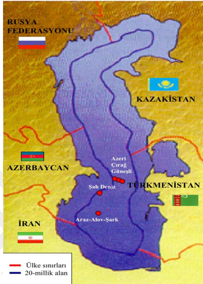
Harita 2.1: Hazar'ın condominium yöntemiyle sınırlandırılması (Babayev 2015: 48).

Milletlerarası hukukta kara alanları üzerindeki ortak mülkiyete birkaç örnek bulunurken kapalı ve yarı kapalı su alanları üzerinde ortak mülkiyete ilişkin tek örnek Fonseca Körfezi'nin Nikaragua, El Salvador ve Handum arasında paylaşımıdır. Genelde ortak mülkiyet kararı taraflar arasında yapılacak andlaşmayla karara bağlanırken bu örnekte Adalet Divanının kararı söz konusu olmuştur. Uluslararası Adalet Divanı 11 Eylül 1992 tarihli kararı ile tek devletin hakimiyetinde bulunan ve de uzun süredir bütünlük gösteren bu su kitlesinin halef devletlerin ortaya çıkması sonrası bölünmesinde hukuki menfaat görmediği için böyle bir karar vermiştir. Bu örnek Hazar'ın durumuna benzemekle beraber burada bölünme öncesi körfez sadece İspanya'nın egemenliğindeyken Hazar'da iki devletli yapı bulunmaktadır (Croissant ve Croissant 1996-97: 28).