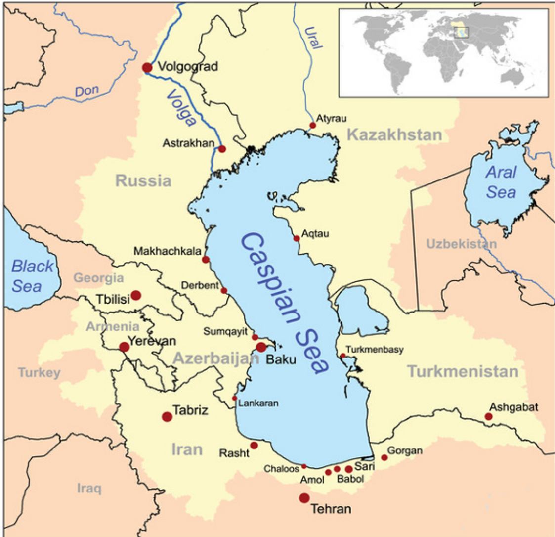
Harita 1.1: Hazar'ın coğrafi konumu (Yaman ve Tari 2018).

Hazar 500 milyon yıl kadar önce Kambrien zamanında oluşan ve günümüzde Karadeniz, Marmara, Hazar Denizi, Aral Gölü ve Azak Denizinin kapladığı alanda bulunan ve iç deniz durumundaki Sarmatya Denizinin zaman içinde bölünmesi sonucunda oluşan parçalardan biridir. Hazar'ın kuzey ve kuzeydoğusunda Kazakistan, doğusunda Türkmenistan, batısında Azerbaycan, kuzeybatısında Rusya ve güneyinde İran bulunmaktadır. Hazar'a dökülen belli başlı ırmaklar başta Volga olmak üzere Ural, Emba, Etre, Kuma, Terek, Sulak, Samur, Astara ile Kızıl Ören Irmağının Gilan ve Sefidrüd kollarıdır. Hazar'a dökülen nehir sayısı toplamda 130 dan fazlayken toplam suyun % 88'i Volga Ural ve Terek nehirlerinden sağlanır. Çok sayıda adanın yanında bir de Abşeron Yarımadası bulunmaktadır (Deniz 2014: 29-30).