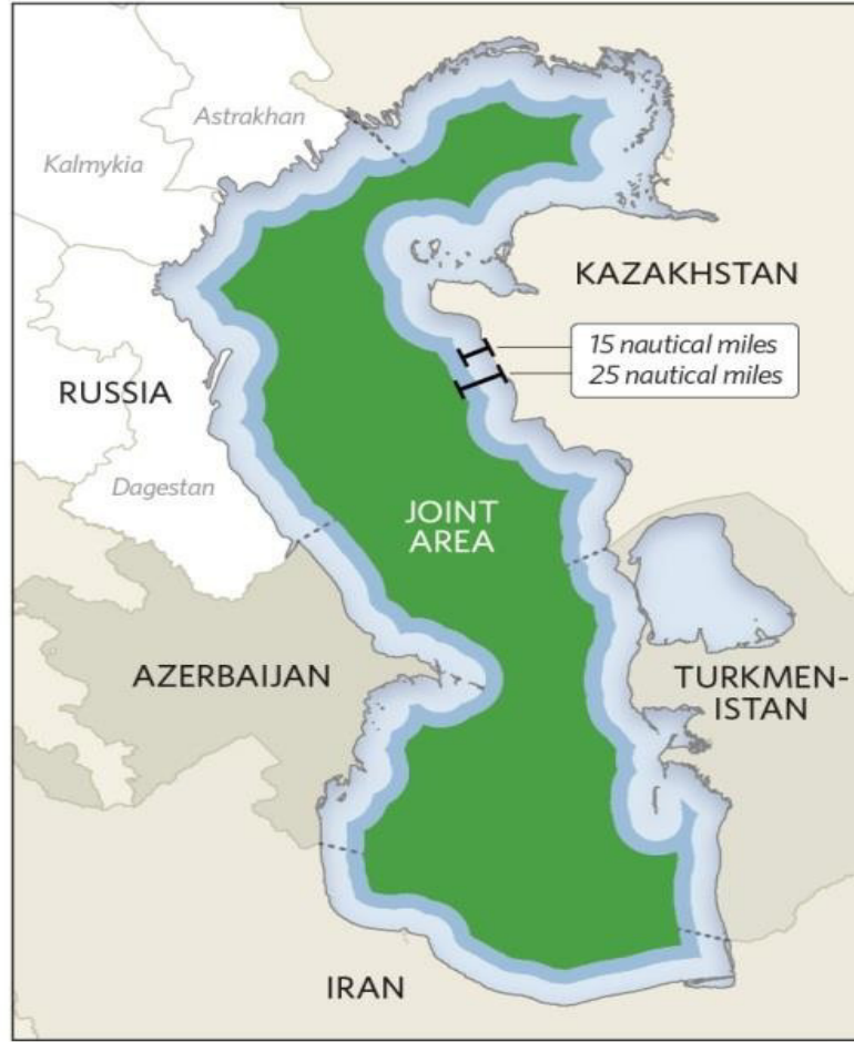
Harita 2.5: 2014 Astrahan Zirvesinde kararlařtırılan uygulama řekli (Duman 2016: 27).