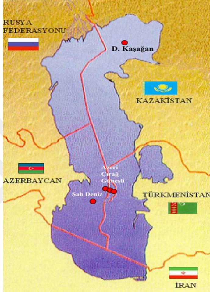
Harita 2.2: Hazar'ın orta hat yöntemiyle sınırlandırılması (Babayev 2015: 50).

bölünmesi diğeri ise kıyının genel yönünde dikey bir çizgi çizilmesidir (Clagett 1995, Aktaran: Çolakoğlu 1998: 117).