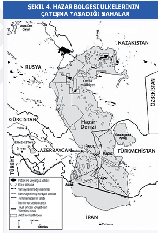
Harita 2.3: Hazar bölgesi ülkelerinin çatışma yaşadığı sahalar (Karagöl, Kızılkaya ve Kaya 2016: 20).

Hazar'ın kuzey kısmında Rusya, Azerbaycan ve Kazakistan deniz dibindeki sınır hatlarının kesişim noktaları hususunda anlaşmalarından Hazar'ın bu kısmında statükonun korunmasını istediklerinden denizin %60'nı kapsayan bir alanda kendi ekonomik çıkarlarına aykırı olmayacak şekilde hukuki rejim oluşturmuşlardır. Hazar'ın güneyinde ise sınır komşuları olan İran, Azerbaycan ve Türkmenistan ekonomik nedenler ve güvenlik algılamaları nedeniyle enerji rezervlerinin paylaşımı hususunda bir anlaşmaya varamamışlardır (Rasullu 2014: 23).