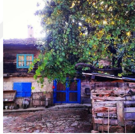
(Karahüseyinli Köyü'nden manzaralar)