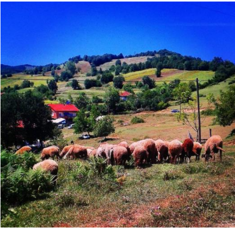
(Karahüseyinli Köyü'nden manzaralar)