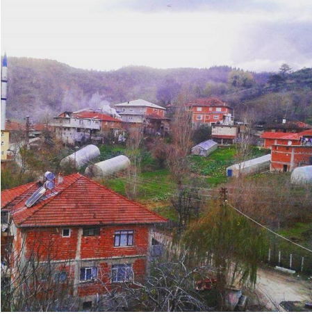
(Karahüseyinli Köyü'nden manzaralar)