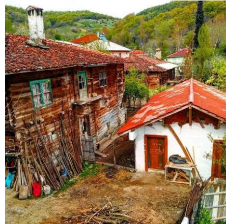
(Karahüseyinli Köyü'nden manzaralar)