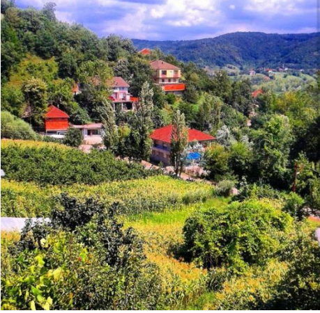
(Karahüseyinli Köyü'nden manzaralar)