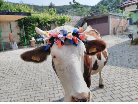
(Yeni doğum yapmış bir inek)