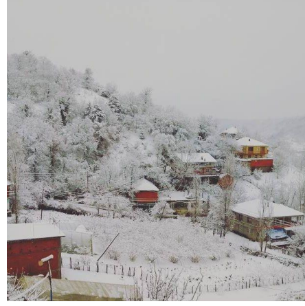
(Karahüseyinli Köyü'nden manzaralar)