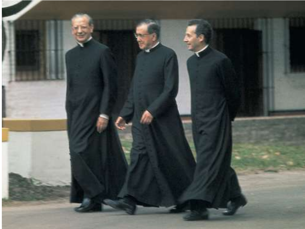
Tarikatın kurucusu Josemaría Escrivá (ortada), Escrivá'nın halefi Don Álvaro del Portillo (solda); tarikatın üçüncü piskoposu Javier Echevarría (sağda)