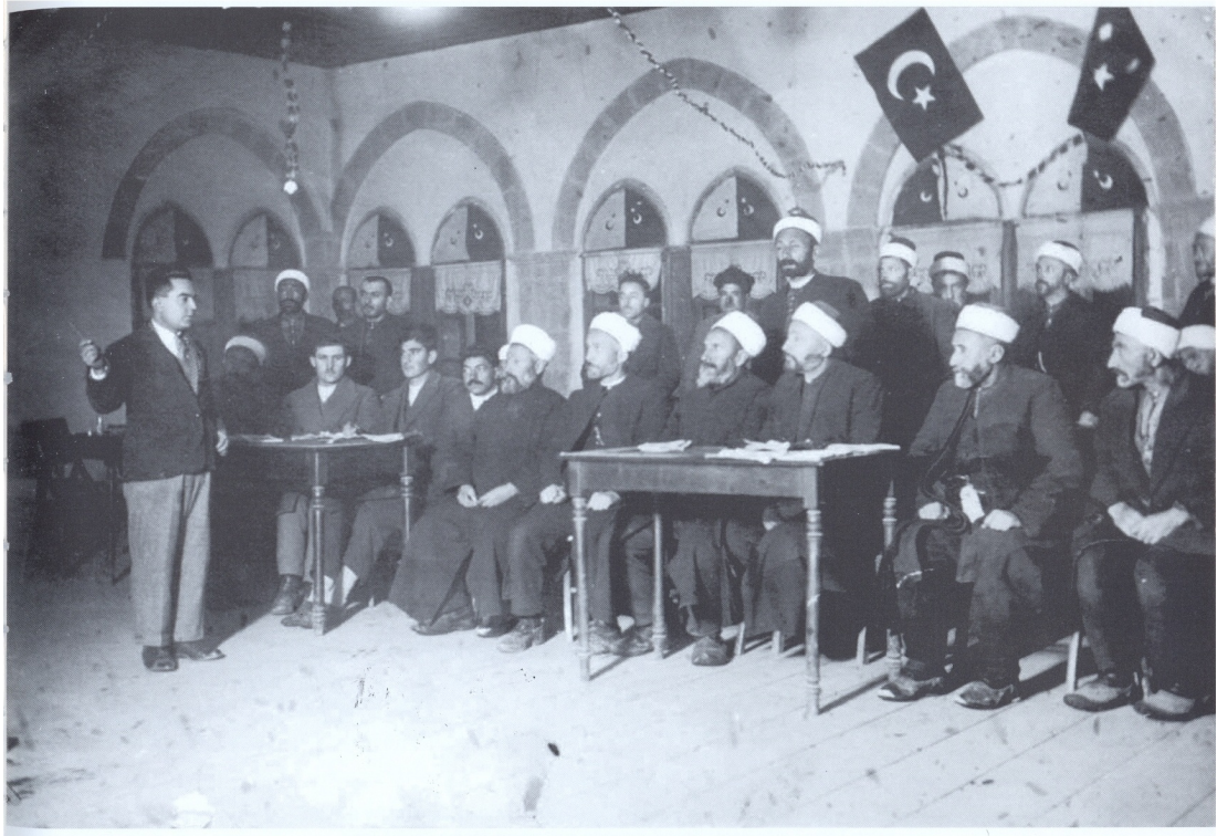
1927 yılında bu günkü Çorum belediye binasında ilk Latin alfabesini öğrenen imamlar