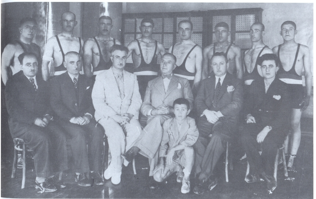
Vali Süreyya Yurdakul ve Halkevi yöneticileri