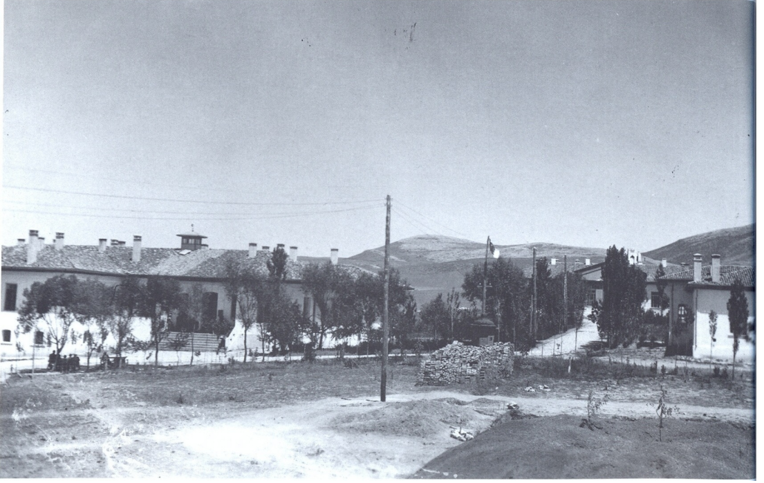
1930'lu yıllarda Çorum Devlet Hastanesi