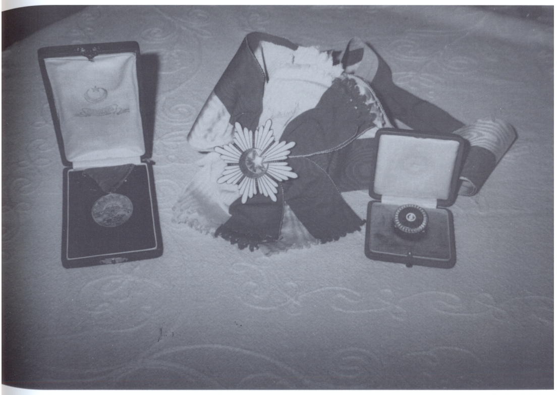
Çorum Mebusu İsmet Eker'in Madalyası ve Milletvekilliği Rozeti