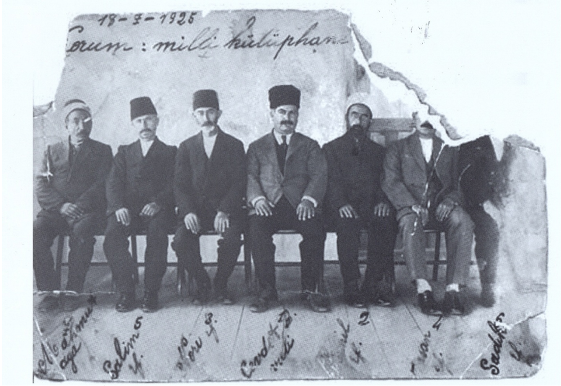
1925 yılında Çorum Milli Kütüphane Personeli