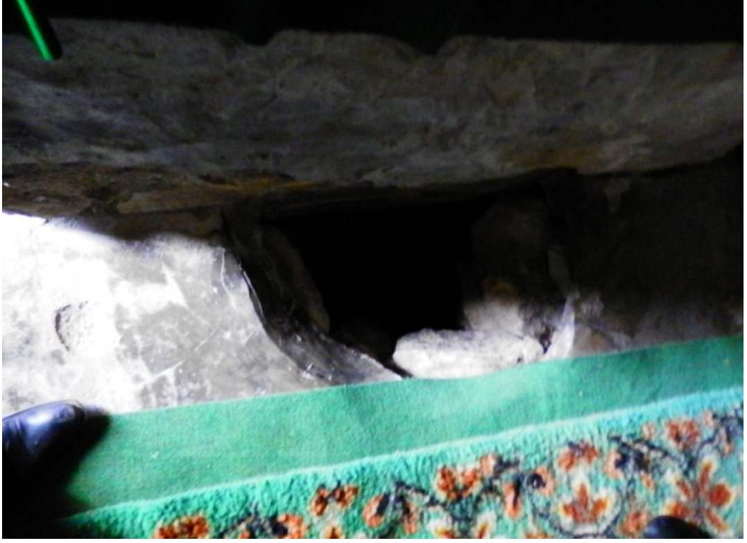
Foto 1.16: Sulu Türbe Tedavi Uygulamasında Kullanılan Toprağın Alındığı Yer.