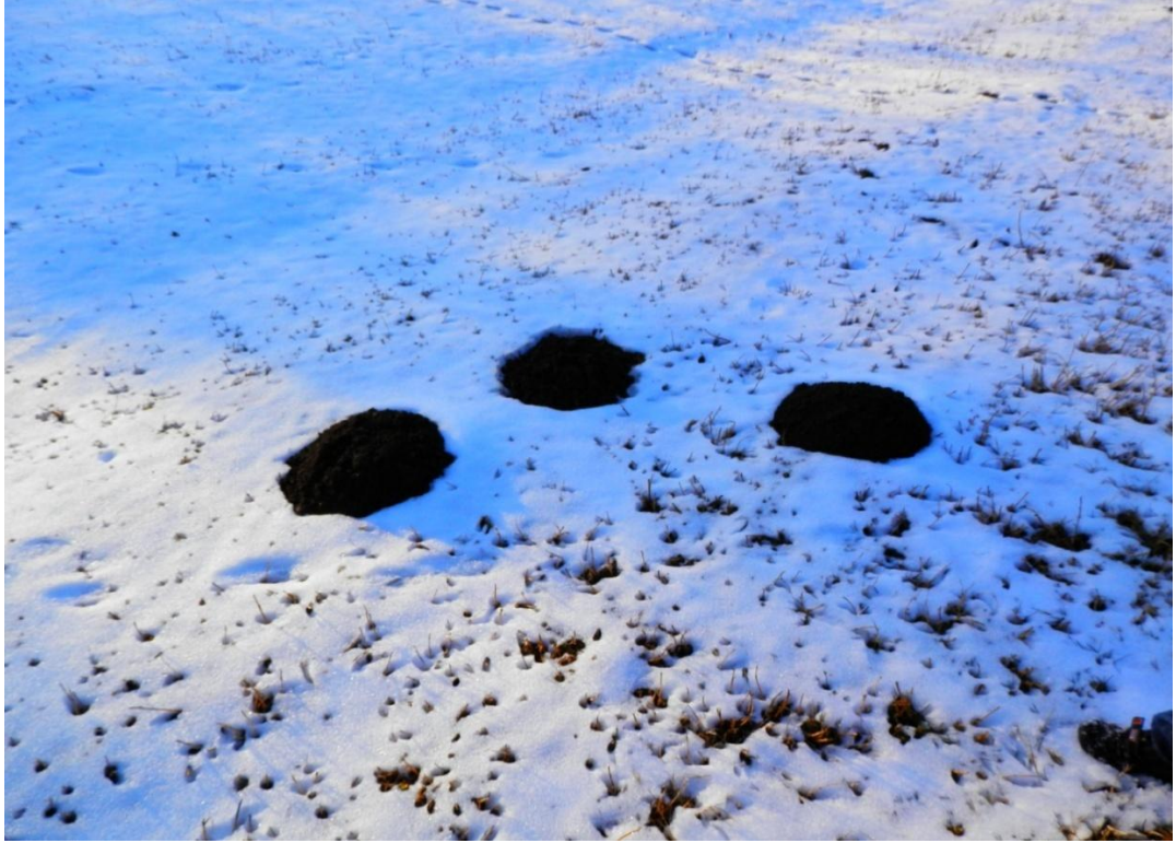
Foto 1.5: Kösnü Hastalığı Tedavisinde Kullanılan Kösnü Toprağına Örnek