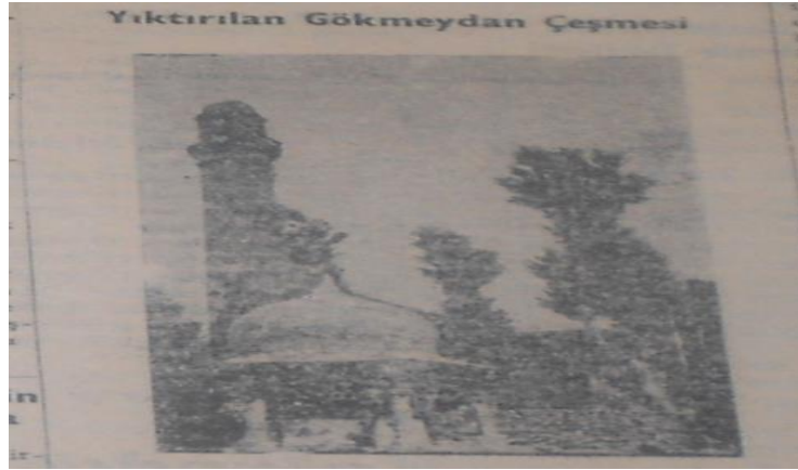
Şekil 3.1.: Gökmeydan Çeşmesi 286

Yıkılan eserler arasında Gökmeydan Çeşmesi de bulunuyordu. Tahmini olarak 1900 yıllarında yapılmış olan Gökmeydan Çeşmesi, ne yazık ki, gayri mesul şahıslar tarafından yıkılmıştır. Gerekli işlemler yapılmadan, ilgililerin fikri sorulmadan ve