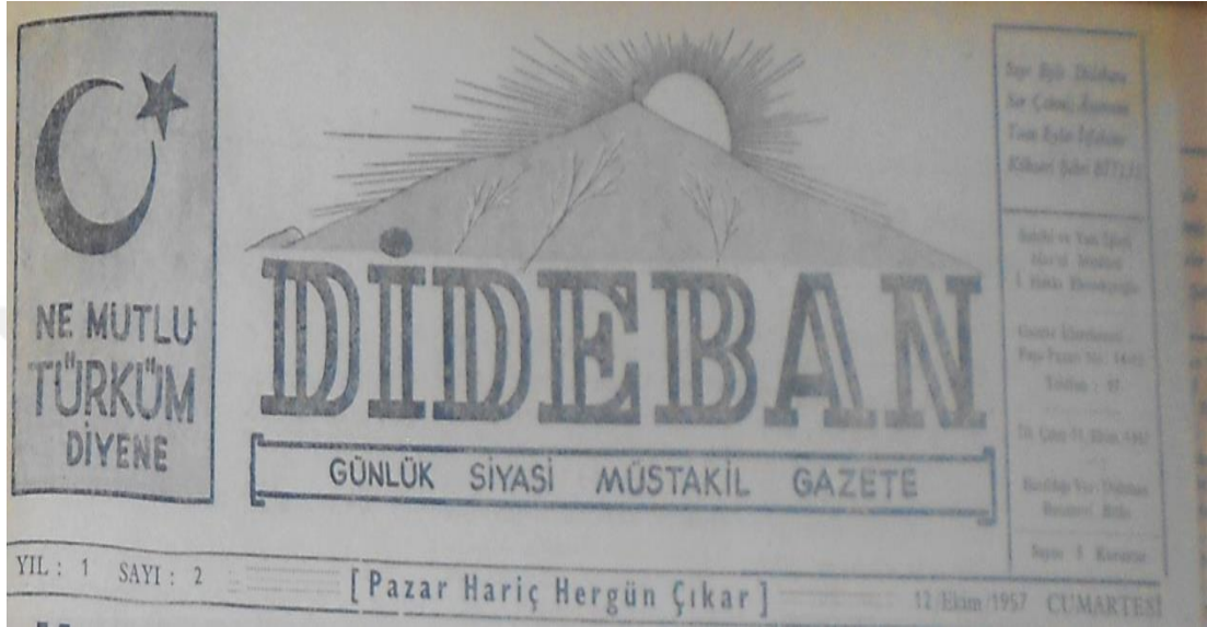
Şekil 1.1.: Dideban Gazetesi'nin İsim, Yıl, Sayı, Tarih ve Fiyat Bölümü 9

Gazetenin sol tarafında, Mustafa Kemal Atatürk'ün sözü olan “ Ne Mutlu Türküm Diyene ” yazmaktadır. Sağ tarafında ise sahibi, idarehanesi, basım yeri ve ilk çıkış tarihi yer almaktadır. Gazete isminin alt kısmında ise, soldan sağa sırasıyla yıl, sayı, tarih ve fiyatı hakkında bilgiler yer almıştır. Dideban gazetesi ilk çıktığında fiyatı 5 kuruştur. 10 Daha sonra 10 kuruştan satılmıştır. 11 Gazete kurulduğu tarihten itibaren, çeşitli aralıklarla Dideban, Yeşil Bitlis 12 ve Şerefhanoglu Basımevi matbaalarında basılmıştır. 13