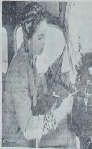
Kalınca bej kumastan yapılmış olan bu tayyörün içine Leopar derisinden bluz giyilmiştir. Şapka da aynı cins kürktendir...