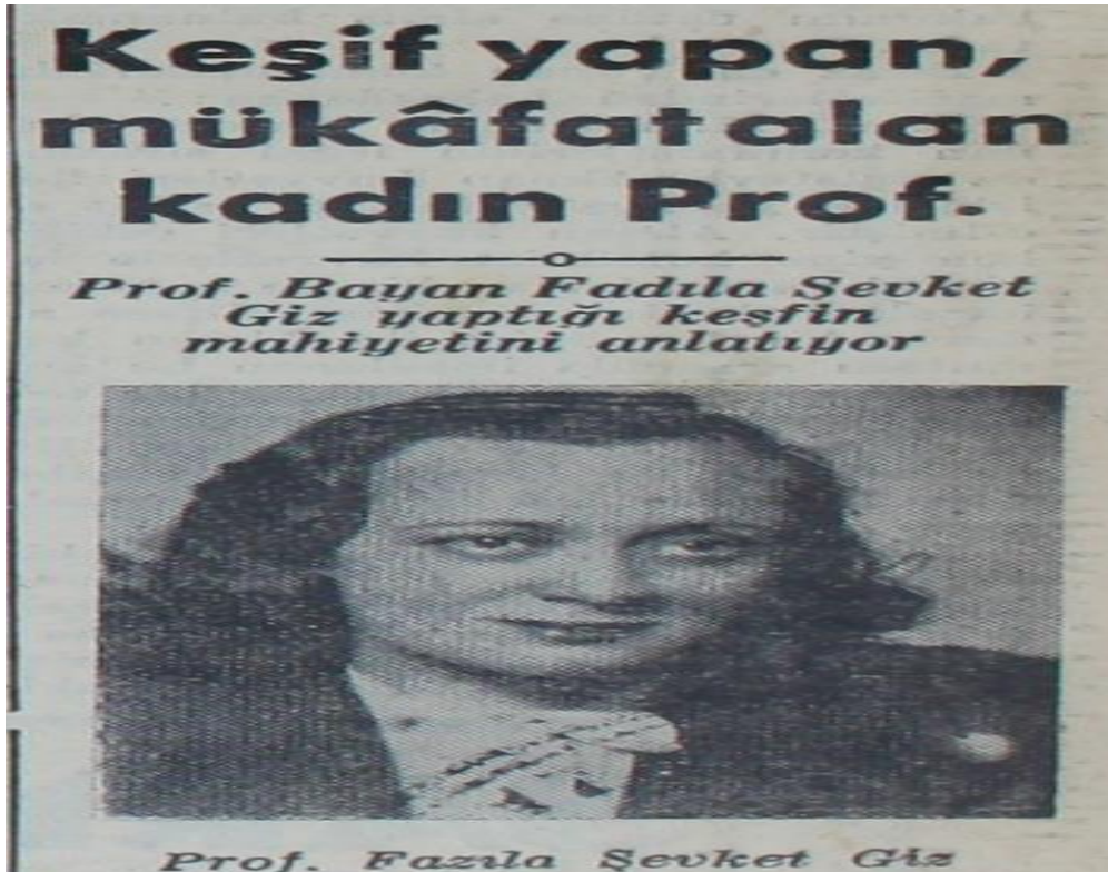
Ek-5: Yeni Sabah, 13 Ocak 1950: 6.