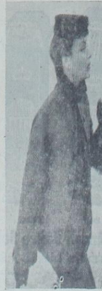
Menekşe renginde olan bu jaketin düğme, modelde gördüğünüz gibi bezen şeklinde astrakan parçaları geçirilmiştir. Kol ve yaka ayrıları yine incecik bantı şeklinde astrakana süslenmiştir.