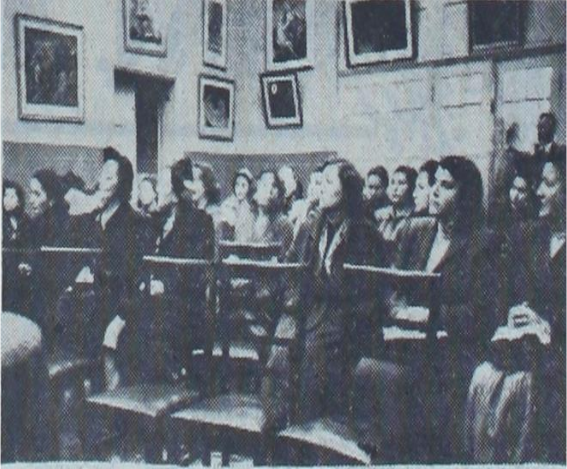
Ek-18: Kadınlar Birliđi Kongresinden Bir Görünüř. Zafer, 10 Aralık 1950, “Kadınlar Birliđi”, s.1