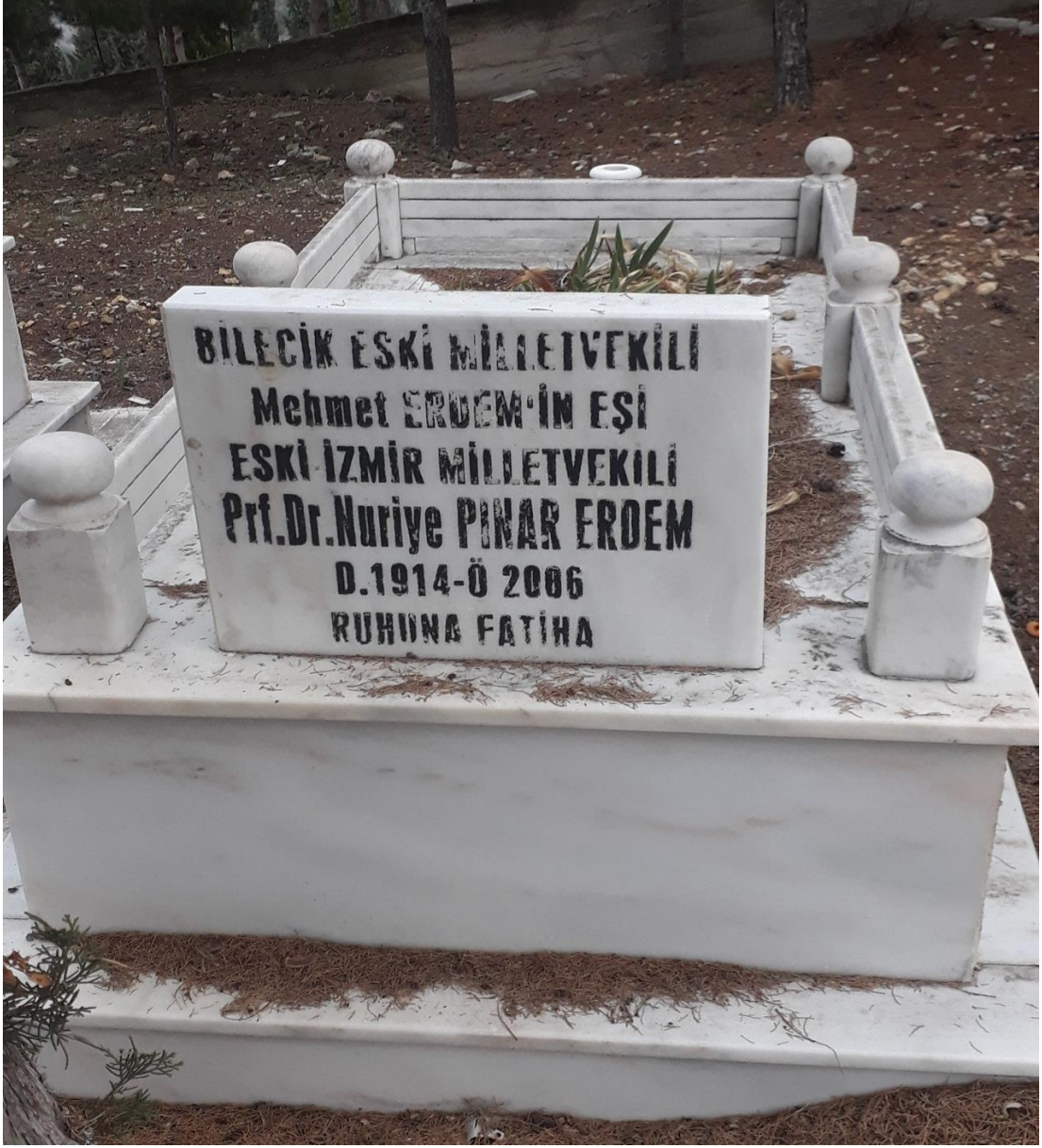
Ek-9: Nuriye Pınar Erdem'in Bilecik'te Bulunan Kabri