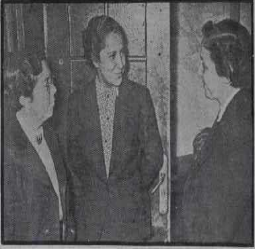
Ek- 1: Akis, “Kadın Mebuslar”, 22 Mayıs 1954.