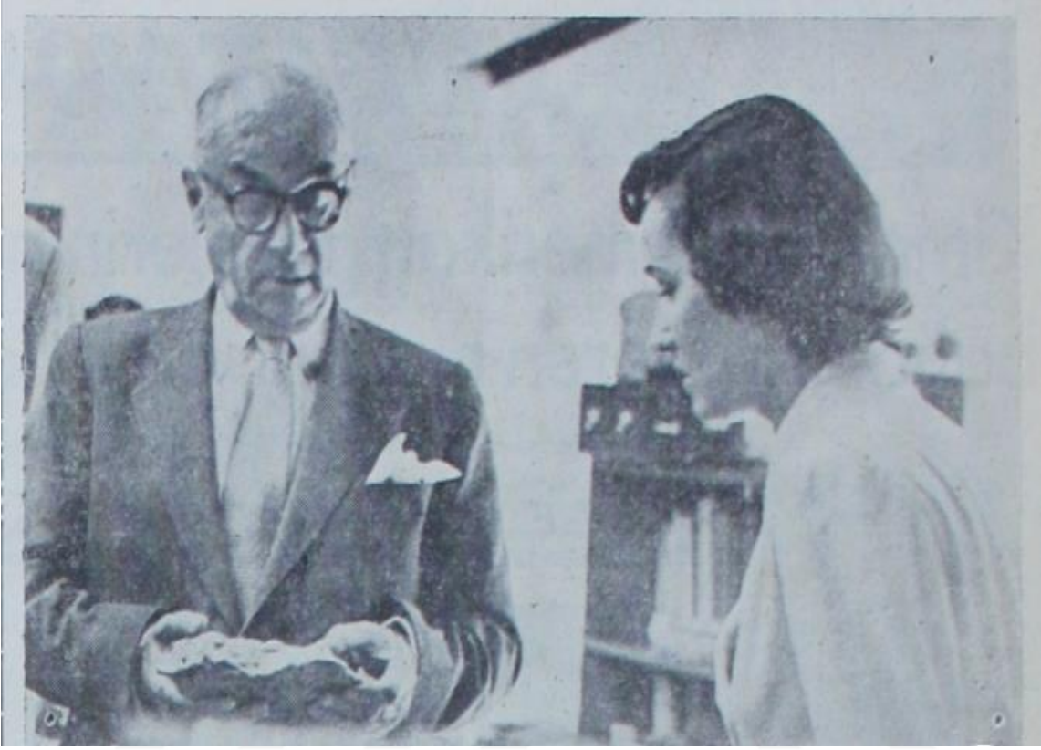
Cumhurbaşkanı Celâl Bayar, Maden Tetkik Arama Enstitüsünü ziyareti sırasında maden mühendisi bayandan izahat alırken...