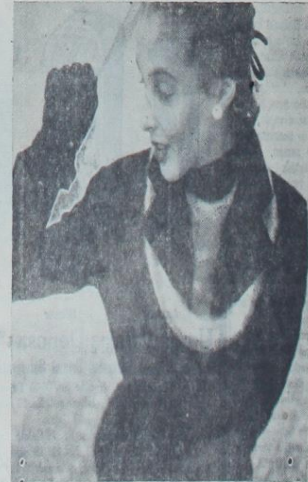
Siyah tayyörün içine platin vizonun bir file giyilmiş ve yaka kısmı altından, aynı kürkten bir bant, vuvuarlanarak kolbe gibi geçirilmiştir.