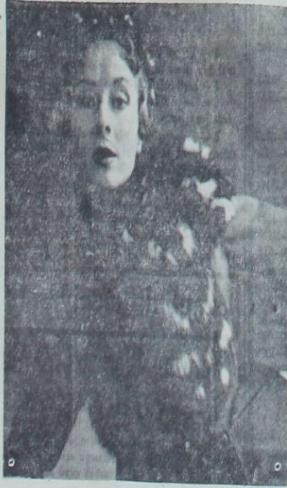
Yaşaktan yapılan bu uzun eşarp sol omuzuna güzel bir no meydana getiriyor. Şapkaya da aynı cins kürkten garnitür konmuştur...