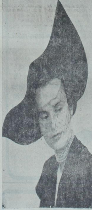
Bu şapka silüet, renk ve garnitür bakımından çok şık ve orijinaldir. Sağ taraf siyah topeden sol taraf koyu mavimsi mavimsidir. Yüzü maskeleyen vüalet, parlak taşlarla süslenmiştir.