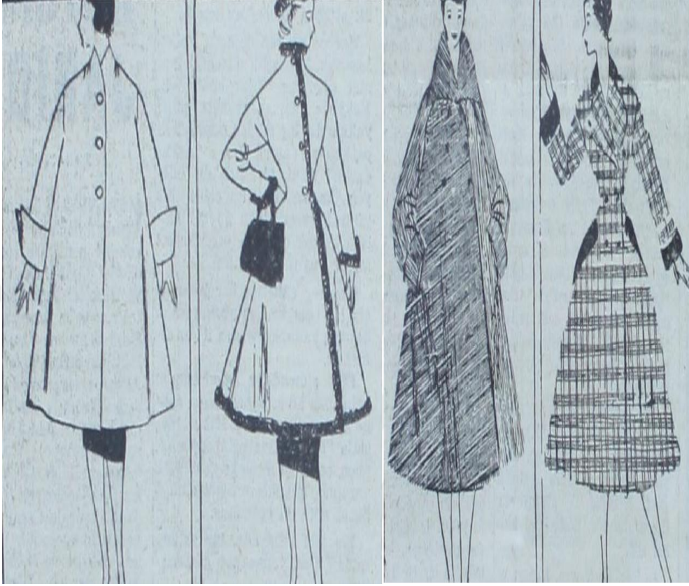
Ek-13: Yeni İstanbul, 27 Kasım 1950, "Mantolar", s.6