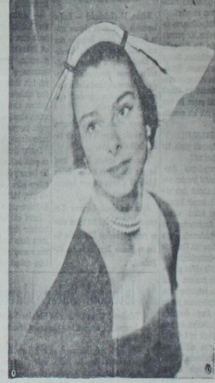
Üst kısmı siyah tope, iç kısmı da resimde gördüğünüz gibi beyaz erminden olan bu güzel şapkanın kürküne, yine erminden 10 kuruş büyüklüğünde varlıklar aplike edilmiştir.