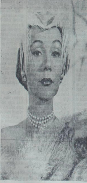
Erminden yapılmış olan bu güzel şapkanın iki tarafından yine beyaz (parad) tüyler sarkmaktadır...