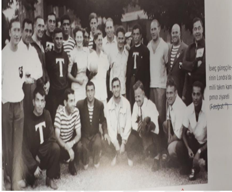
İsveç güreşçilerinin Londra'da milli takım kampımızı ziyareti (Fotograf).