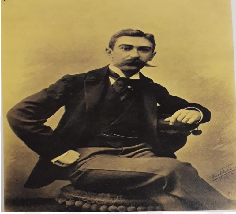
Modern Olimpiyatların Kurucusu: Baron Pierre de Coubertin (100 Years Of Olympic Wrestling 1997: 44).