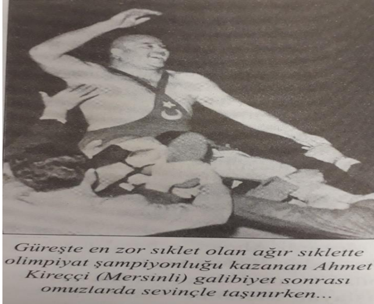
Londra Olimpiyatları grekoromen güreş Şampiyonu Ahmet Kireççi (Cumhuriyet, 14 Ağustos 1948: 1).