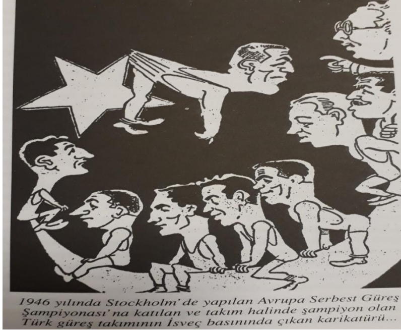
1946 yılında Stockholm'de yapılan Avrupa Serbest Güreş Şampiyonası'na katılan ve takım halinde şampiyon olan Türk güreş takımının İsveç basınında çıkan karikatürü...