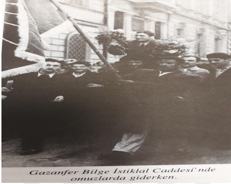
Londra Olimpiyatları Serbest güreş Şampiyonu Gazanfer Bilge (Atabeyoğlu, 2015: 24)