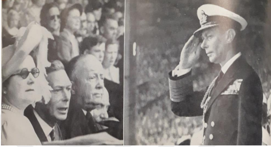
Resim 1: İngiltere Kralı Albert Frederick Arthur George Açılıшта.

bulunan Yunanistan milli ekibi seyirciler tarafından çokça alkışlanmışlardır. Yunanistanlı sporcular Kral Locasının önünden geçerken milli bayraklarını eğmek suretiyle İngiltere kralını selamlamışlardır (Hürriyet 30 Temmuz 1948: 6).