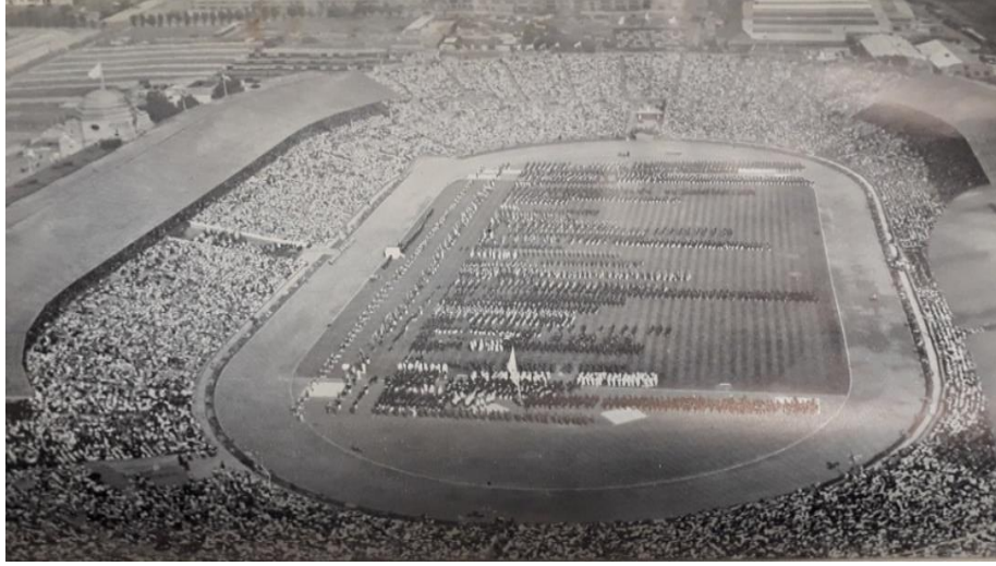
Resim 2: Olimpiyatların Açılışı (Report of the United States Olympic Committee 1948 games).