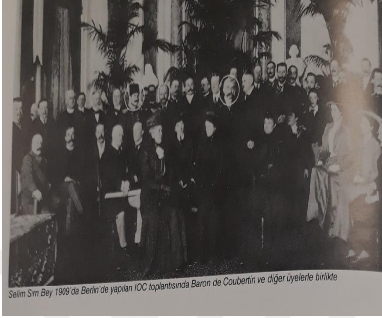
1909 yılında Berlin'de yapılan Uluslararası Olimpiyat Komitesi üyeleri (İstanbulluođlu, 2008:12).