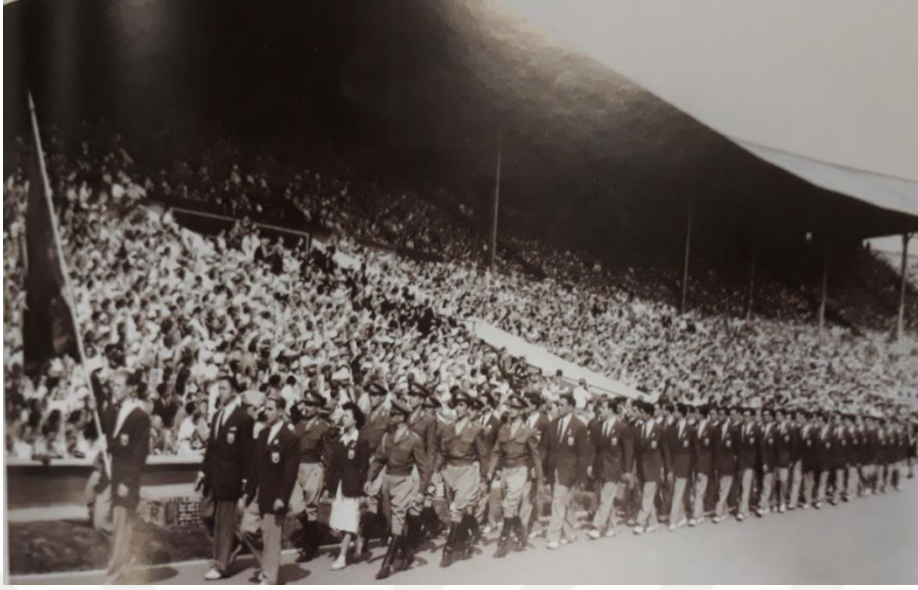
Resim 4: Açılış töreninde Türk kafilesi (İstanbuluoğlu, 2008: 193).