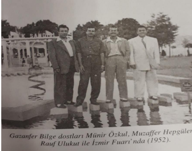
Londra Olimpiyat Şampiyonu Gazanfer Bilge ve arkadaşları (Atabeyođlu, 2015: 97).