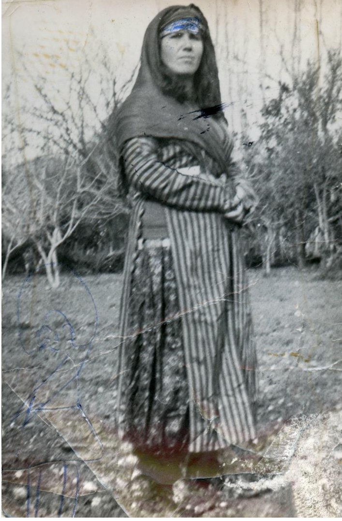
Resim 1.: Geleneksel 3 Etek kıyafetini giymiş bir Tahtacı kadını 79 .