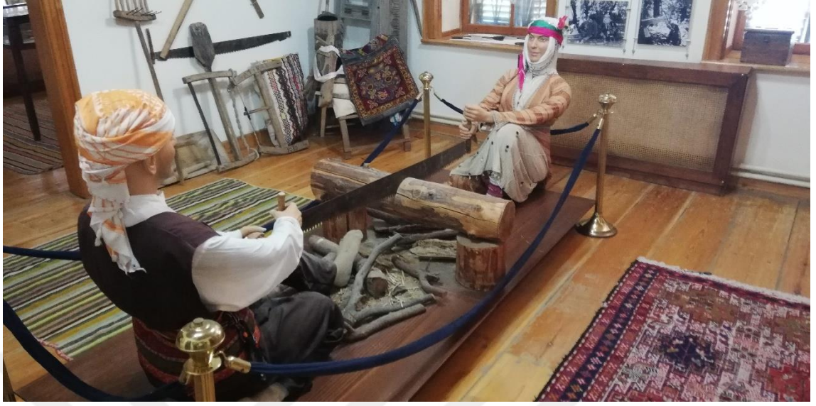
Ek-3: Tahtacıların tahta kesme işlemlerinden bir sahnenin canlandırılması- Narlidere Kültür Evi