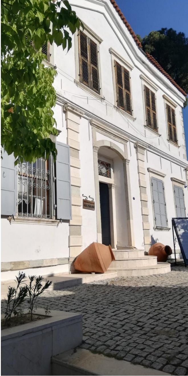
Ek-1: Yanyatır Ocağı Merkezi- Narlıdere. Yapılan restorasyondan sonra 'Narlıdere Kültür Evi' adıyla hizmet vermektedir (11.07.2019).