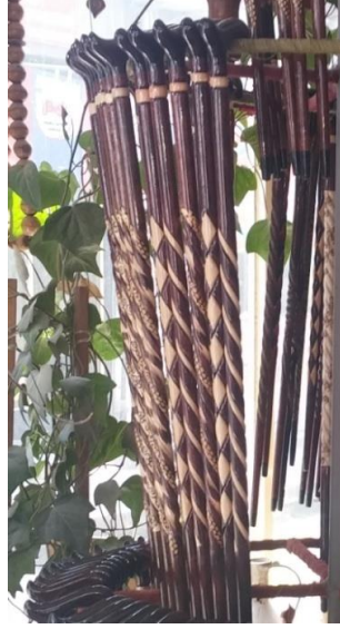
Şekil 33: Beyaz baklava desenli baston.