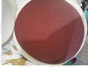
Şekil 16: Zımpara kâğıdı.