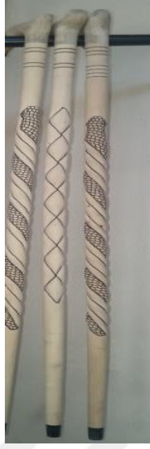
Şekil 35: Yakma Tekniği ile süslenmiş baston.