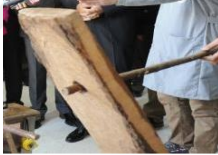
Şekil 3: Doğrultma-düzeltilme tahtası (URL-7, 2015).