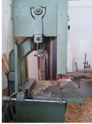
Şekil 5: Şerit testere.