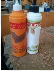
Şekil 21: Tutkal.