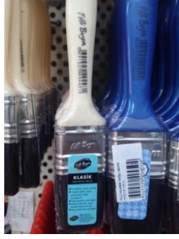
Şekil 7: Fırça