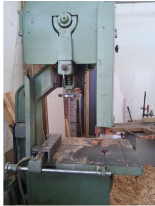
Şekil 27: Şerit Testere.

Doğrultma-düzeltilme yapılırken, baston tezgâhının ön tarafına yere ucu gelecek şekilde düzeltme tahtası dayanır. Doğrultma- düzeltme tahtasında düzelmiş dal, gözle yakın görülecek mesafeye kadar kaldırılarak, gözün birisi kapatılarak eğri yerler tespit edilir. Eğri olan yerler tespit edilerek tahtanın yerle temas eden yerine sol ayakla destek yapılarak tahtanın kayması engellenir. Sol ayak sağ ayaktan 40 cm ileride durmalı ve ustanın duruş açısı 30^{\circ} - 60^{\circ} arasında olmalıdır. Eğri olan dal sağ el arkada duracak şekilde sol el önde duracak şekilde uç kısmından tutularak düzeltme yapılır. Yapılan işlem 3-4 dakika sürer. Doğrultma- düzeltme işlemi ile düz hal alan dallar uçlarının kesimine gider. Devrek bastonu imalatındaki kızılçık dalının uçları el tornasında sabitlenirken düzgün şekil alsın diye şerit testere ile kesilir.