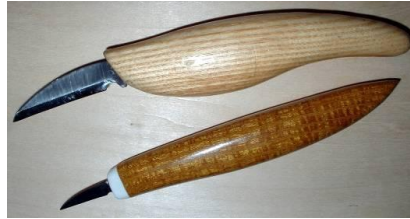
Şekil 14: Bıçak (Megep, 2013d).