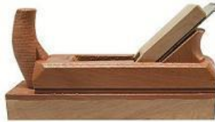
Şekil 4: Rende (URL-8, 2016).