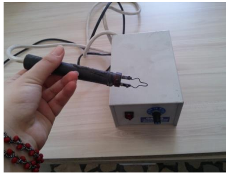
Şekil 17: Yakı kalemi.