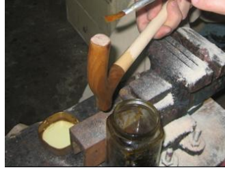
Şekil 22: Kezzap (Megep, 2013e).