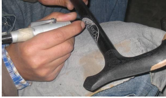
Şekil 8: Dişçi frezesi (Megep, 2013b).