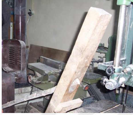
Şekil 26: Doğrultma- düzeltme tahtası (Megep, 2013h).

Fırınlanmış dallar kazandan çıkartılarak düzgün olmayan dalların tek tek düzeltme tahtasındaki deliğe sokularak tersine esnetme (eğik kısmın tersine) yapılarak istenilen şekilde düzeltilir ve soğutulması işlemi yapılır. Doğrultma-düzeltilme tahtası: Baston yapımı için kullanılan dalın uygun hale getirilmesinde kullanılan tahtadır.