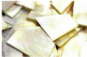
Şekil 23: Sedef (Megep, 2013f).