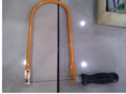
Şekil 10: Kıl testere.