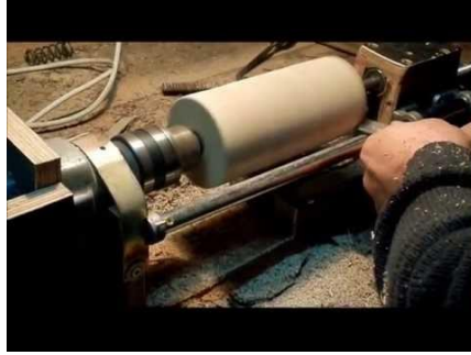
Şekil 6: El tornası.