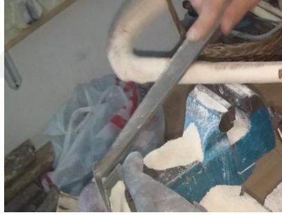
Şekil 11: Düz törpü.