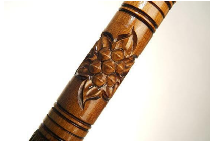
Şekil 32: Oyma tekniđi ağaç baston (Megep, 2014g).

Ağaç baston süslemede baston üzerine verilen desen, törpü ve eđe işlemleri bittikten sonra demir veya çelik keskin uça sahip kalem veya bıçaklarla oyularak yapılır.