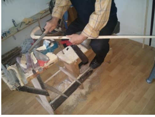
Şekil 2: Baston tezgâhı.