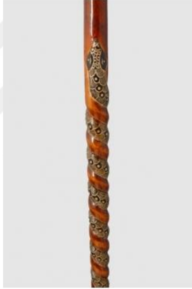
Şekil 34: Yılan desenli baston ( URL-10, 2016)