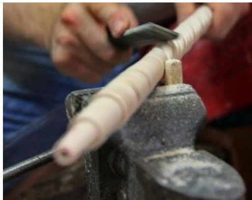
Şekil 9: Mengene (Megep, 2014b).