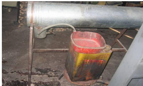
Şekil 1: Buhar kazanı (Megep, 2013a).