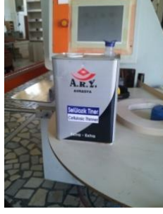
Şekil 20: Tiner.