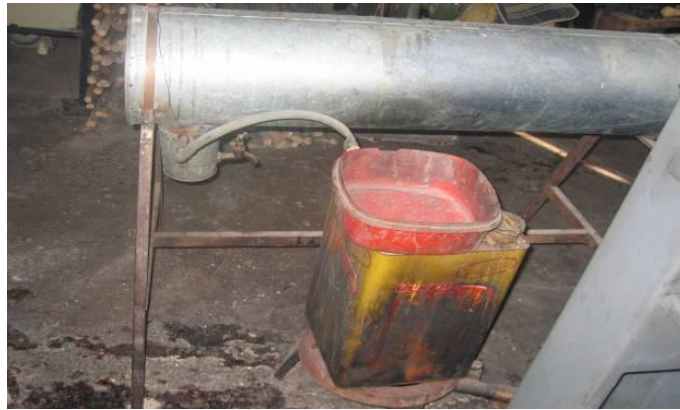
Şekil 25: Buhar Kazanı (Megep, 2013a).