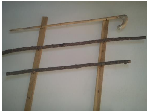
Şekil 36: Çoban Çentiği Bastonlar.

Baston süslemede çoban çentiğinin ayrı bir yeri vardır. Çoban çentiği kızılıçık ağacı üzerine çakı veya bıçak yardımıyla aynı doğrultuda çentik atılarak 2-3 yıl beklenir. Çünkü dallardaki çentikler bekleme süresinde ağaç yarası için kendini onararak çentiklerin üzerine kabuk bağlayarak bıçak yaraları kabarık desenler meydana getirerek değerli bir sanat haline gelir.