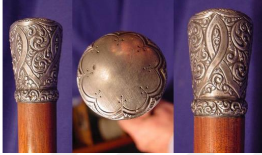
Şekil 31: Kalem işi baston sapları (Megep, 2014f).

Baston yapımında sap kısımlarını süslemek için kalem işi tekniđi genellikle gümüşten yapılmış saplarda kullanılır. Kalemkârlık tekniđini olarak da bilinir. Uzunluđu 6-8 cm olan, keskin uçlu, çelik kalemler kullanılmaktadır. Kalemlerle gümüş ve altın üzerine motifler ile kanallar açılarak yapılır.