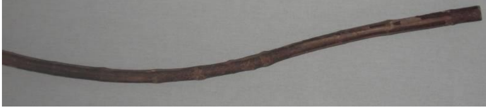
Şekil 24: Kızılcık dalı (Megep, 2013g).

Devrek bastonu yapımında kullanılan kızılıcık ağacının dalları genellikle çok düzgün olmaz. Devrek bastonu yapımında kullanılan kızılıcık ağacı 10-15 adet gruplar halinde buhar kazanına atılarak 180-240°C sıcaklığında yapılır. Kazandaki buhar hortum ile buhar kazanına geçmeye başlayarak kazanı doldurduğunda dalları ısıtma işlemi başlamaktadır. 30 dakika boyunca ısıtılan dalların lifleri yumuşayacak düzeye gelir.