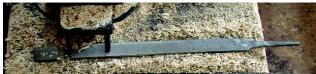
Şekil 15: Sistire (Megep, 2014c).