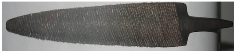
Şekil 12: Balıksırtı törpü (Megep, 2013c).