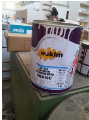
Şekil 19: Boya.