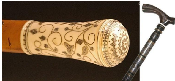
Şekil 30: Gümüş kakma baston sapı ve gümüş tel ile kakmalı baston (Megep, 2014e).

Baston imalatının kakma yöntemiyle sedef kullanılabileceği gibi gümüş kakma, gümüş tel ile kakma, pırlanta ve değerli taşlarda kullanılmaktadır.