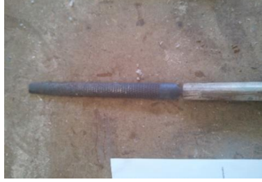
Şekil 13: Düz eęe.