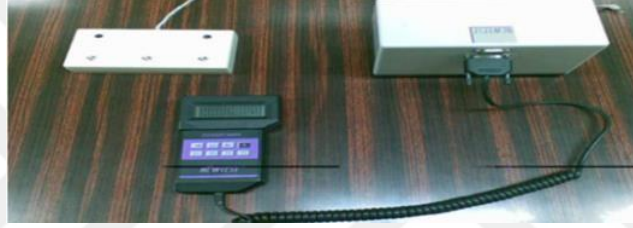
Şekil 5. Newtest 1000 reaksiyon ölçüm cihazı

Cihaz 1/1000 sn. cinsinden görsel ve işitsel reaksiyon zamanını kaydeder. Reaksiyon zamanı ile ilgili yapılan araştırmalar az da olsa çalışmalarla düzelmelerin, gelişmelerin meydana geldiğini göstermektedir. Reaksiyon zamanında düzelmeler ilk çalışmalarda daha çok meydana gelmekte daha sonra iyiden iyiye azalmaktadır. Hareket zamanı reaksiyon zamanına göre çalışmalarla çok daha fazla geliştirilme olanağına sahiptir. Hareket zamanının geliştirilmesi tekniğin düzenlenmesi gerekli kondisyon çalışmaları ile sağlanabilir. Her yaş grubu çalışma ile reaksiyon zamanında düzelme kaydedilebilir. Hentbolda reaksiyon zamanı tecrübe, konsantrasyon ve dikkat çalışmaları ile önemli boyutlarda etkilenebilir.