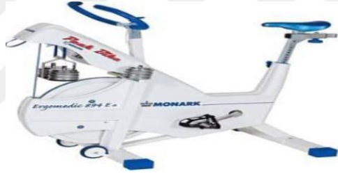
Şekil 4. Wingate testi bisiklet ergometresi

Test, bilgisayar düzeneğine bağlı Monark 834 model bisiklet ergometresi kullanılarak yapılmıştır. Test öncesinde denekler 140-150 atım/dk. Kalp atım hızında 5 dakika, 2 dakika da açma-germe egzersizlerinden oluşan standart bir ısınma yaptırılmıştır. Ergometrenin sele boyu her deneğin bacak boyuna göre ayarlanarak deneğin vücut ağırlığının kg'ı başına %7,5 gr yük ergometrenin kefesine yerleştirilmiştir. Denekler test süresince (30sn) ergometreden kalkmadan mümkün olan en hızlı şekilde ve test yöneticisi tarafından motive edilerek pedal çevirmişlerdir (Özkan, 2007).