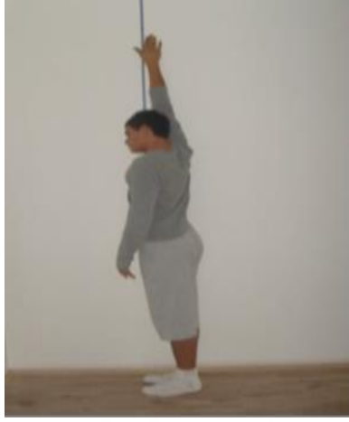
Şekil 6. Dikey sıçrama ölçümü

Bu uygulama ayakkabısız veya lastik ayakkabıyla yapıldı. Hız almak için duvardan 20-30 santimden uzakta durdurulması engellenmiştir. (Özkara, 2004, 24-28).