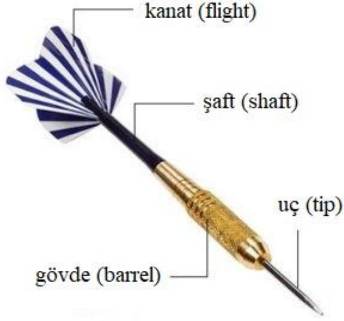
Şekil 2.12: Dart Okunun Bölümleri