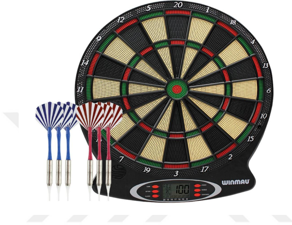
Şekil 2.6: Elektronik Dart Tahtası