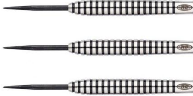
Şekil 2.11: U (Tip)