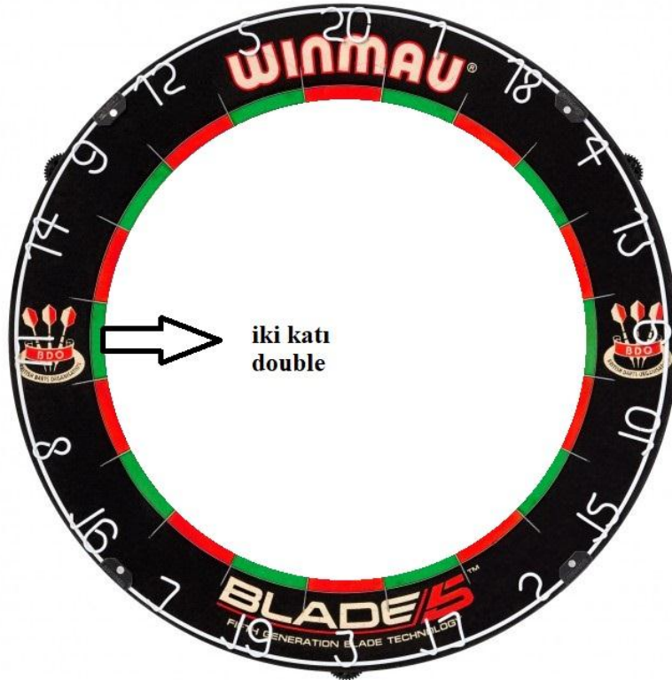
Şekil 2.2: Dart tahtası iki katı bölgesi (Double)