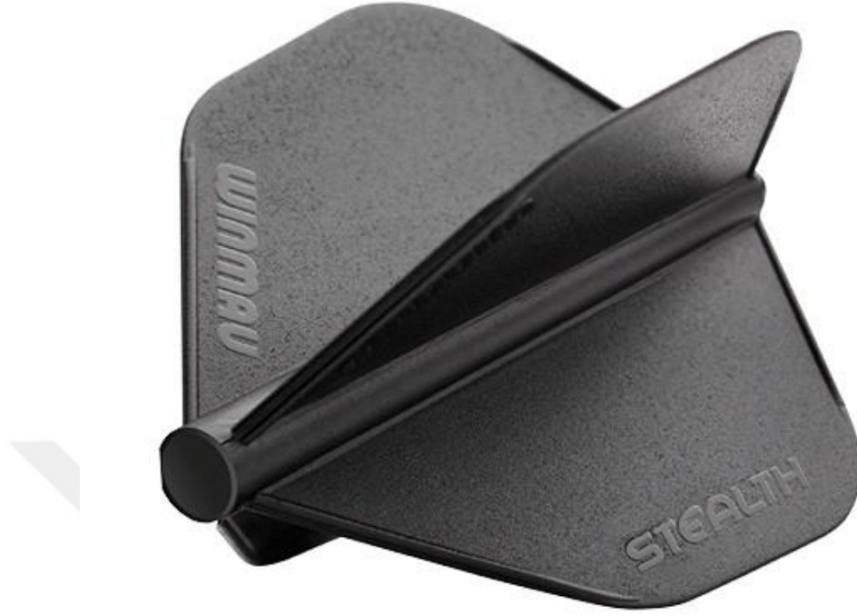
Şekil 2.8: Kanat (Flight)