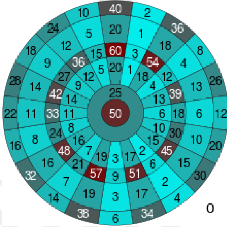
Şekil 2.7: Dart Puanlama Cetveli