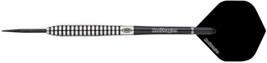
Şekil 2.13: Çelik uçlu dart