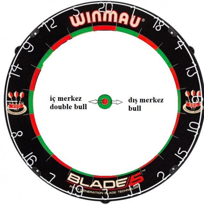
Şekil 2.4: Dart tahtası iç merkez bölgesi (doublebull) ve dış merkez bölgesi (bull)