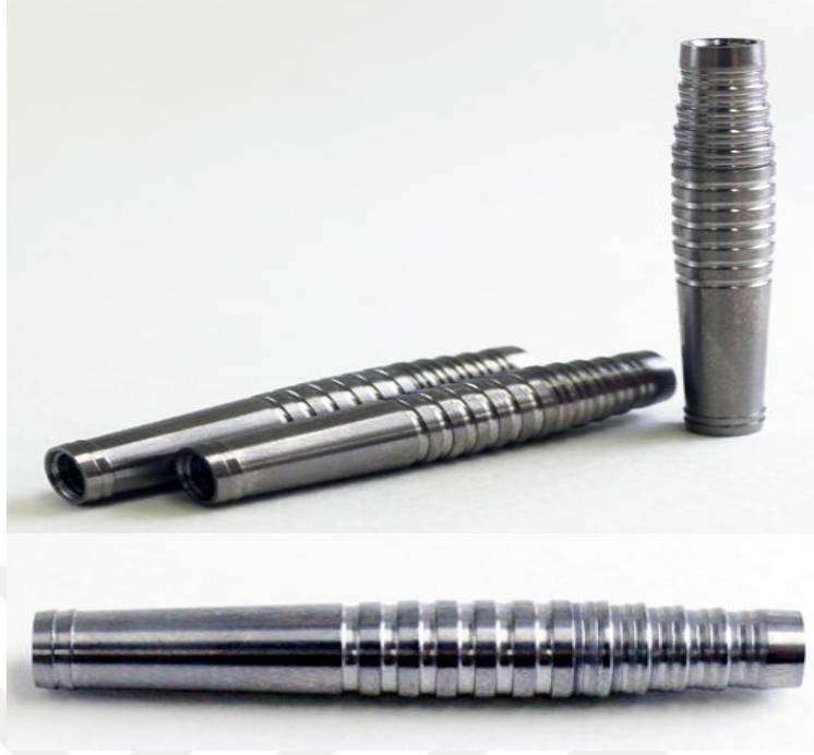
Şekil 2.10: Gvde (Barrel)