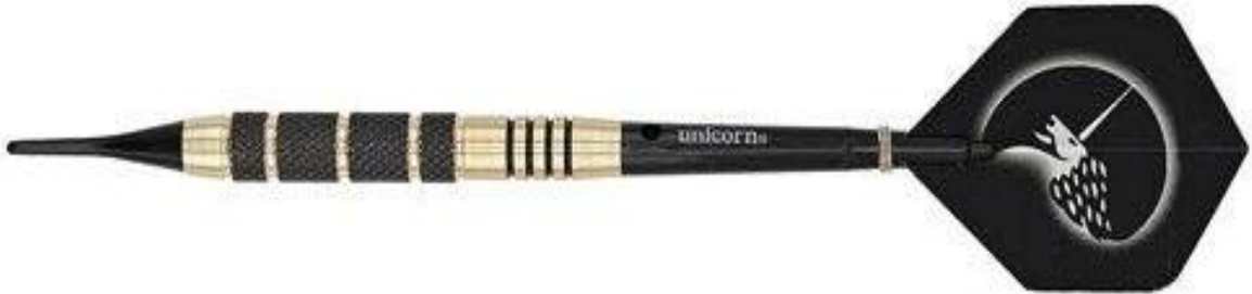
Şekil 2.14: Plastik uçlu dart