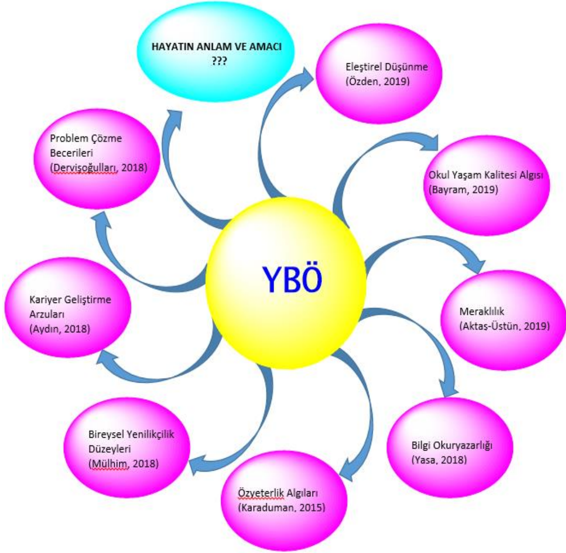
Şekil 1.1 Yaşam boyu öğrenme eğilimlerinin incelendiği yetişkinlerle yapılmış çalışmalar.

kariyer geliştirme arzusu, problem çözme becerileri arasındaki ilişkinin incelenmesi ancak hayatın anlam ve amacını sorgulama davranışının incelendiği bir çalışmaya rastlanmamış olması bu çalışmayı önemli kılmaktadır.