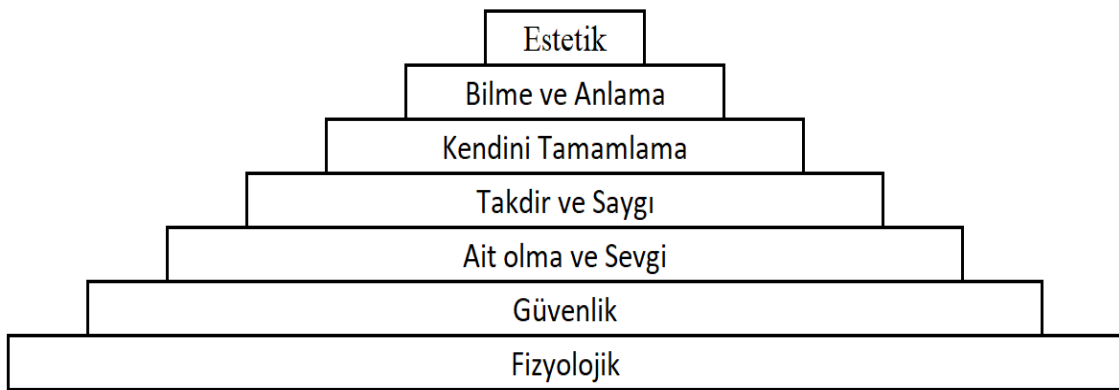
Şekil 2.2. Maslow’un Geliştirilmiş İhtiyaçlar Hiyerarşisi (Akt. İnceoğlu 2004, 115).