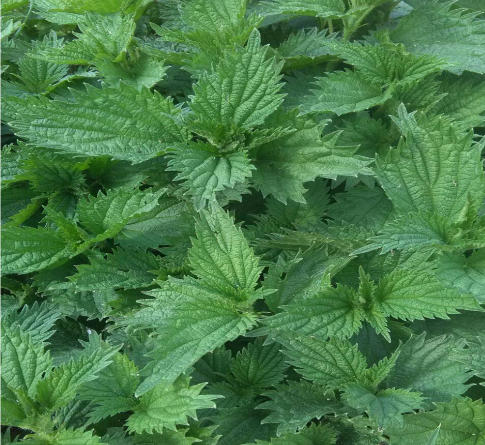
Fotoğraf 10.Çeşitli hastalıkların tedavisinde kullanılan ısırğan otu(zinçar).