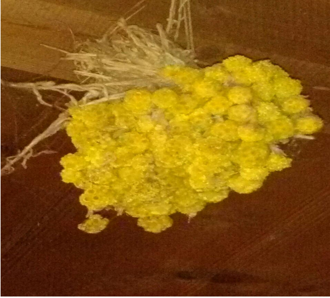
Fotoğraf 21. Çeşitli hastalıkların tedavisinde kullanılan sarı çiçek,süs amaçlı da kullanılır.