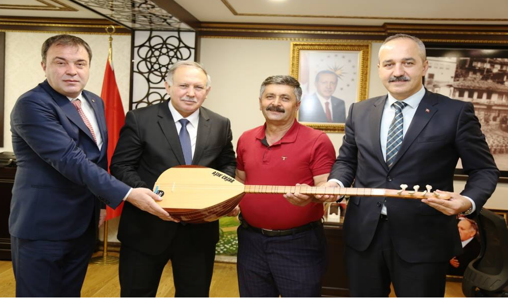
Artvin Valisi tarafından Coşarî'ye saz hediye edilirken.