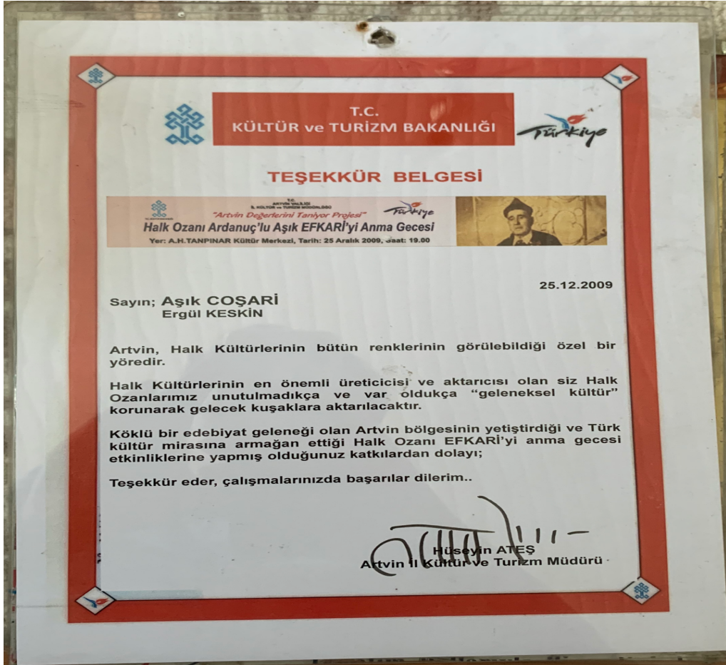
Artvin Kültür ve Turizm Müdürlüğü tarafından Coşarı'ya verilen Teşekkür Belgesi.