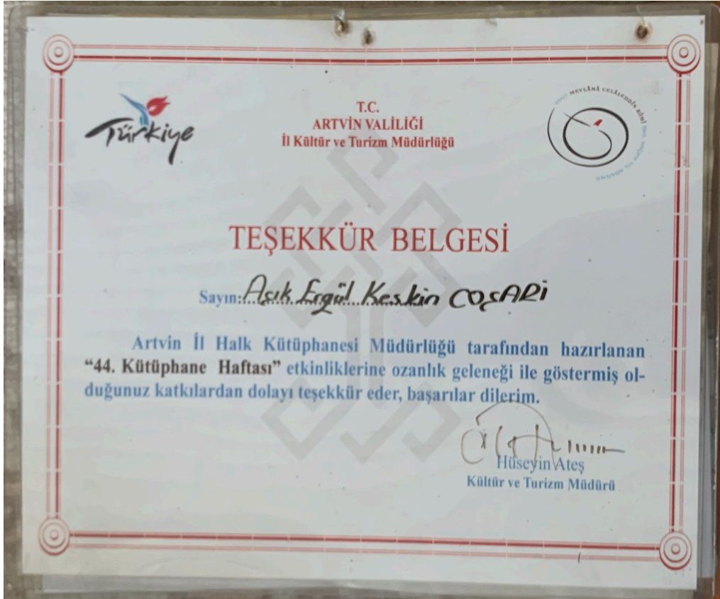
Artvin Kültür ve Turizm Müdürlüğü tarafında Coşarî'ye verilen Teşekkür Belgesi.