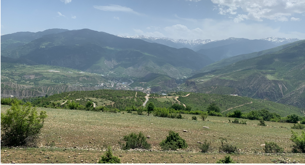
Coşarı'nın yaşadığı Yolüstü köyü.