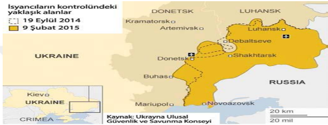
Harita 1: Rus yanlısı ayrılıkçıların denetimindeki bölgelere ait tarihsel farklılıklar 217

için, Ukrayna'nın egemenliğini deklare eden bu tür bir anlaşmaya destek vermesiyle kuşku üzerine çekmiştir ve böylelikle Rusya'nın ayrılıkçılara rahatlık sağlayacak bir zaman yaratmaya çalıştığına dair iddialar öne sürülmüştür 215 . İki anlaşma (Minsk I-II) arasında, alandaki gücünü toparlayan ayrılıkçılar aşağıdaki haritada görüldüğü gibi 19 Eylül 2014'teki hakim olduğu topraklara 9 Şubat 2015 itibarıyla yenilerini ekleme başarısı gösterebilmiştir 216 .