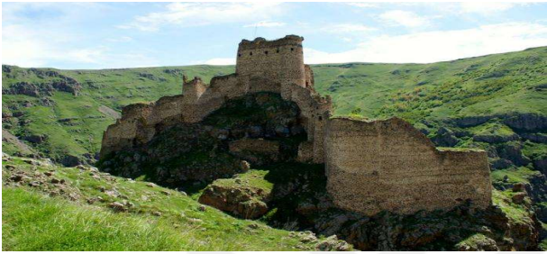
Çıldır, Şeytan Kalesi, Fotoğraf ( http://wikimapia.org/10135903/tr/%C5%99 Şeytan-Kalesi ).