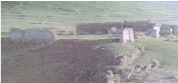
Hanak, Gırnav Kalesi, Fotoğraf ( Enver Konukçu).