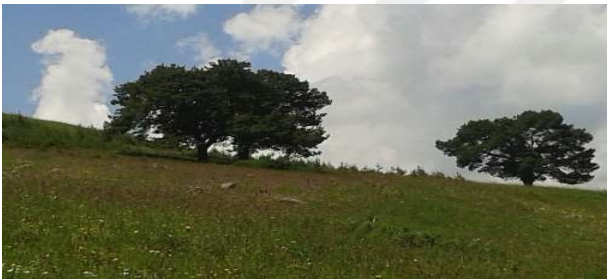
Sasadel Köyü, Üç Çam, Fotoğraf ( Dilek Sarıkaya).