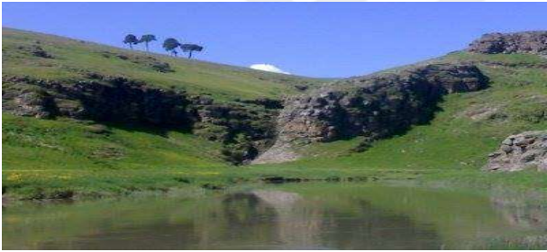
Göle, Darađacı, Fotoğraf (Facebook Bellitepe Köyü Sayfası).