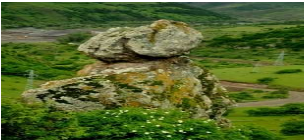
Posof, Nene Kaya, Fotoğraf (Kaan Gündoğdu).