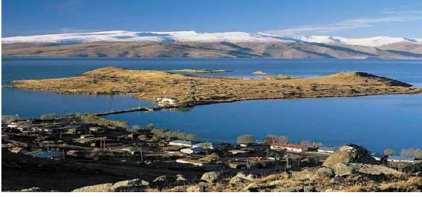
Çıldır Gölü, Fotoğraf ( http://www.ardahan.bel.tr/haber/6050/cildir-golu ).