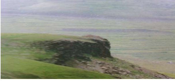
Damal, Büyük Ziyaret Tepesi, Fotoğraf ( Enver Konukçu).