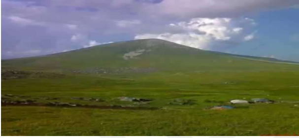
Ilgar Dağı Âşık Zülali Köyünün yaylasından görünümü.