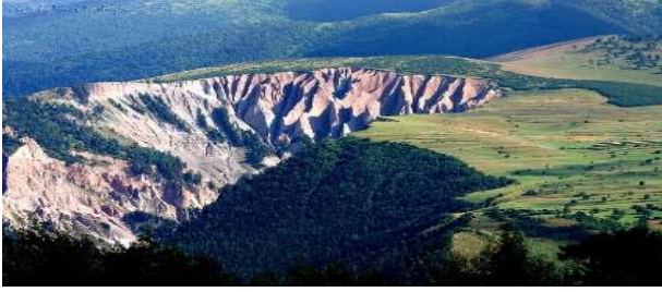
Posof, Hıram, Fotoğraf ( http://www.resimler.tv/resim4422.htm ).