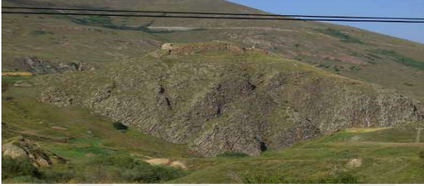
Posof, Kol Kalesi Ve Kol Şhrinin Olduđu Mevki, Fotoğraf ( http://gezilecekyerler.com/posof/ ).