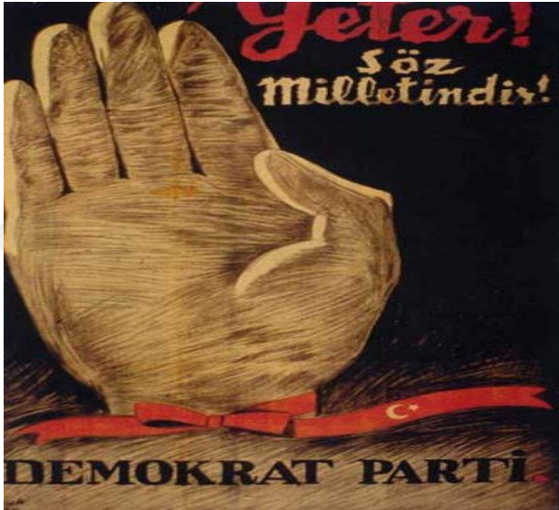
Şekil 1. Demokrat Parti Sloganı “Yeter Söz Milletindir!” (DYP, 2019)

demokratik ilkelere daha uygun olduğu kabul edilebilir. 1950 seçim kampanyaları 1946 seçimlerine kıyasla daha hareketli geçmiştir. Seçim sürecinde DP'nin sloganı “Yeter Söz Milletindir!” olmuştur. Slogandan da anlaşılacağı gibi DP kampanyasını kişi üzerinden değil millet üzerinden yürütmeyi amaçlamıştır (Karadeniz, 2018, s. 642).