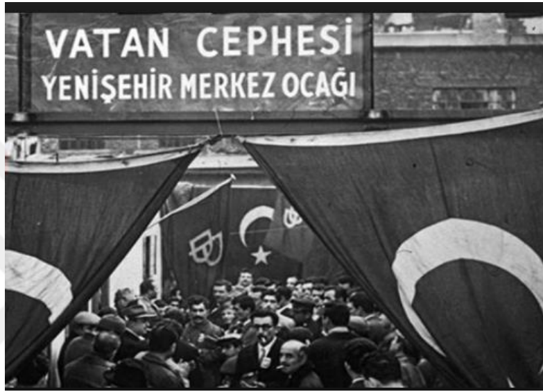
Şekil 4. Vatan Cephesi (Cumhuriyet Ansiklopedisi, 2002).

bu cepheye karşı bir Cephenin kurulmasının zaruri olduğunu belirtmiştir. Sonrasında DP'nin il, ilçe, bucak ve ocak örgütlenmelerinin Vatan Cephesinde birleşmesi için bildiride bulunmuştur. Esas amaçlanan ise muhalefet partilerine üye olan ya da herhangi bir parti ile ilişiği bulunmayan vatandaşları bu cephe aracılığıyla DP'ye kazandırabilmek olmuştur (Cumhuriyet Ansiklopedisi, 2002, s. 334).