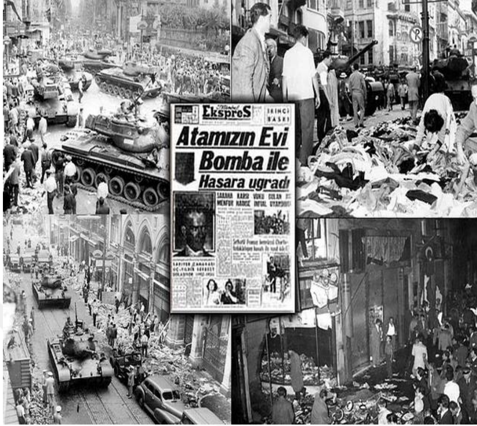
Şekil 2. 6/7 Eylül Olayları (Alper ve Uygun, 2019)

Hükümet ve devletin askeri kanadı, olayın gerçek faillerinin araştırmasını yapmak yerine komünistleri suçlama yoluna gitmiştir. 7 Eylül’de yayımlanmış olan bir hükümet bildirisinde olaylarla ilgili olarak “ dün gece İstanbul ve memleket esas itibariyle bir komünist tertip ve tahrike ve ağır bir darbeye maruz kalmıştır ” denilmiştir. Nitekim Aziz Nesin, Kemal Tahir, Hasan İzzettin Dinamo gibi solcular olaylardan sonra tutuklanmış ancak davaları beraat ile sonuçlanmıştır (Cumhuriyet Ansiklopedisi, 2002, s. 270).