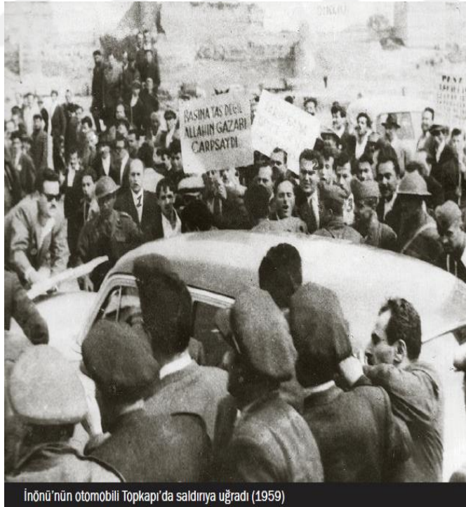
İnönü'nün otomobili Topkapı'da saldırıya uğradı (1959)

İsmet İnönü ve beraberindeki CHP'li grup, 4 Mayıs 1959'da İstanbul'a dönmüştür. Topkapı civarına gelen grup yaşanan olayların şokunu atlatamadan, aynı öfkeyle dolu başka bir grup tarafından saldırıya uğramıştır. Saldırgan grup İsmet İnönü'nün içerisinde bulunduğu aracın camlarını taşlamış, kapılarını açmaya çalışmıştır. Zaman geçtikçe tehlikeli olan bu saldırı ekibi, bir binbaşının yanındaki askerlerle müdahalesi sonunda dağıtılmıştır. Tesadüfen orada bulunan bu askerler olmasaydı muhalif parti lideri, gözü dönmüş ve kıskırtılmış bu grup tarafından öldürülebilirdi (Aslan, 2014, s. 102).