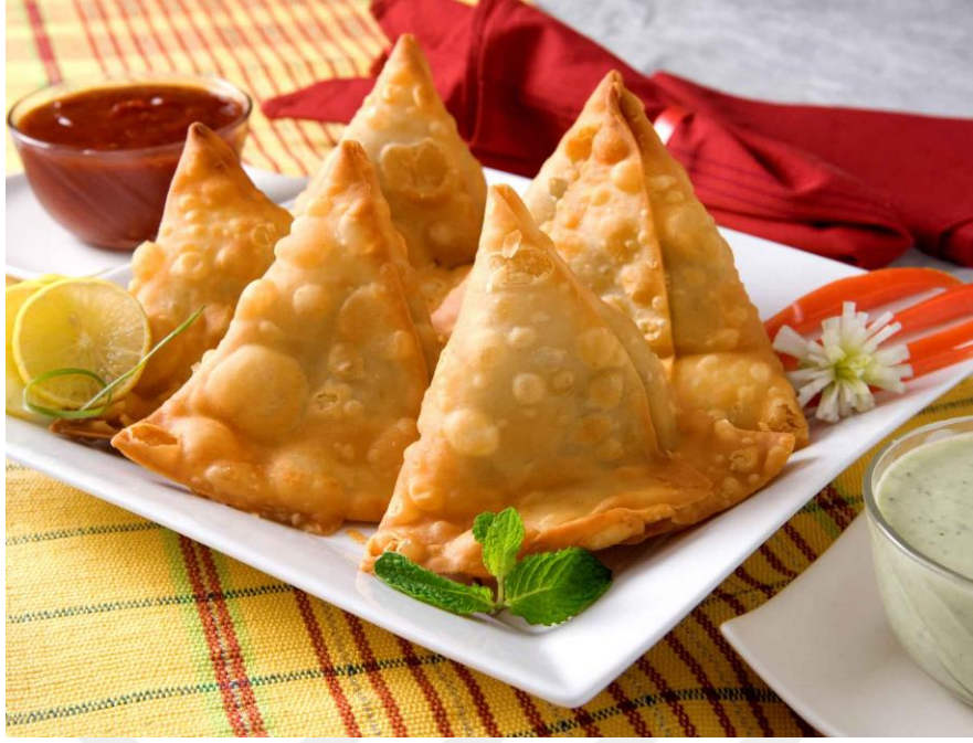
Görsel 2.6. Somali’de Yasaklanan Samosa Böreği

Dini altyapısı bulunmayan, ancak geçerli zaman diliminde belirli bir bölgeye hâkim dini örgütlenmeler tarafından mensup olunan dine aykırı olduğu iddia edilerek gerçekleştirilen bazı yasaklar da mevcuttur. Bu konuya en ilginç örnek ise “Samosa” isimli böreğin Somali’de yasaklanmasıdır. Hindistan, Güneydoğu Asya, Arap Yarımadası ve Akdeniz’de oldukça popüler bir hamur işi olan Samosa isimli aperatif yiyecek, Somali’de köktendinci Al-Shabab örgütü tarafından 2011 yılında yasaklanmıştır. El Kaide ile bağlantılı olan örgüt, ülkedeki şiddetli kıtlığa rağmen, yardım için ülkeye girmek isteyen gönüllü kişi ve kuruluşlara izin vermemiş, bu karardan birkaç gün sonra ise, hakaret içerdiği ve “aşırı Hristiyan” olduğu gerekçesi ile “Samosa” isimli böreğin tüketimini yasaklamıştır. Yasağın gerekçesi olarak, “üçgen” şeklindeki Samosa böreğinin, “baba, oğul ve kutsal ruh” şeklinde ifade edilen teslis üçlemesini simgelediği gösterilmiştir. (Maclean, 2011)