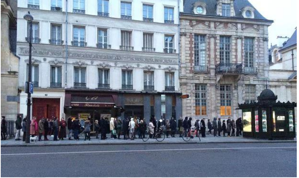
Görsel 2.3. Saldırı sonrası Charlie Hebdo'nun ilk sayısını bekleyenler