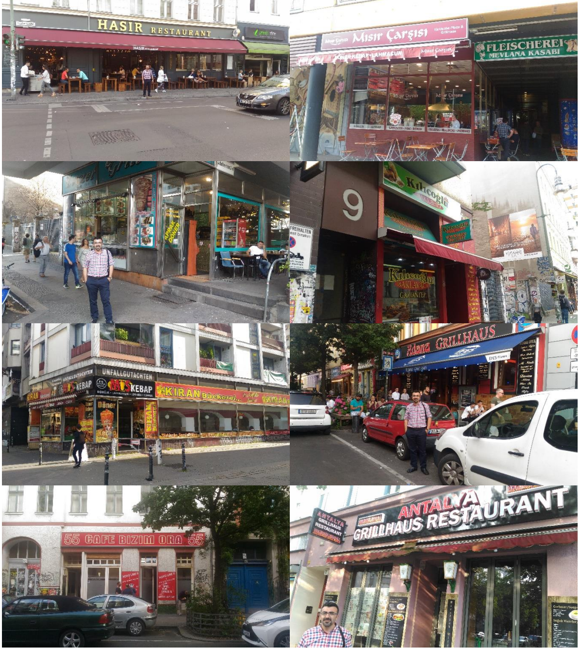
Görsel 3.2. Kreuzberg’de Bulunan Türk Yiyecek İçecek İşletmelerinden Bazıları (04.07.2017)