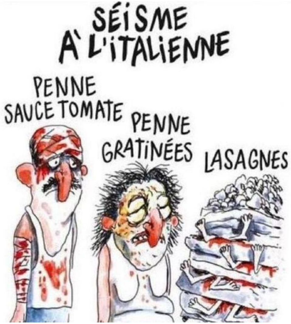
Görsel 2.2. Deprem sonrası Charlie Hebdo’da yayımlanan karikatür

2015 yılının Ocak ayındaki saldırılar sonrası, Charlie Hebdo’nun ilk çıkan sayısı tarihi bir rekor kırarak “beş milyon” adet satılmıştır . Başlangıçta üç milyon adet basılan bu sayı, dergilerin piyasada adeta kapış kapış satılması üzerine iki milyon ek baskı yapmıştır. Bu tirajın Charlie Hebdo’ya destek amacıyla gerçekleştiği ifade edilmiştir. Sabahın erken saatlerinde gazete bayileri önünde dergiyi alabilmek için kuyruklar oluşmuştur. (Görsel 2.3.) Derginin satış fiyatı 3 Euro’dur. Dolayısıyla 15 Milyon Euro tiraj geliri elde eden dergi sadece bu sayısı ile çok önemli bir maddi kaynak elde etmiştir. (The Guardian, 2015)