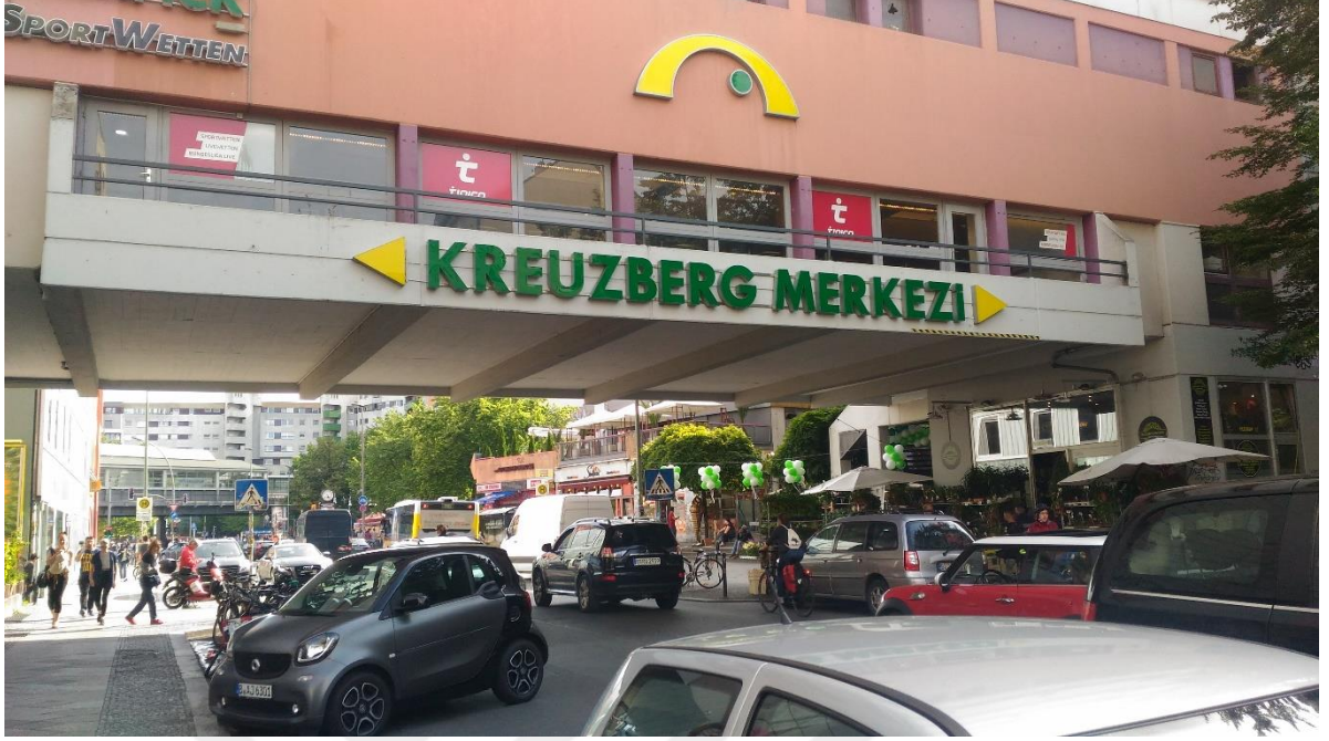
Görsel 3.1. Kreuzberg Semt Merkezi (03.07.2017)