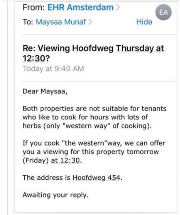
Görsel 2.1. Maysaa Munaf'a Emlak Şirketinden gelen mesaj