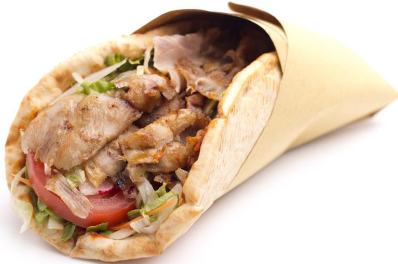
Görsel: 2.7. Moskova’da Yasaklanması Planlanan Shawarma