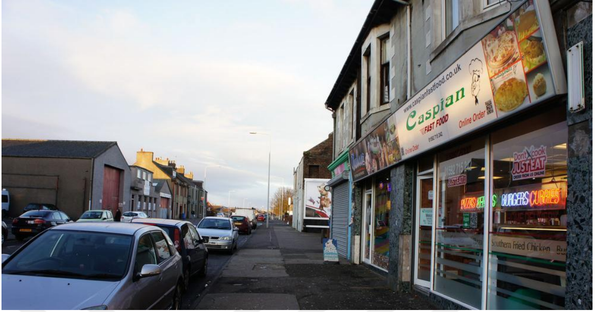
Görsel 2.4. Linç Girişiminin Yaşandığı Restoran (Fife, Methil, İskoçya)