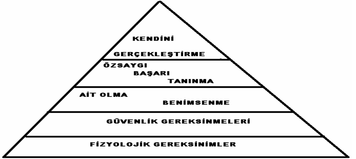
Őekil 1: Maslow'un İhtiyaçlar Piramiti (Oktaylar,2005,s. 90).

Bu gereksinimler aşamalı olarak yükselmektedir. Bir gereksim doyurulmadan üst sırada bulunan gereksinim ortaya çıkamaz (Maslow, 1970, s.86). Ancak bu demek değildir ki insanlar şeref, haysiyet, başarı, korunma gibi nedenlerden dolayı daha temel gereksinimlerden vazgeçsinler (Selçuk, 2001). Maslow' a göre her insanda dıştan gözlenmese bile yüzeyin hemen altında saldırganlık, kırgınlık, yıkıcı istekler ve buna benzer duygular bulunmaktadır. Saldırganlık, yolunu açmak için yol üstündeki bir nesneyi elinin tersi ile itivermek gibi rastlantısal olarak ortaya çıkabildiği gibi özde bir savunma davranışı olarak da ortaya çıkabilir. Yalnızca saldırının zevkini yaşamak için saldırının yerinde bulunmak yerine, kendini korumaya yönelik bir karşı saldırı söz konusu olabilir. Otoriter hayat görüşü, hayat içinde karşılaşılan tehditlere tepki vermeye çalışılması gibi çeşitli etmenlerde insanlarda saldırgan davranışların ortaya çıkmasını