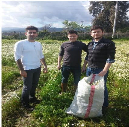
Şekil 3.8. Hasat işleminden genel bir görünüm