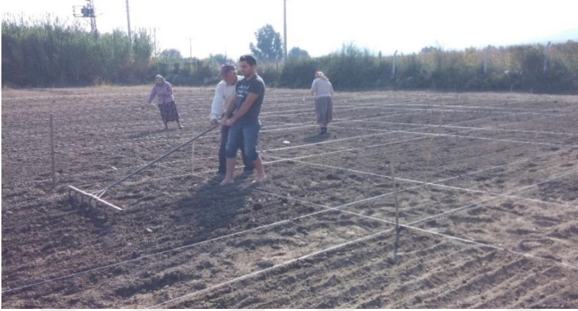
Şekil 3.3. Markör yardımıyla çizilerin açılması

Araziye tohum ekimleri sırasıyla 15.10.2014, 01.11.2014, 15.11.2014, 01.12.2014 ve 15.12.2014 tarihlerinde yapılmıştır. Her parsel markör yardımıyla 30 cm sıra arası olacak şekilde 8 sıra açılmış ve ekimler açılan bu çizilere elle gerçekleştirilmiştir (Şekil 3.3. ve Şekil 3.4.).