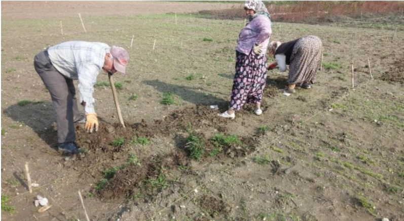
Şekil 3.6. Elle yabancı ot mücadelesi

Ekim ve Kasım aylarının başlarında hava sıcaklığının uygun çimlenme ve büyüme koşulları sağlamasıyla 1. Ekim Zamanındaki bitkiler 8-9 cm boya, 2. Ekim Zamanındaki bitkiler 3-4 cm boya, 3.,4. ve 5. Ekim Zamanındaki tohumlarda da çimlenmeler olmuş halde bitkiler kışa girmiştir. Kış boyunca, havalar tekrar ısınana kadar bitkilerdeki büyümeler sabit kalmıştır. Havaların Mart ayından itibaren tekrar ısınmasıyla bitkilerin gelişimlerine devam ettiği görülmüştür.