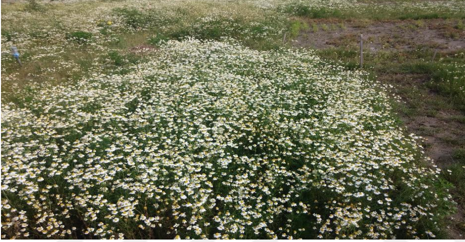
Şekil 3.7 Hasat öncesi (5. ve 6.) devrede olan Matricaria recutita L. parseli

Hasatlar beyaz dil çiçeklerinin tamamen açılmış olduğu 5. ve 6. dönemde yapılmıştır. Parsellerde çiçeklerin %80'ni bu devreye geldiğinde o parselde hasat yapılmıştır (Şekil 3.7.).