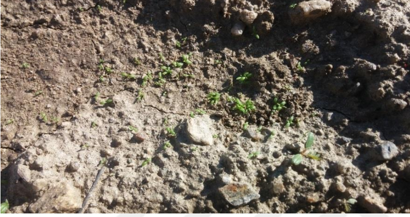
Şekil 3.5. Mayıs papatyası ( Matricaria recutita L.)'nin çimlenmesi

Matricaria recutita L. ekimleri yapılırken, tohumları çok küçük olduğu için can suyu önce verilip, ıslak toprağın üzerine tohumlar bırakılmış ve hafifçe bastırılarak ekim işlemi yapılmıştır.