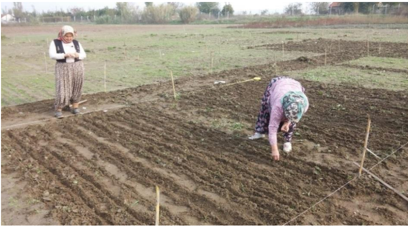
Şekil 3.4. Mayıs papatyası ( Matricaria recutita L.)'nin araziye ekimi

Ekim dekara 832 gram tohumluk hesabı ile gerçekleştirilmiştir. Dekara 6 kg N'lu gübre atılmıştır. Azotlu gübrenin yarısı ekim öncesi, diğer yarısı ise ekimden yaklaşık 1 ay sonra uygulanmıştır. P_2O_5 ekimle birlikte 4 kg/da olarak verilmiştir. Sulama yapılmamış, sulama ihtiyacı yağışlarla karşılanmıştır. Yabancı ot mücadelesi elle ve küçük çapa yardımıyla bitkilere zarar verilmeden yapılmıştır (Şekil 3.6.).