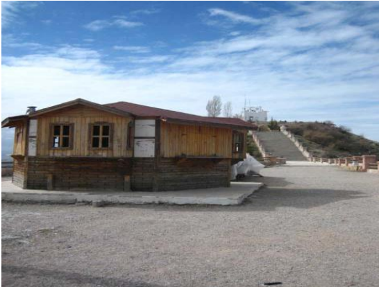
Şekil 5: Hıdırlık Tepesi- Takano (2008)