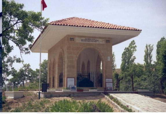
Şekil 2: Gazi Gündüzalp Türbesi- Çelik (2008)