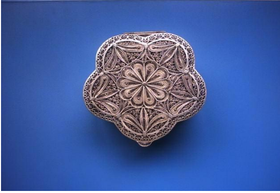
Şekil 3: Telkâri Sanatı- Çelik (2008)