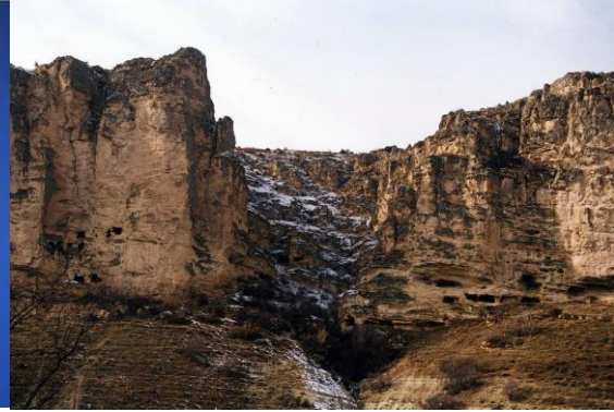
Şekil4: İnözü Vadisi- Çelik (2008)