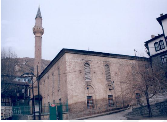
Şekil 1: Alaaddin Camii- Çelik (2008)