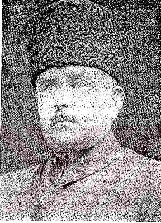
KÂZIM KARABEKİR PAŞA