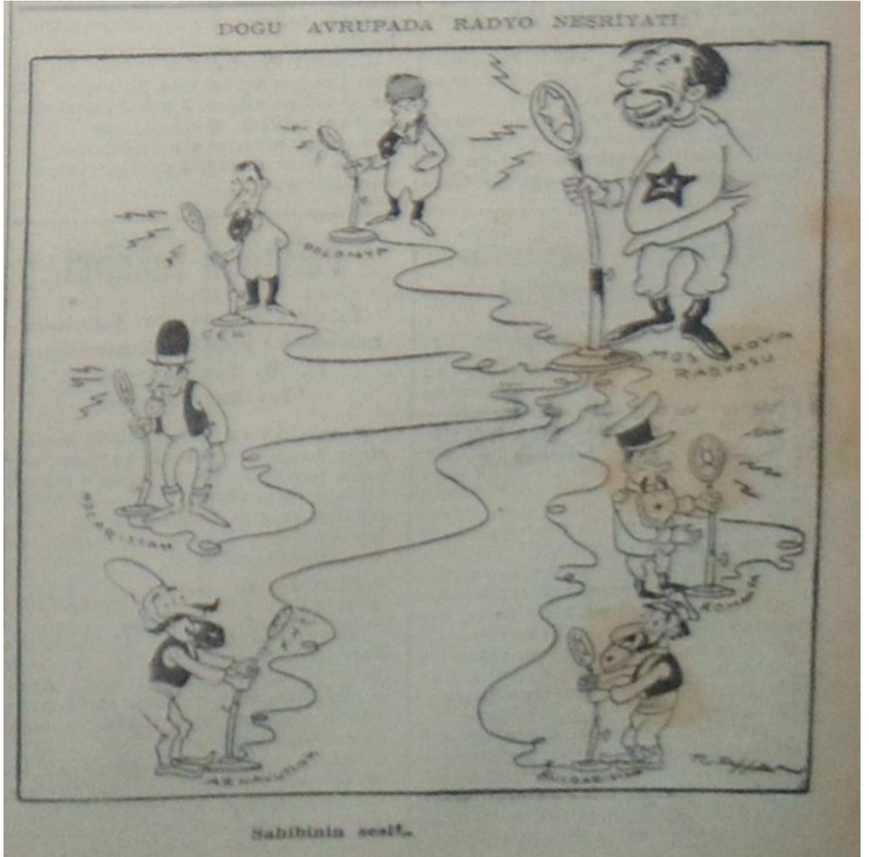
Moskova Radyosuyla aynı çizgide yayın yapan Polonya, Çek, Macaristan, Arnavutluk, Bulgaristan ve Romanya devlet radyoları ( Yeni İstanbul 18 Mart 1950, s.1)