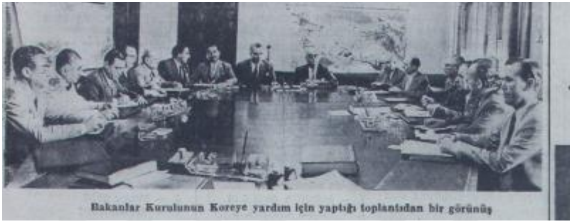
31 Temmuz 1950