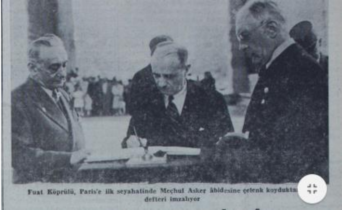
Fuat Köprülü, Paris'e ilk seyahatinde Meşûr Asker âbidesine çetenk koyduktan defteri imzalıyor