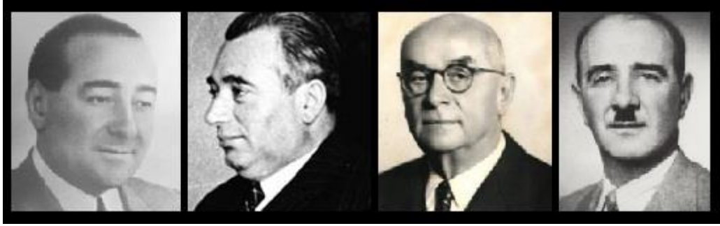
Dörtlü Takrir (Adnan Menderes, Refik Koraltan, Celal Bayar, Fuad Köprülü)