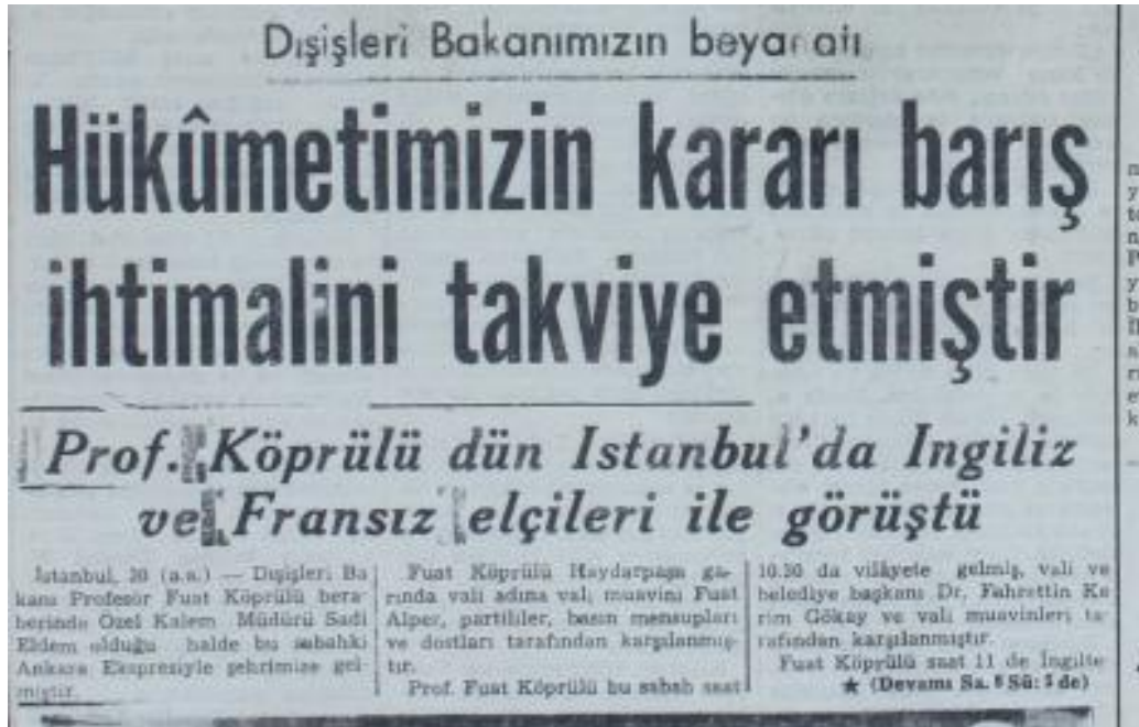
31 Temmuz 1950 (Zafer Gazetesi)