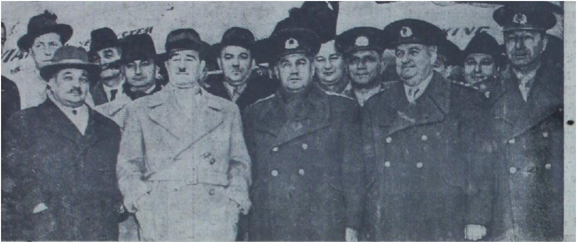
Dün Lizbon'a hareket eden Dışişleri Bakanı Fuat Köprülü ve refakatindeki heyet üyeleri Yesilköyde uğurlayıcılar arasında