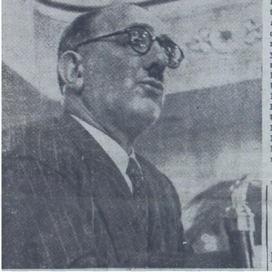
18 Şubat 1952