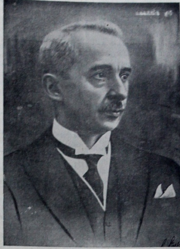
Yeni Reisicumhurumuz İSMET İNÖNÜ