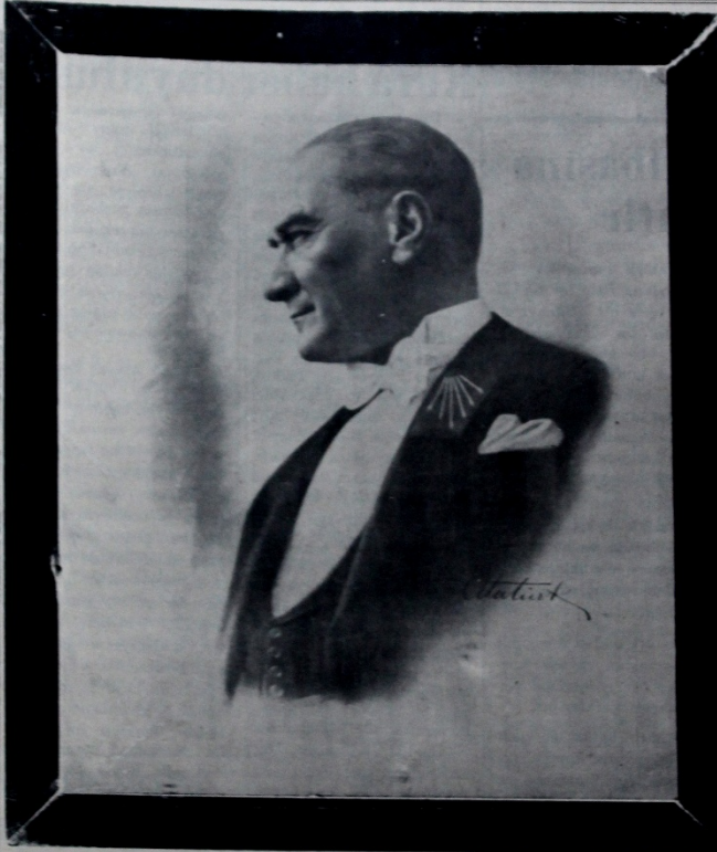
Türkü kurtaran, Cumhuriyeti ve İstiklâli yaratan, milletin kalbinde ebediyen yaşayacak olan millî kahraman, büyük asker, ulu önder ATATÜRK

Hükümetimiz içinde bu hodogumuz bu mübim anda buçüne kadar olduğu gibi dikkatle vazife başındadır . Müesses olan nizamı ve vaziyeti idame hususunda büyük Türk milletinin Hükümetiyle tek vücut olarak