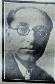
Dış siyasetimizi büyük bir dirayet ve kiyasetle idare eden Dr. ARAS

İstanbul 28 (A. A.) Hatay işinin memleket lehine bitmesinden mütebassıs olan Atatürk İsmet İnönü'ne gönderdiği telgrafla muvaffakiyetinden Hükümeti tebrik etmiştir. Atatürk telgrafla Cenevrede Dr. Arasa memnuniyetini bildirmiştir.