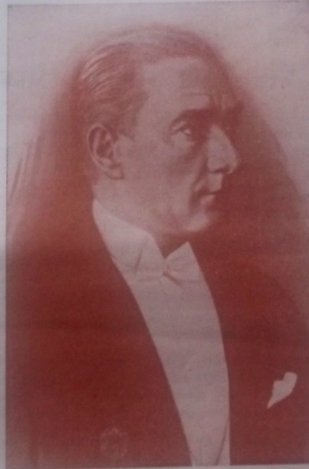
C. H. Partisi Önderi Kamal Atatürk

Bu gödiçe, bu bitişe dayanamıyanlar ve baştakile rin Türk ulusuna ne büyük bir kötülük yapmış olduklarını anlayanlar çıktı. Türk ulusunun büyüğüne saygı beslemek gibi tarihsel olan duygusundan, bu kadar kötü yöntemde yararlanmak isteyenlerin amacını meydana çıkararak Türk ulusunu uyan dermak ve ona korkunç gerçekleri anlatmak (Sona 2 sayı sahifede)