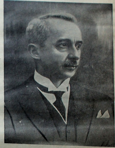
Ulusal utuklarımızı şüel alanlarda olduğu gibi siyasi alanlarda da kazanmış büyük Başbakan İSMET İNÖNÜ