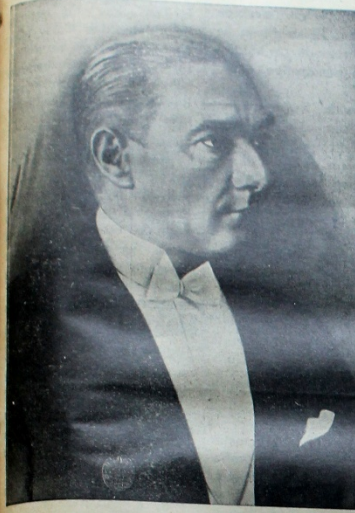
Her ulusal başarımızda, baş gücümüz olan büyük şef ATATÜRK