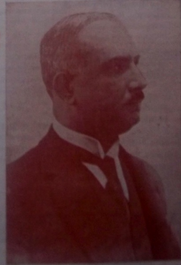
C. H. Partisi Genel Başkanı Mustafa Kemal Atatürk

B-6: Cumhuriyet Halk Partisi 4. Büyük Kurultayının açılması.