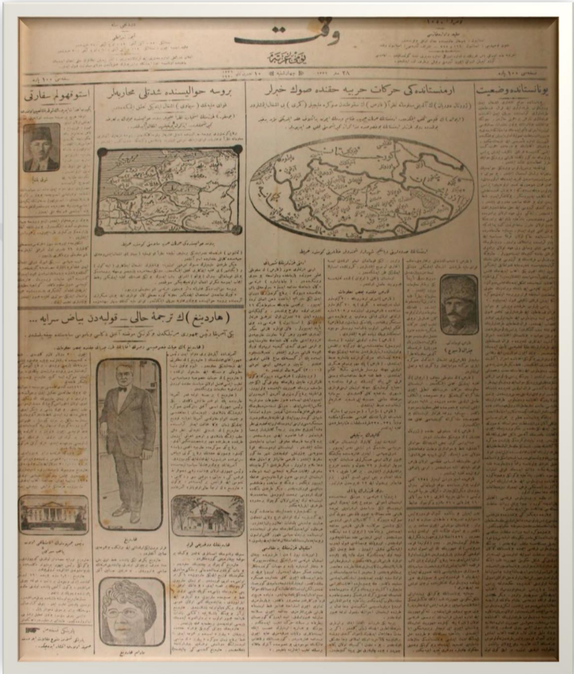
Vakit gazetesinde Millî Mücadele cepheleri hakkında haberler genellikle haritalı verilmiştir.

Vakit, 1 Teşrin-i sâni (Kasım) 1920 (1336), Numara: 1050, s.1.