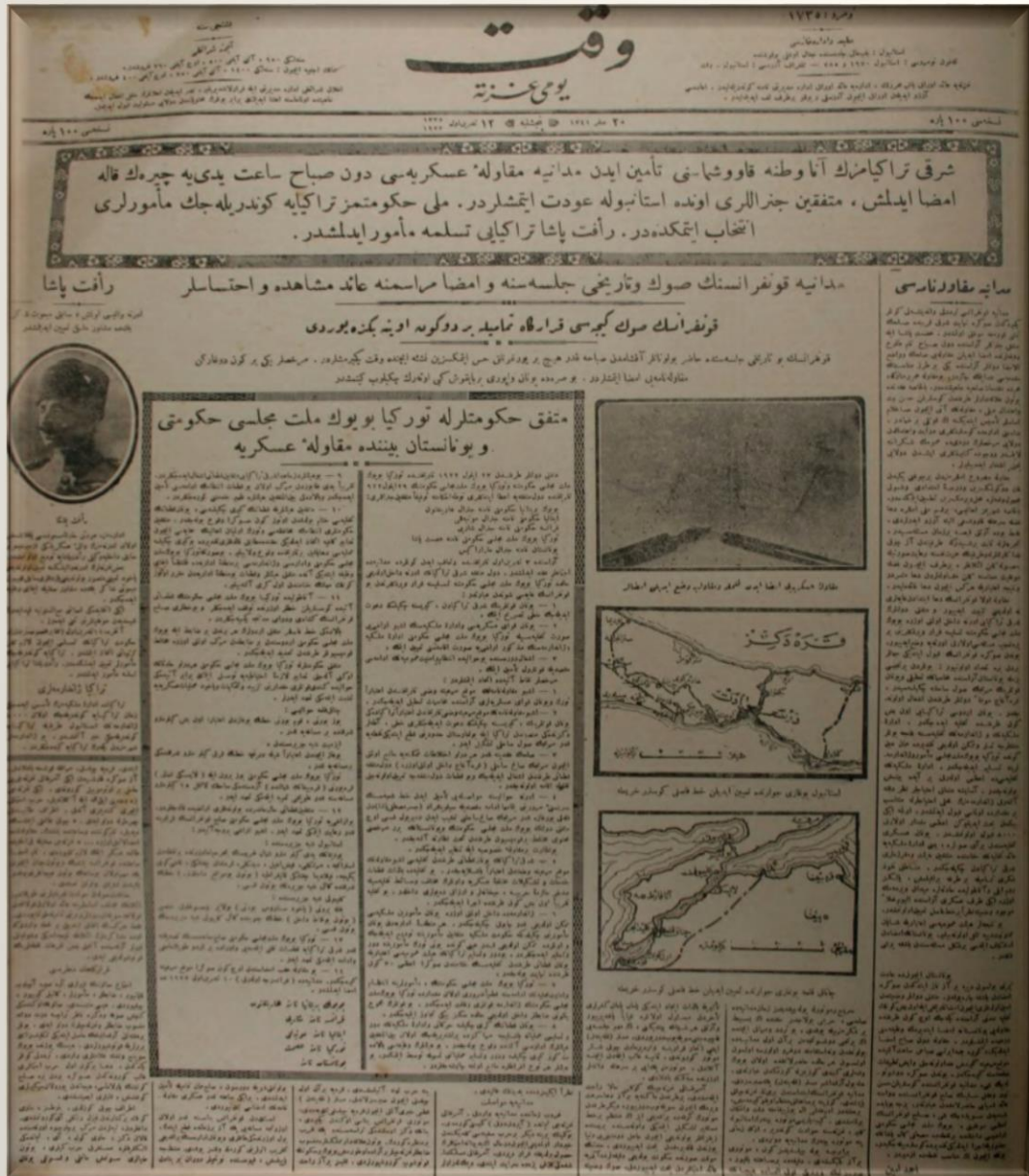
Vakit gazetesinde Mudanya Mütarekesi'nin (11 Ekim 1922) resmî metni. Vakit, 12 Teşrin-i evvel (Ekim) 1922 (1338), Numara 1735, s 1.