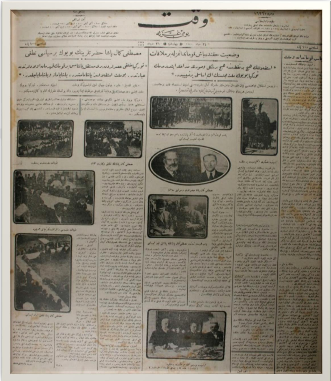
Vakit gazetesı Başmuharriri Ahmed Emin YALMAN'ın Mustafa Kemal Paşa ile yaptıđı mülakat haberi.

Vakit, 21 Haziran 1922 (1338), Numara: 1626, s.1.