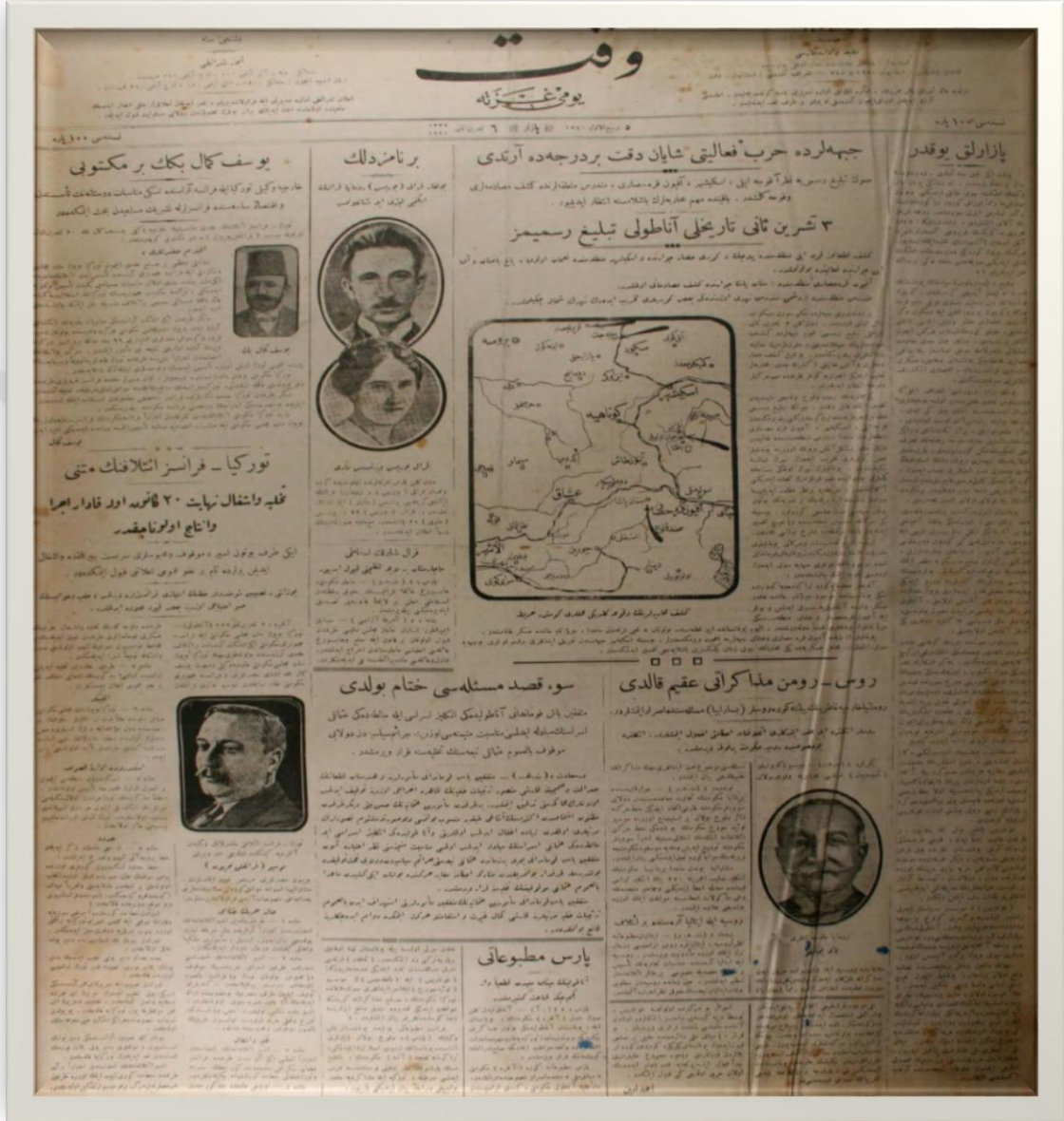
Vakit gazetesinde TBMM Hükümeti ile Fransa Hükümeti arasında 20 Ekim 1921’de imzalanan Ankara Antlaşması’nın Resmî Metni. Vakit , 6 Teşrîn-i sâni (Kasım) 1921 (1337), Numara 1404, s 1-2..