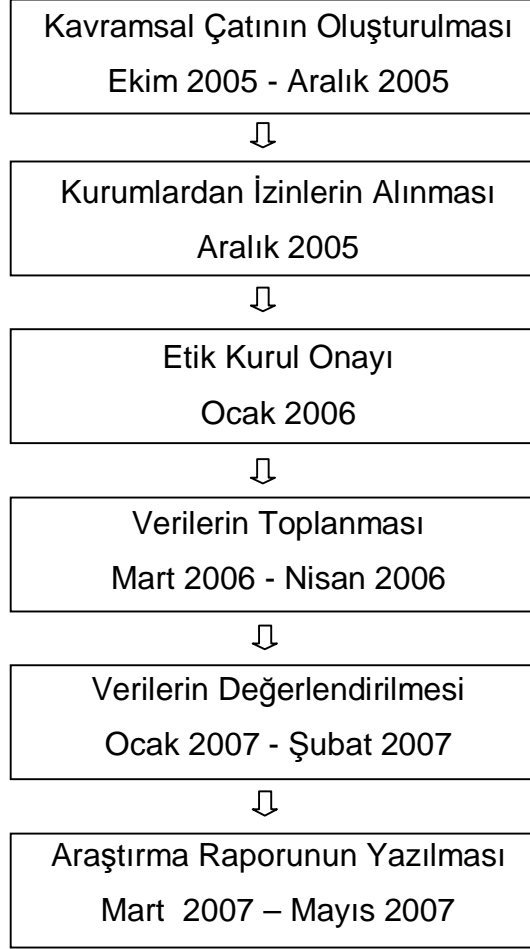
Şekil 3. Araştırmanın Adımları ve Zamanlaması