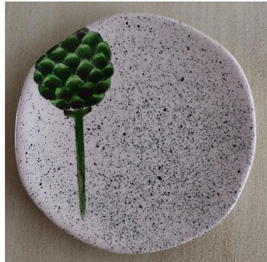
Fotoğraf 25 - Yemek grubu - Orta boy servis tabağı, 20x1.5 cm / Küçük boy servis tabağı, 12.5x1.5 cm