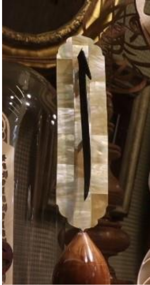
Fotoğraf 6 - Sedef taşından yapılmış dekoratif obje, Naht-Sedef atölyesi (Başdurak - Kemeraltı Turistik El Sanatları Çarşısı, Fotoğraf: E. Sultan Çeşmeci, 2019)

Özellikle hediyelik eşya endüstrisi içinde çok geniş kitlelere yayılmış, taşa olan ilgi farklı kullanım alanları turizm sektörünün vazgeçilmez tercihlerinden biri olmuştur. Bugün, çoğu turistik yerde envai çeşit taş ile yapılmış dekoratif ürünlere, aksesuarlara rastlamak mümkündür.