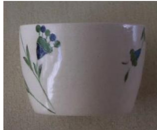
Fotoğraf 21 - Kahvaltı grubu - Bardak, 6x7.5 cm / Sosluk, 5.5x4 cm