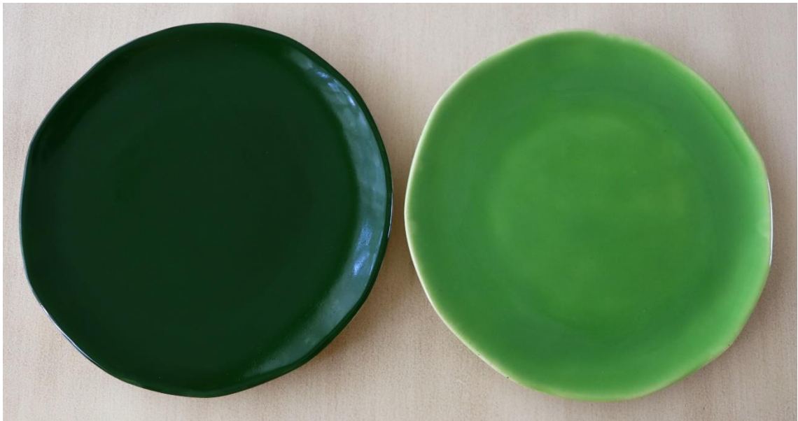
Fotoğraf 31 - Yemek grubu - Sosluklar, 12.5 x 1.5 cm