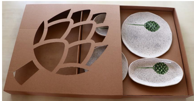
Fotoğraf 35 - Uygulama işleri için hazırlanmış ambalajlar