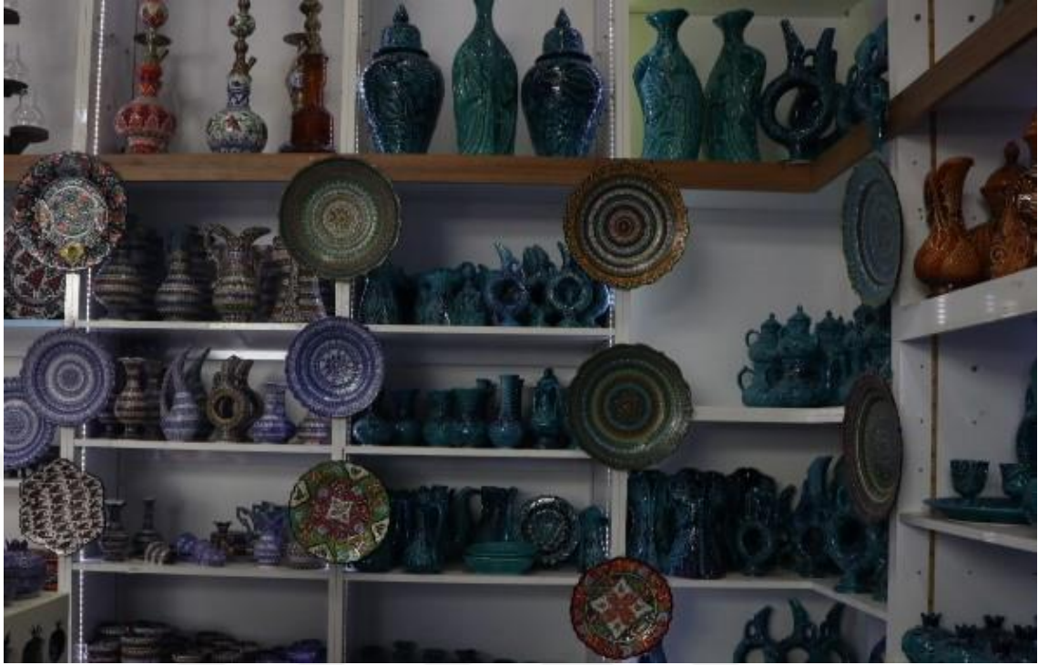
Fotoğraf 16 - Günümüzde üretilen çini ürünler (Kemeraltı, Fotoğraf: E.Sultan Çeşmeci, 2019)

Ancak üretim bakımında popülasyonu elinde tutan bazı üreticilerin günümüz sanat anlayışını özümseyemedikleri gerçeği her ne kadar var ise de yine de yargılanmamalıdır. Çünkü gelinen bu noktada eksikler, yalnızca üreticilerin takındığı tavırdan kaynaklanmamaktadır. Yaşanılan bu durumun uzantıları oldukça detaylıdır.