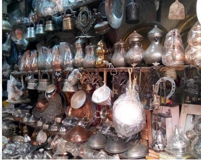
Fotoğraf 3 - Bakır kullanım eşyaları, Yıldırım Bakırcılık (Kemeraltı, Web)

devam eden kültürel kimliklerini koruma geleneğinden ileri gelmektedir. Devam eden bu gelenek, bu kültürün hala canlı tutulmaya çalışıldığının bir göstergesidir. Çağın değişen koşullarına rağmen bu kültürel dokular günümüzde hala özelliğini yitirmemiştir. Ancak tasarım anlayışında farklılıklar görülmektedir. Özellikle turistik bölgelerin yoğun olduğu yerlerde tasarımlarda farklılıklar daha fazla ön plana çıkmaktadır.