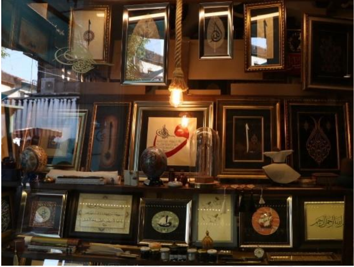
Fotoğraf 10 - Hat yazılı tablolar, Yazıhane (Başdurak-Kemeraltı Turistik El Sanatları Çarşısı, 2019)

Bu durum aynı zamanda İslam coğrafyasında bir iş kolu haline gelmiş, ortaya sunulan eserler ile de bilgilendirme amaçlı çalışmalar gerçekleşmektedir. Hat yazılı eserler ayrıca taşıdıkları estetik değerleri ile levha olarak adlandırılan yüzeyler üzerinde dekoratif bir unsur olarak da kullanılmaktadır. 19. ve 20. Yüzyıllar da “Celi” yazılar ile ön plana çıkan levhacılık yazı sanatının çerçeve haline getirilerek birçok mekânda duvarlarda yer almasını sağlamıştır. Bu sergileme şekli ile de estetik değeri okuma ve de seyretme olanağı vermiştir. Sonrasında bu eserlere Sülüs ve Ta'lik ayetler, hadis olarak anlamlı sözler şeklinde hattatlara yazdırılır ve etrafı tezhip ettirilirdi. Ve ardından levhalar çerçevelenerek duvarlara astırılır, bu eserlerin yer aldığı cami, tekke, medrese, mektep, hamam, han, sebil, çeşme, kütüphane gibi mekanların iç veya dış yüzeylerinde bu yazıtlar kullanılırdı (Ay, 2012: 35-36).