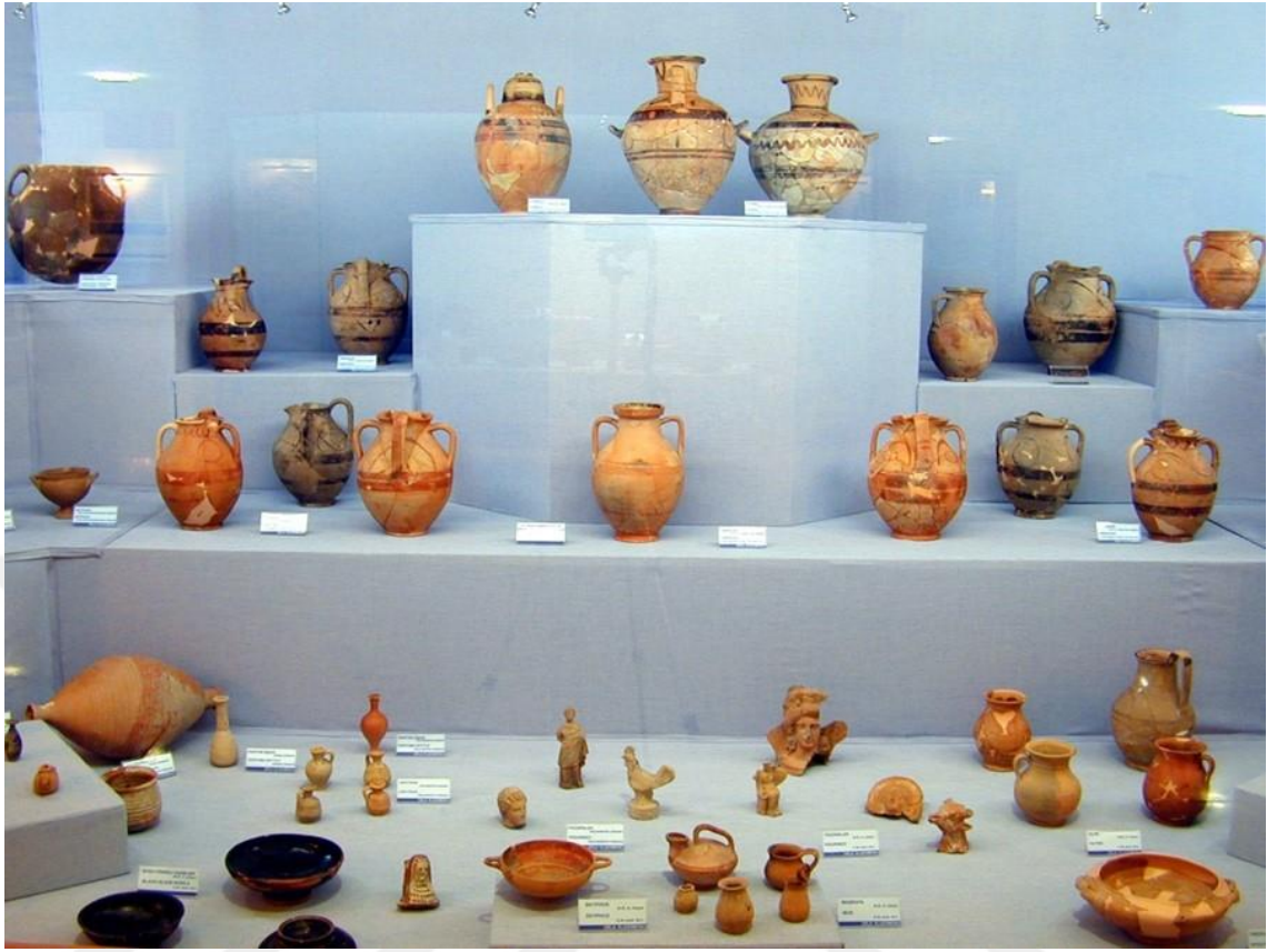
Resim 2 - Tarihi eserlerin sergilendiği Tarih ve Sanat Müzesi (İzmir Arkeoloji Müzesi, Web)

Müzecilik daha kapsamlı bir şekilde değerlendirildiğinde; Osmanlı'dan günümüze kadar olan süreçte, Türkiye'de müzecilik anlayışı Batı'daki gibi bir gelişme göstermemiştir. Batı toplumlarında ise koleksiyonculuğun, orta çağda var olan asillerin değerli eşya toplama merakı sayesinde geliştiği görülmektedir. Türklerde de eski eserlere olan ilginin Selçuklu dönemine kadar uzandığı görülmektedir. Osmanlı'ya gelindiğinde ise müzecilik yönetici sınıfın girişimi sayesinde başlamıştır. Hatta Sultan Abdülmecit' in isteğiyle açılmış olan ilk sergi de bunu göstermektedir (Sezer, 2010: 47-48).