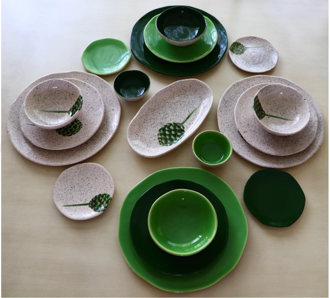
Fotoğraf 33 - Yemek grubu çift kişilik kombin görünümü