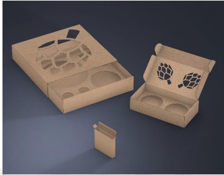
Şekil 1 - Ege Ctp Dijital Baskı ve Ambalaj firması tarafından tasarlanmış görsel