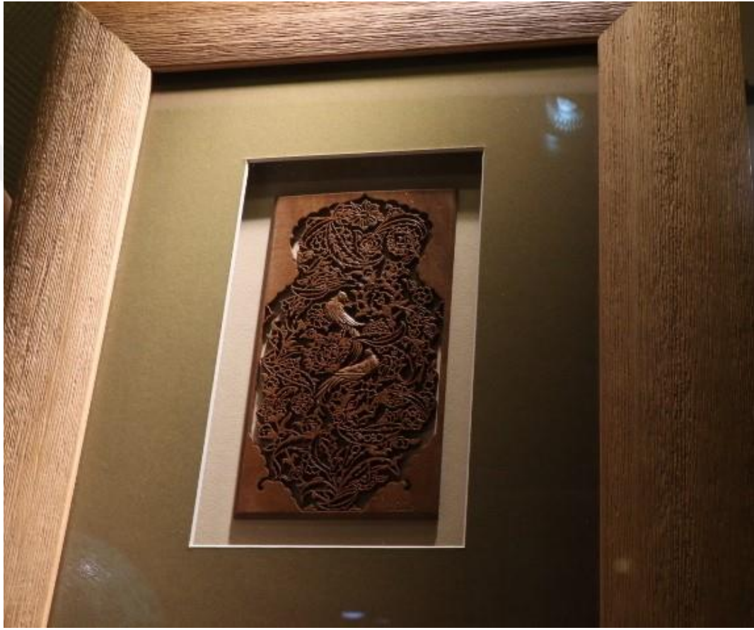
Fotoğraf 7 - Ahşap işleme pano, Naht-Sedef atölyesi (Başdurak-Kemeraltı Turistik El Sanatları Çarşısı, Fotoğraf: E. Sultan Çeşmeci, 2019)

olan kuşaklara aktarmışlardır. Bu ortaya konulan maddi ve manevi olgular, toplumun kültürel değerlerini oluşturmaktadır. Ahşap malzeme, insanoğlunun tarih boyunca, en sık kullandığı malzemelerden birisi olup, zaman içerisinde süsleme özelliği de taşımaya başlamıştır. Ağaç malzemenin, işlenerek, süs ve kullanım eşyası biçimini almasına ahşap sanatı denmektedir.