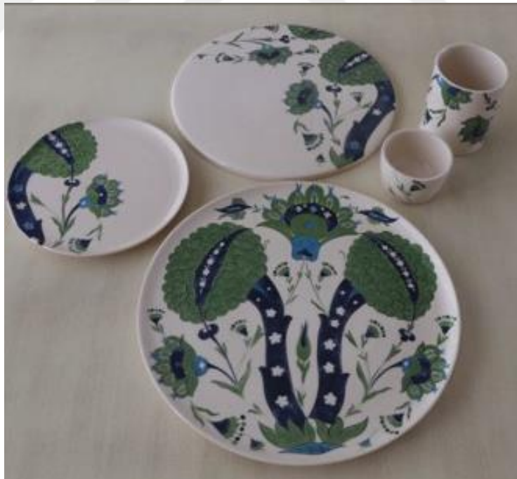
Fotoğraf 22 - Kahvaltı grubu 5 parça, tek kişilik görünüm