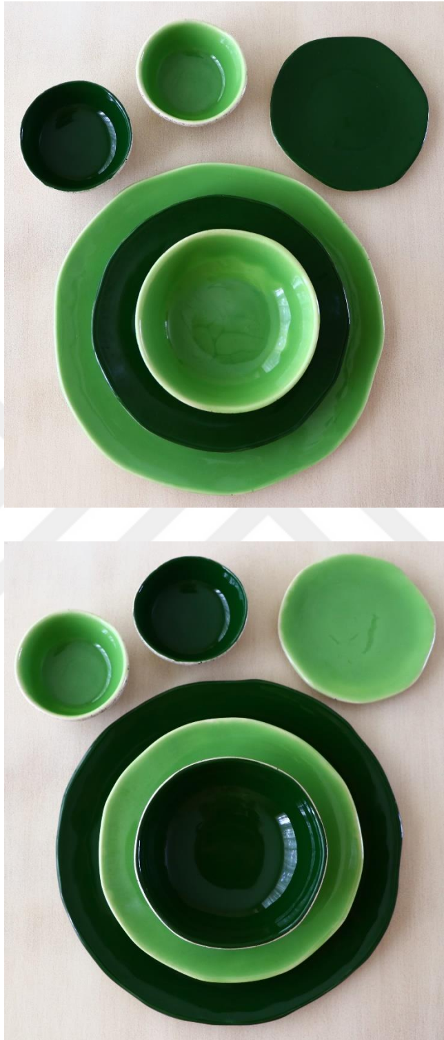
Fotoğraf 32 - Yemek grubu 12 parça, renkli sırlı grup (diğer standart parçalar ile ölçüler aynı)