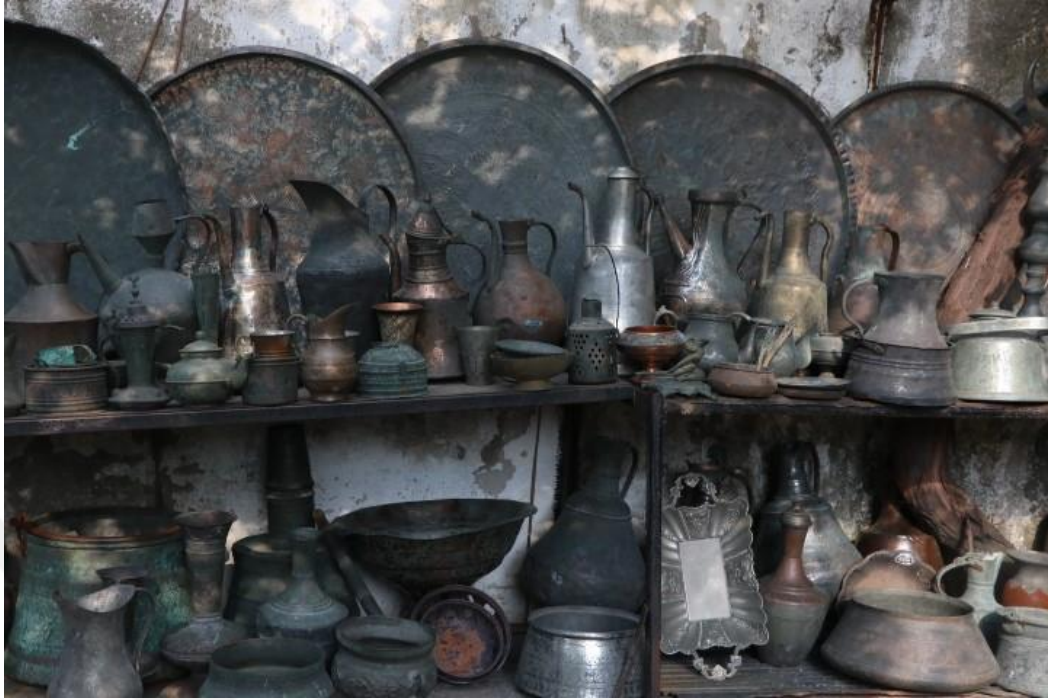
Fotoğraf 1 - Bakır kullanım eşyaları, Orhan Yıldırım - Bakır Atölyesi (Kemeraltı, Fotoğraf: E.Sultan Çeşmeci, 2019)