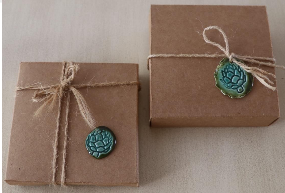
Fotoğraf 36 - Uygulama işleri için hazırlanmış ambalajlar (Fotoğraf: E.Sultan Çeşmeci, 2019)