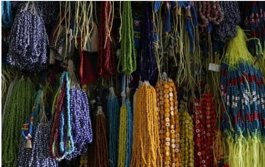
Fotoğraf 5 - Cam boncuklar, Alp Mavi Boncuk (Kemeraltı, Fotoğraf: E. Sultan Çeşmeci, 2019)