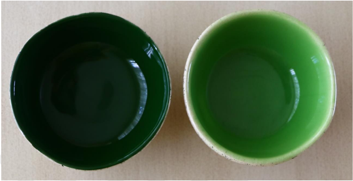
Fotoğraf 30 - Yemek grubu - Kaseler, Büyük boy kâse, 11.5x5 cm / Küçük boy kâse, 8.5x4 cm