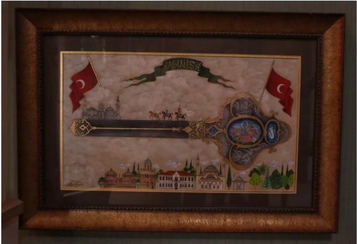
Fotoğraf 9 - Minyatür tablo, Arya Kamalı - Minyatür Atölyesi (Kızlarağası Hanı, Fotoğraf: E. Sultan Çeşmeci, 2019)

olduğu anlamına gelmektedir. Yani öndeki insan ile arkadaki insan oranı arasında fark olmamaktadır. Kısacası, yakınlık uzaklık belirtecek hiçbir ibare bulunulmaz, insanlar veya nesnelere hiçbir açıdan boyutlandırılmazlar.