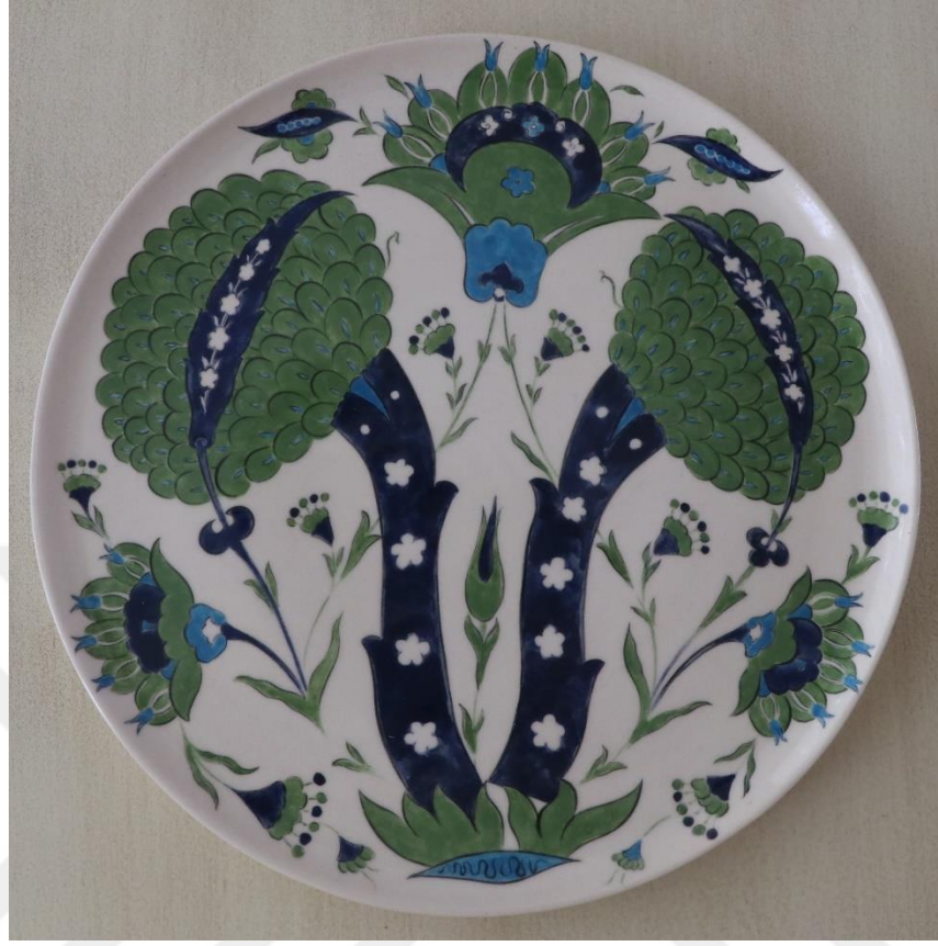
Fotoğraf 18 - Kahvaltı grubu – Büyük boy servis tabağı, 22.5x1.5 cm