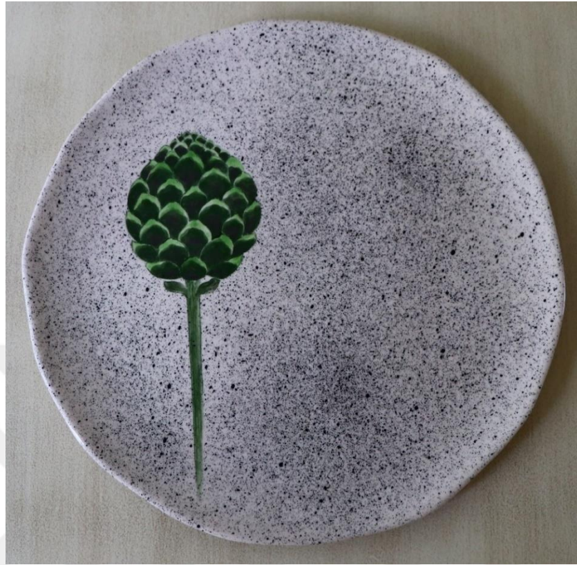
Fotoğraf 24 - Yemek grubu - Büyük boy servis tabağı, 26x1.5 cm