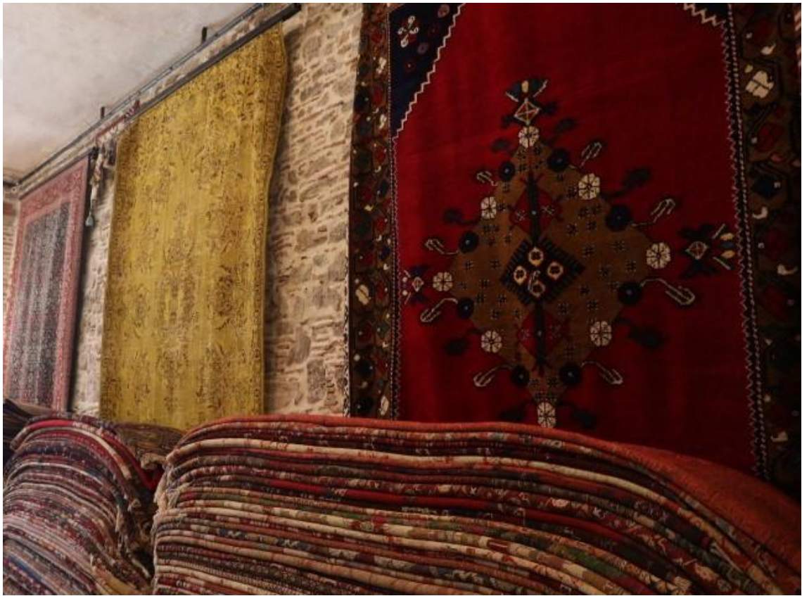
Fotoğraf 13 - El dokuması halılar, Merkez Halı (Kemeraltı, Fotoğraf: E. Sultan Çeşmeci, 2019)

uydurarak, kültürel ortamda hayat bulmak için dokumacılığı geliştirmiştir (Beşen, 2011: 3). Önceleri insanların, yaygı ve örtü ihtiyaçlarını karşılamak için dokudukları halı, zamanla kültürel, endüstriyel ve ticari kimlikler kazanmış, ve tarih içinde gelişerek mekânlarda değerlendirilmek üzere ya da sanat eseri olarak, mabetleri, sarayları ve şatoları süslemiştir. Zaman içerisinde uluslararası boyutta tanınmış, ve belirli dönemlerde ünlü ressamların tablolarında resmedilerek, konuyu bütünleyen ana tema olarak yer almıştır (Atukeren, 2014: 3).