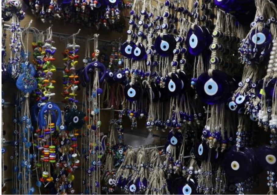
Fotoğraf 4 - Cam boncuklar, Alp Mavi Boncuk (Kemeraltı, Fotoğraf: E. Sultan Çeşmeci, 2019)

ürünlerini günümüz anlayışına yönelik sürdürmektedirler ve tüm turistik bölgelere pazarlamaktadırlar.