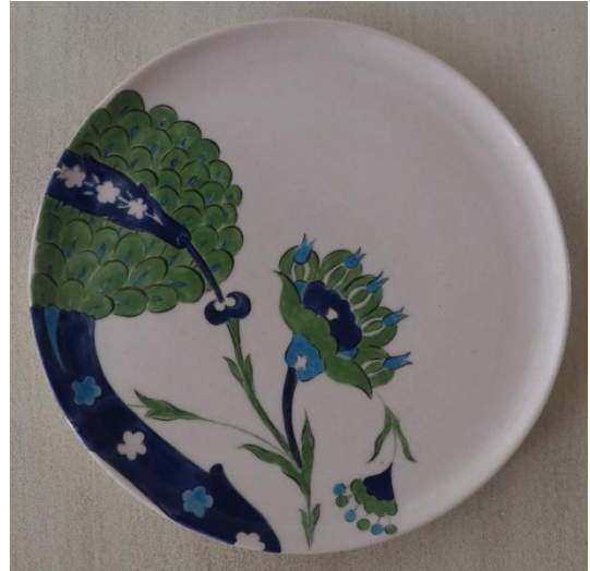
Fotoğraf 19 - Kahvaltı grubu - Küçük boy servis tabağı, 14.5x1.5 cm