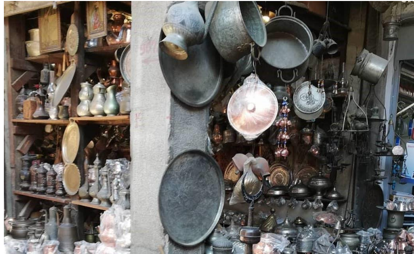
Fotoğraf 2 - Bakır kullanım eşyaları, Yıldırım Bakırcılık (Kemeraltı, Web)

Özellikle Anadolu'nun bazı şehirlerinde madencilik daha önemli bir yer tutmaktadır. Günlük hayatta madeni eşyalara verilen önem, alışkanlıklara bağlı olarak