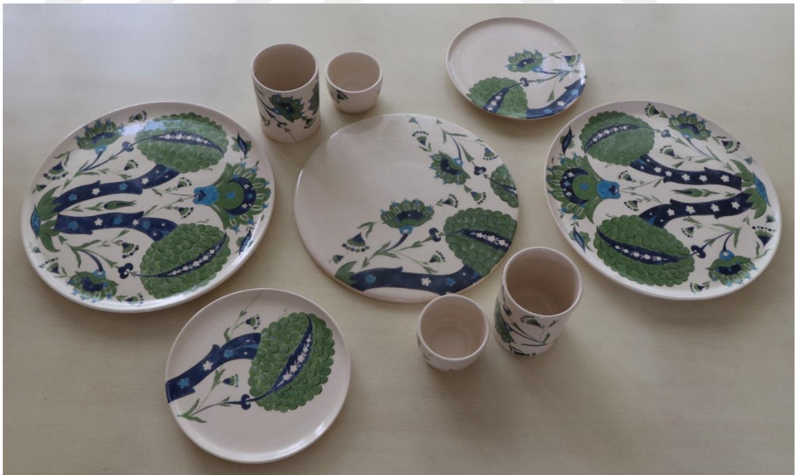
Fotoğraf 23 - Kahvaltı grubu 9 parça, çift kişilik görünüm