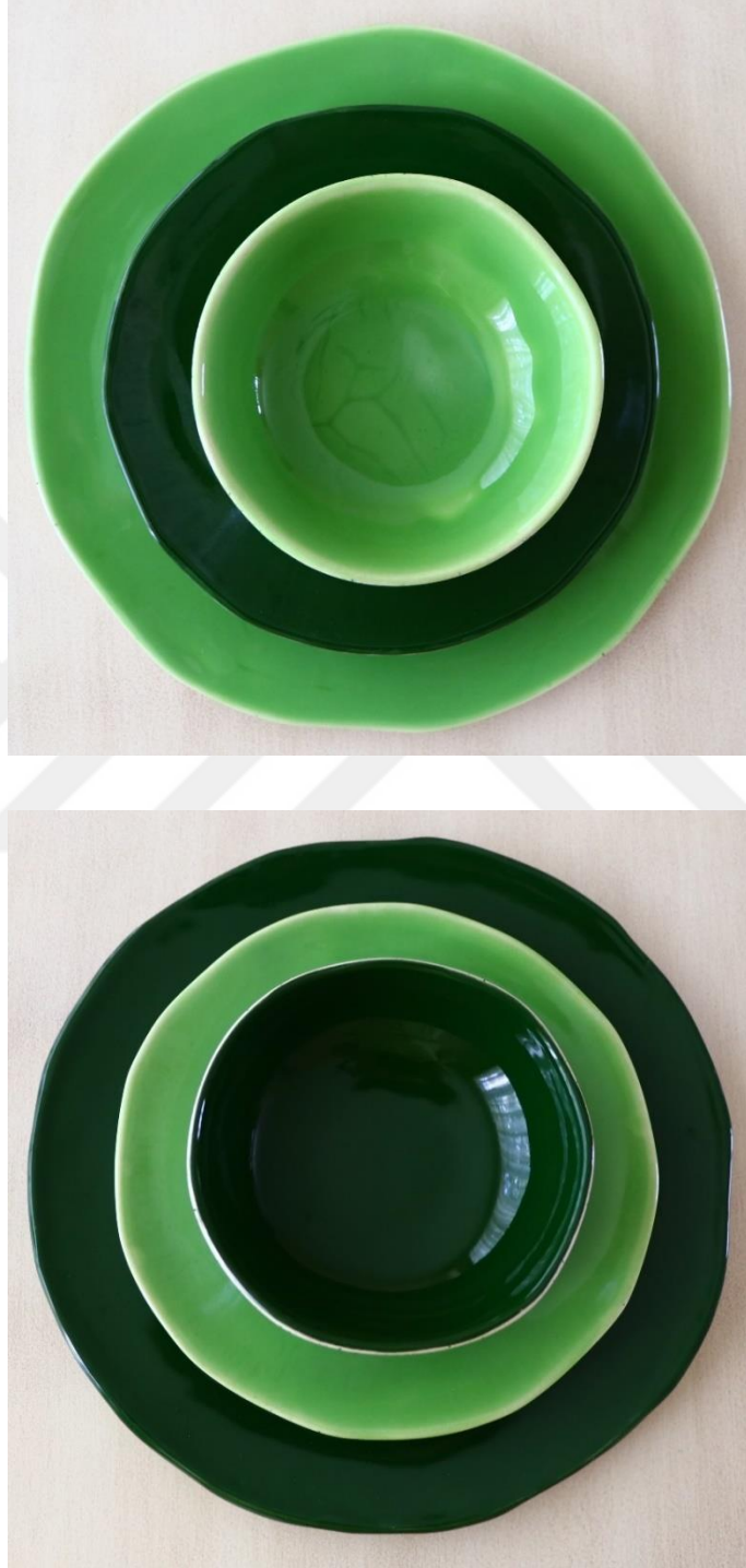
Fotoğraf 29 - Yemek grubu - Renkli sırli grup (diđer standart parçalar ile ölçüler aynı)