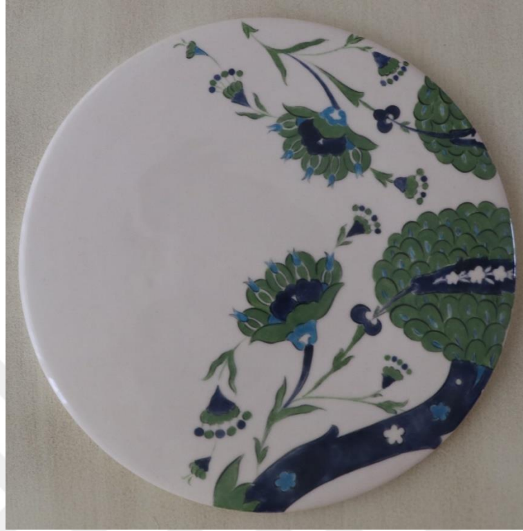
Fotoğraf 20 - Kahvaltı grubu- Sunum tabağı, 20.5x0.5 cm