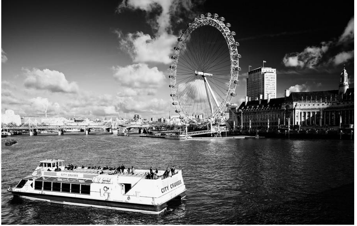
Resim 1 - London Eye (Londra, Web, 2009).

Böylece, 1870 yılında demir üretimi için elektriğin kullanılmasıyla başlayan turizm faaliyetlerinin, ekonomik anlamdaki tarihsel gelişimine göz atıldığında II. Sanayi Devrimi ile paralellik gösterdiği görülmektedir. Sanayi Devrimi çağdaş turizmin doğması ve gelişmesi için gerekli olan altyapıyı hazırlamış, zaman içinde turizm olgusunu hızlandıran önemli faktörlerden biri olmuştur (Bahar, Kozak, 2013: 4).