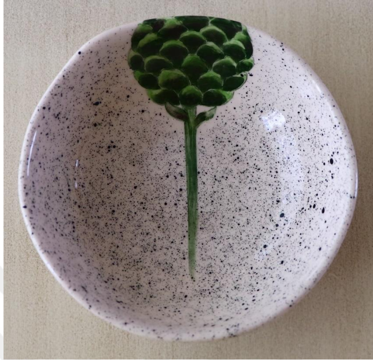
Fotoğraf 26 - Yemek grubu - Çorba kasesi, 13x5 cm