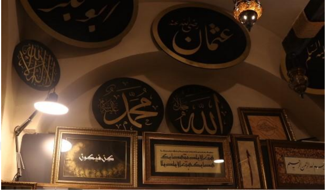
Fotoğraf 11 - Hat yazılı tablolar, Yazıhane (Başdurak-Kemeraltı Turistik El Sanatları Çarşısı, Fotoğraf: E. Sultan Çeşmeci, 2019)

Ancak bu durum mesleğe gerçekten gönül vermiş sanatçılar için söz konusu olmamakla birlikte, yapmış oldukları eserleri ile her bünyede ustalıkla çalışan sanatçıların var olduğu ve icra ettikleri eserlerinin nitelikli örnekler olduğu bilinmektedir. Ancak bu oran kıyasla öylesine azdır ki, bu da hat sanatının ne denli zor şartlarda ve ustalık isteyen bir dal olduğunu ispatlamaktadır.