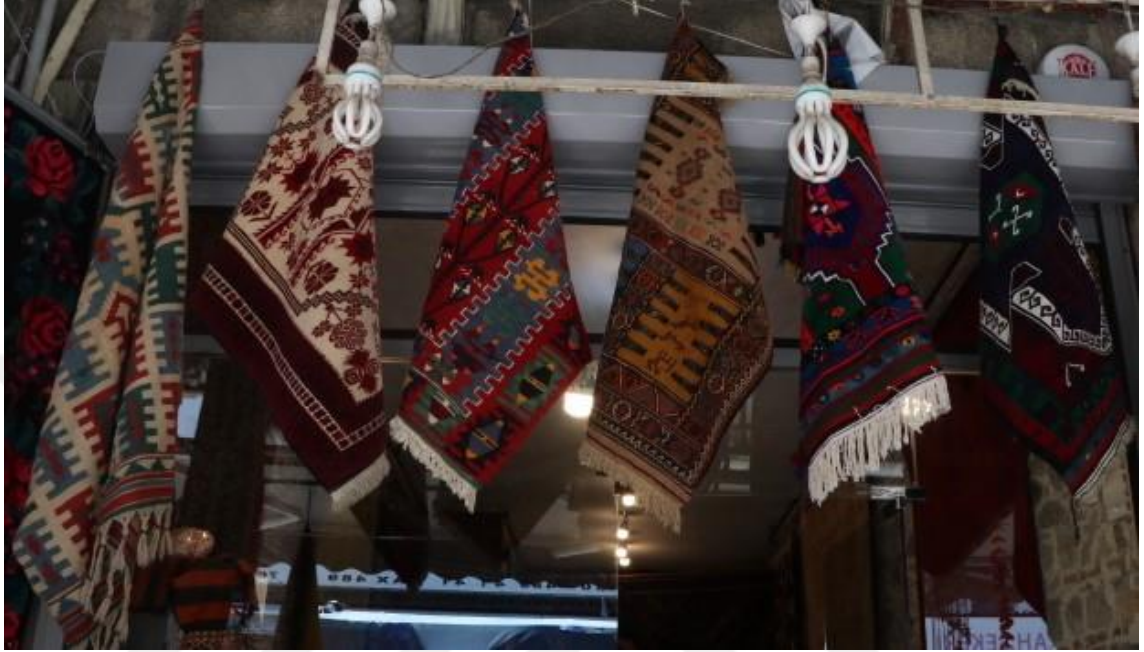
Fotoğraf 14 - El dokuması kilimler, Merkez Halı (Kemeraltı, Fotoğraf: E. Sultan Çeşmeci, 2019)

olan bu topraklarda halıcılığa rastlanırken, Türk soylarının var olmadığı yerlerde ise halıcılığa hemen hemen hiç rastlanmamıştır (Beşen, 2011: 6).