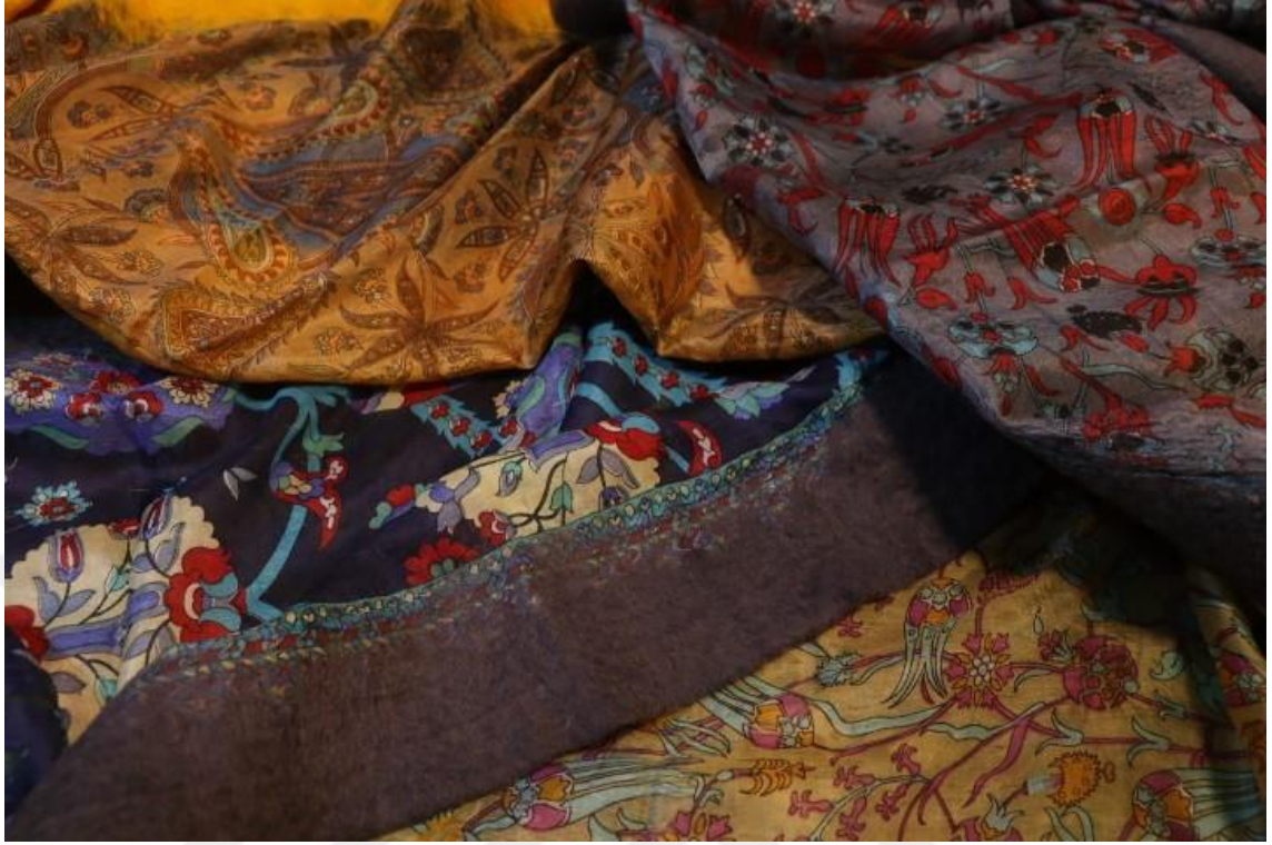
Fotoğraf 12 - İpek ve keçe ile üretilmiş şallar, Nela Keçe Tasarım (Başdurak-Kemeraltı Turistik El Sanatları Çarşısı, Fotoğraf: E. Sultan Çeşmeci, 2019)

Özellikle, renkleri, desenleri ve sembol dili ile konumlandıkları anlamları bakımından, tanınan önemli el sanatlarımızdandır. Türk el dokumaları bu yönüyle sanat yapıtlarına da önemli katkılar sağlamış, kullanıldıkları alanlara ve dönemlere bağlı olarak Avrupa’da üretilen sanat eserlerine, görsel bir zenginlik kazandırmışlardır (Aytaç, 2008: 205). Tarihin akışı içerisinde Orta Asya’da başlayan dokumacılık, Selçuklu ve Osmanlı’da eşsiz güzellikte çok sayıda türleri ve isimleri ile devam etmiştir (Akınarlı, Başaran, 2018: 22).