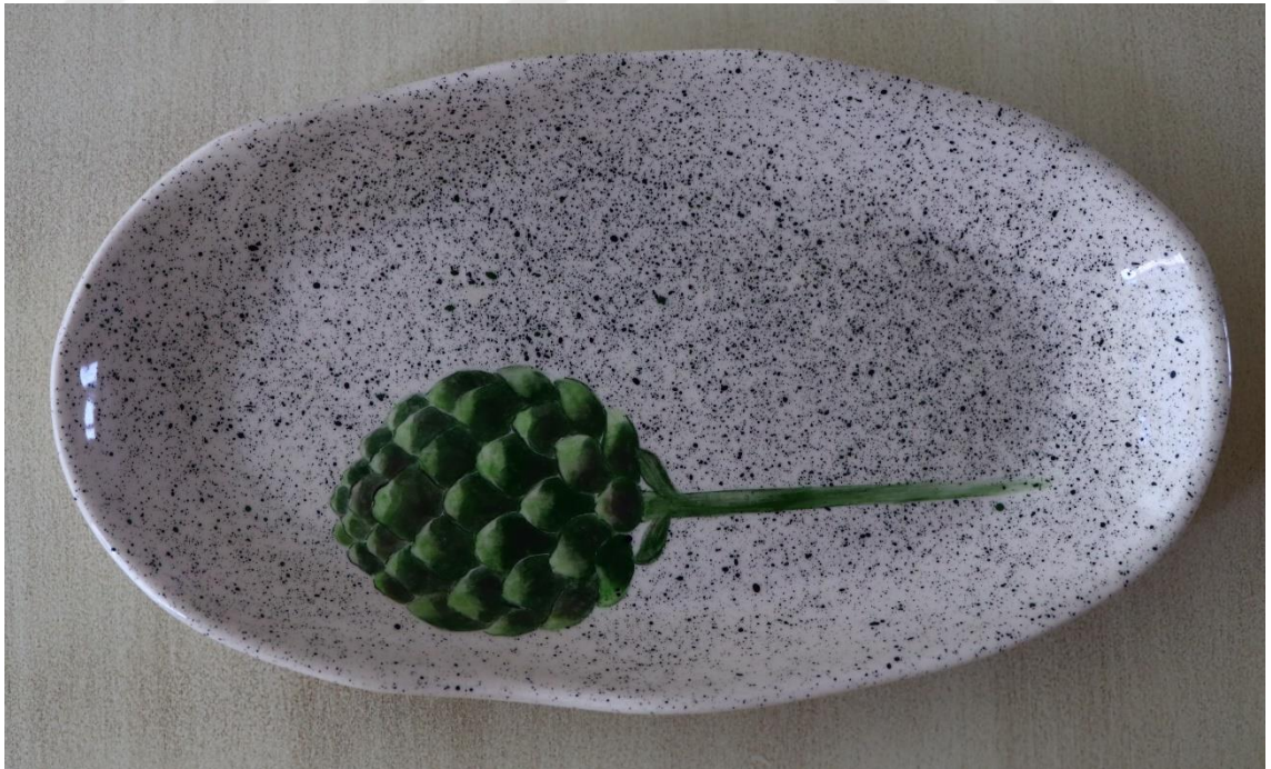
Fotoğraf 27 - Yemek grubu - Salata tabağı, 24x13.5x3 cm (Fotoğraf: E.Sultan Çeşmeci, 2019)