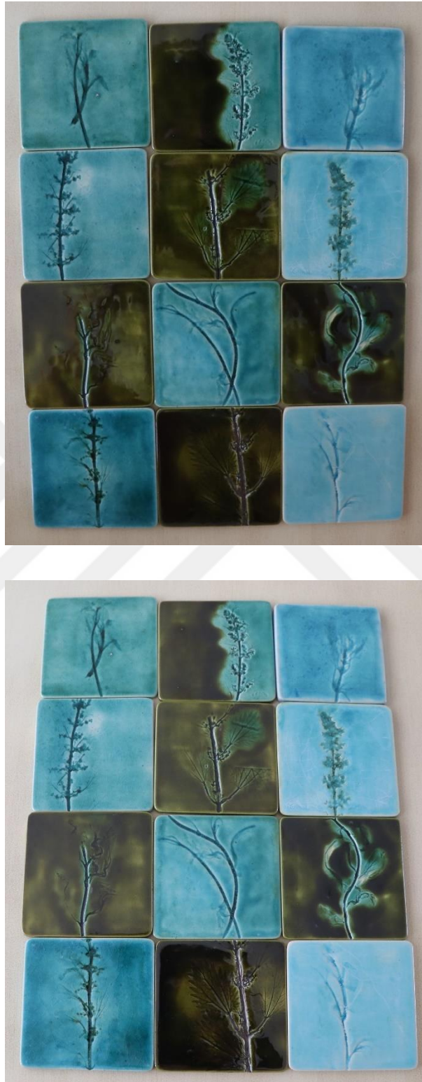
Fotoğraf 34 - Aksesuar grubu - Bardak altı, 9.5x9.5 cm