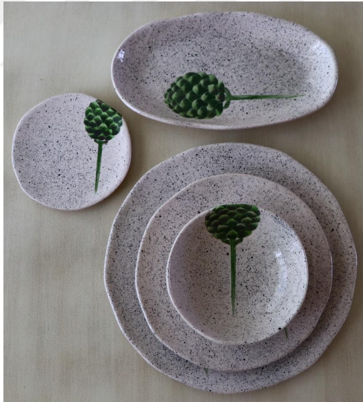
Fotoğraf 28 - Yemek grubu 3 ve 5 parça, tek kişilik görünüm